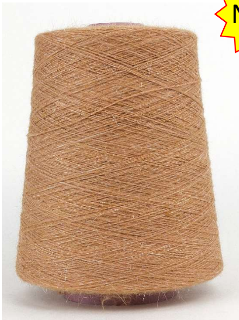
Farbe Orangeous Farbnummer. MLE1