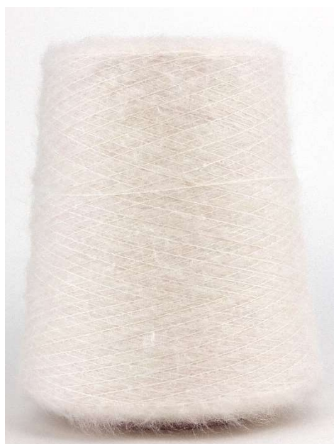
Farbe Avorio Farbnummer. 1218