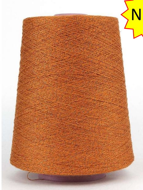
Farbe Crusca Farbnummer. V8I