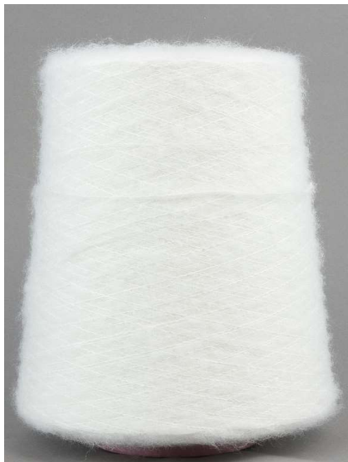
Farbe Bianco Farbnummer. CVS