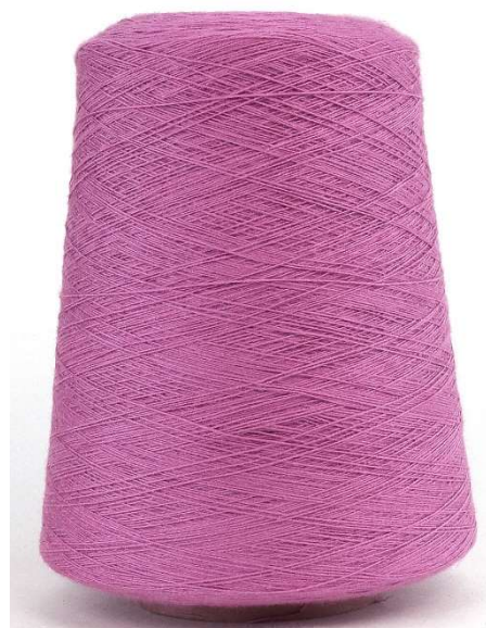
Farbe Dunkelflieder Farbnummer. 7FZ