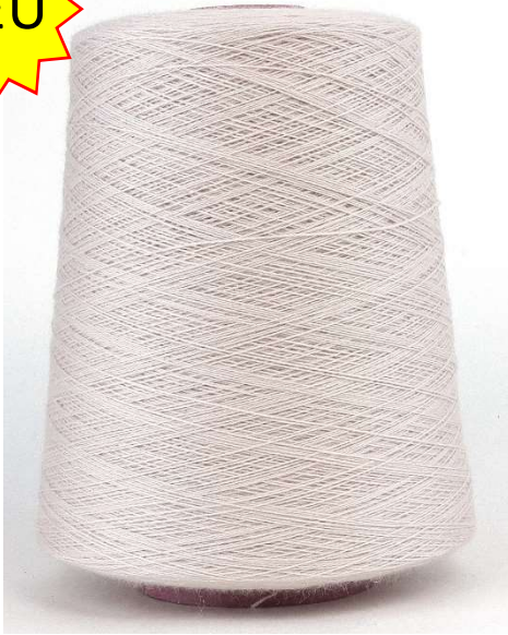
Farbe Biscuit Farbnummer. RS1