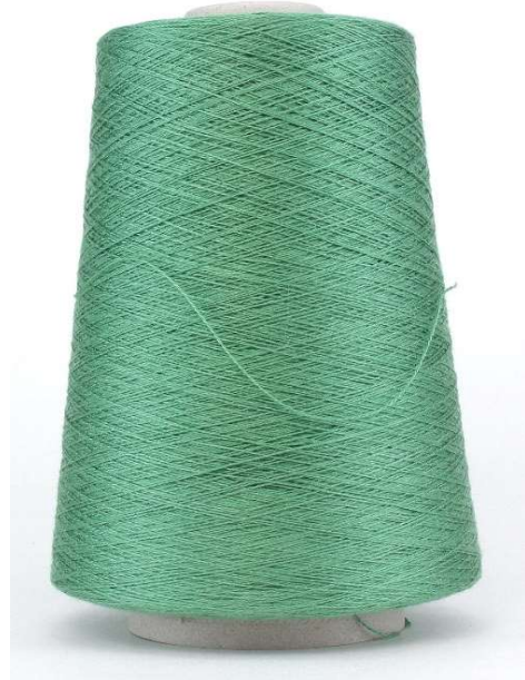
Farbe Militare Mela Farbnummer. EIQ