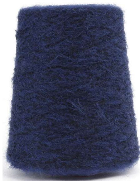
Farbe Royal Farbnummer. 22513