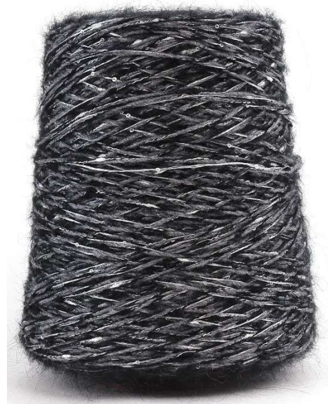
Farbe Nero Farbnummer. 4915