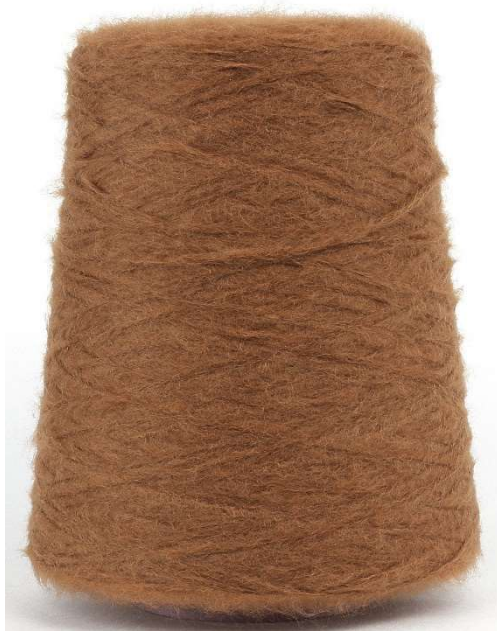
Farbe Calvados Farbnummer CRS