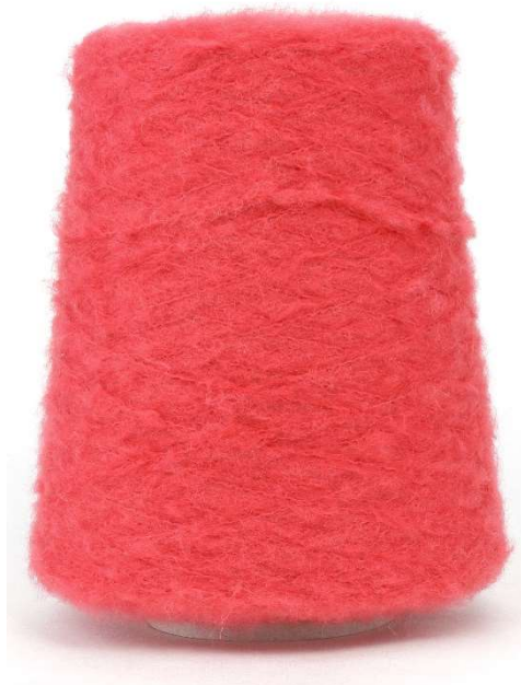
Farbe Cayenne Farbnummer. HS1