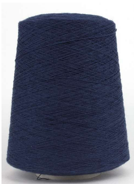
Farbe Fiele Farbnummer. 198