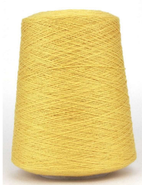
Farbe Honey Farbnummer. KAX