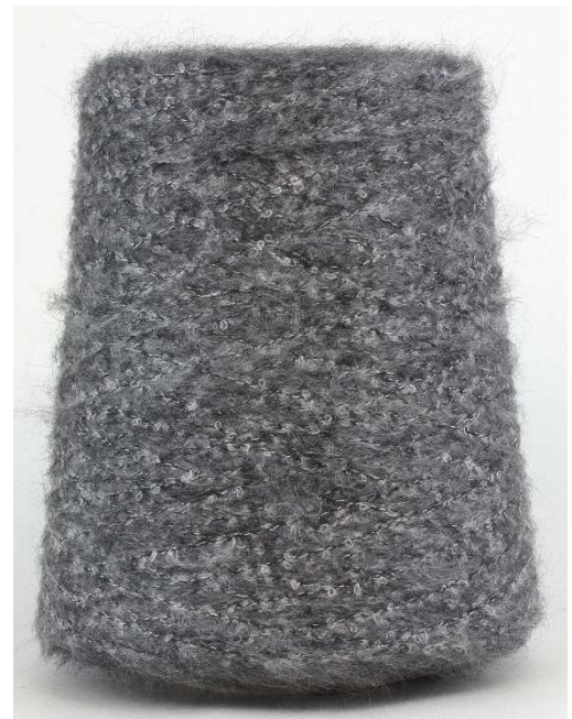
Farbe Anthracite Farbnummer. 2140