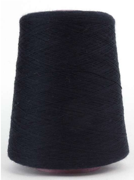
Farbe Nightblue Farbnummer. 008800