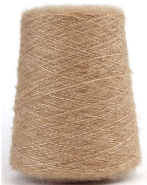
Farbe Shugero Farbnummer. 94F