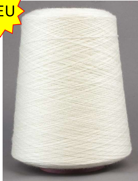
Farbe Natur Farbnummer. CSV