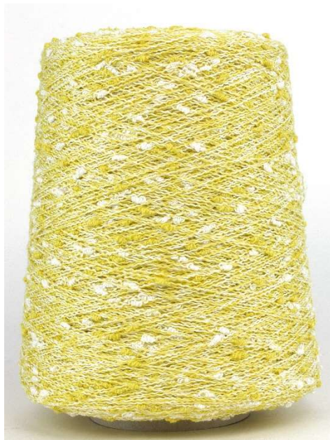
Farbe Cedro Farbnummer. VGL