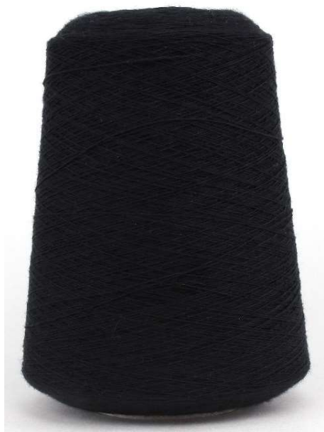
Farbe Nero Farbnummer. 099