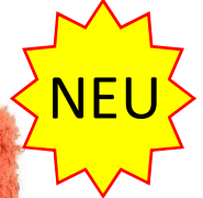
Farbe Orange Farbnummer. CZK