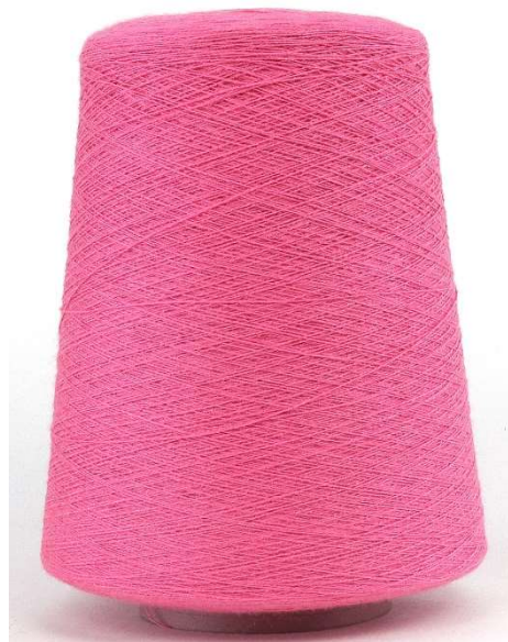
Farbe Karminrose. Farbnummer. G48