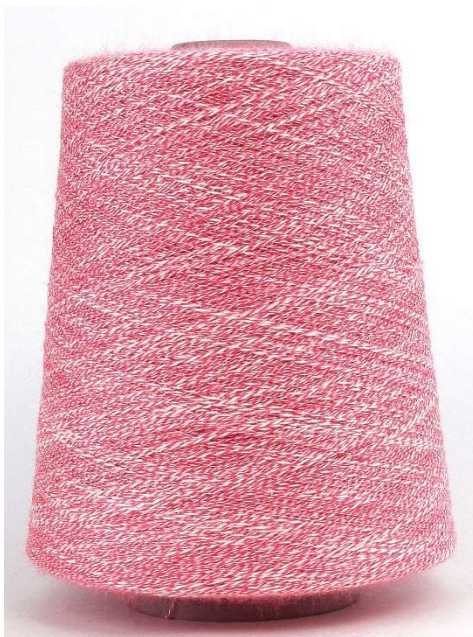
Farbe Magenta Farbnummer. TNL