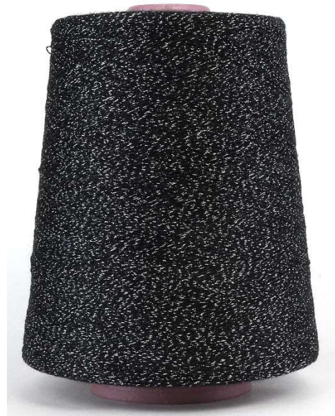
Farbe Lavagna Farbnummer. VY3