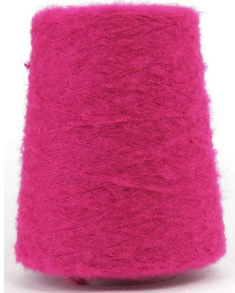
Farbe Fuchsia Farbnummer. HE6