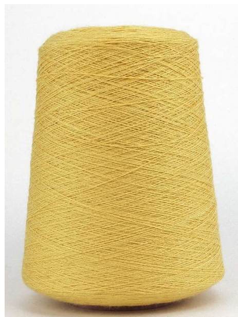
Farbe Giallo Farbnummer. EPB