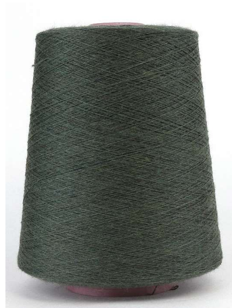
Farbe Moos Farbnummer. 9P2