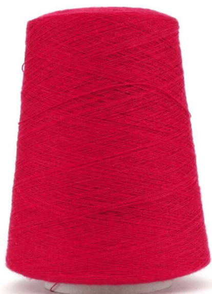
Farbe Rot Farbnummer. HI1