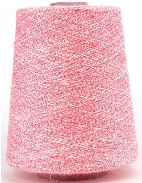
Farbe Oleander Farbnummer 34J