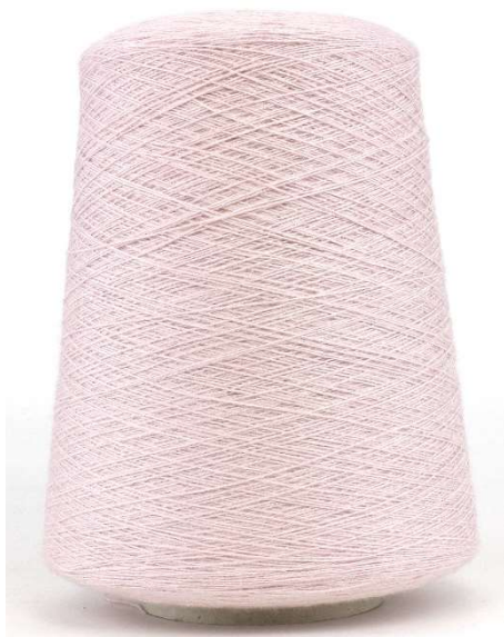
Farbe Orchid Farbnummer. HU7