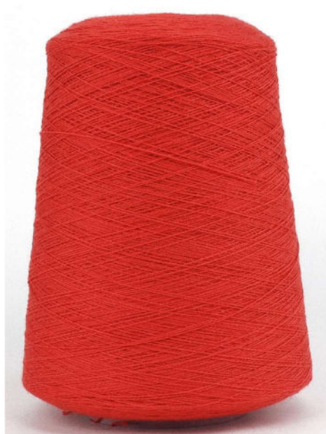
Farbe Paprika Farbnummer. HAA