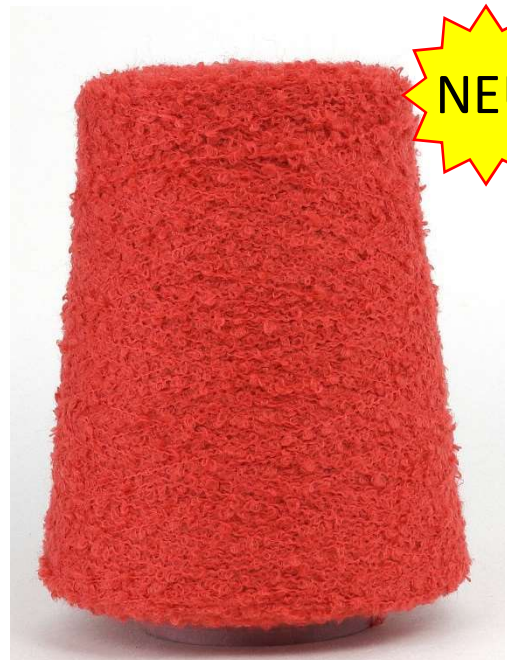
Farbe Rame Farbnummer. B1W