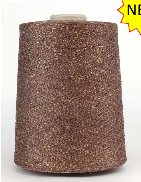
Farbe:Beige Tabak Farbnummer: 1376