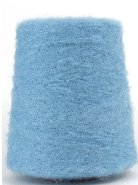
Farbe Ozean Farbnummer. 5BW