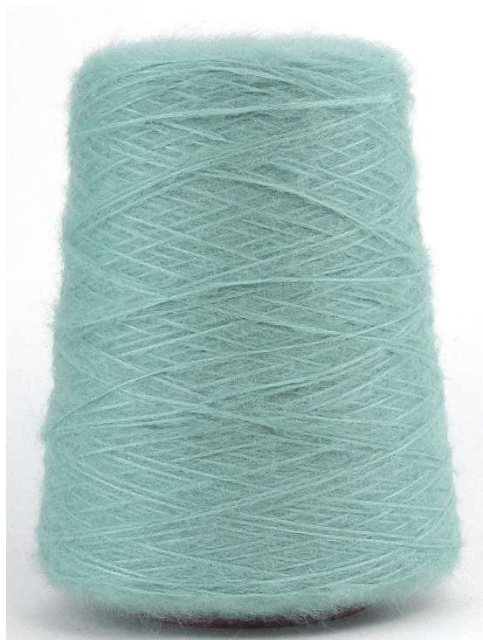
Farbe Mineralgrün Farbnummer. 9LU