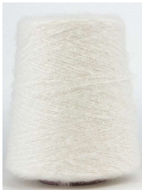
Farbe Elfenbein Farbnummer. EZT