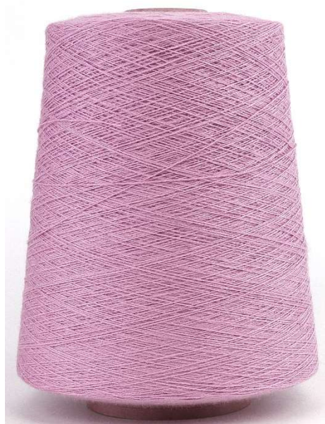
Farbe Jasmine Farbnummer. 6ZE