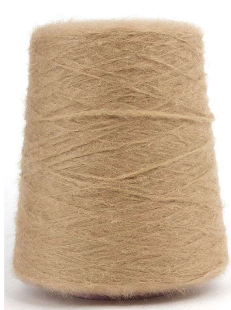
Farbe Peanut Farbnummer 04Y