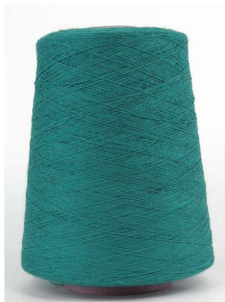
Farbe Petrolio Farbnummer. IUY