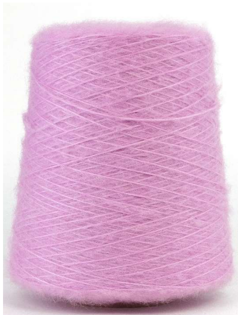
Farbe Viola Farbnummer. 6ZE