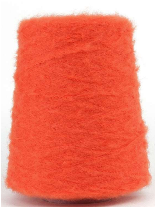
Farbe Orange Farbnummer CZK