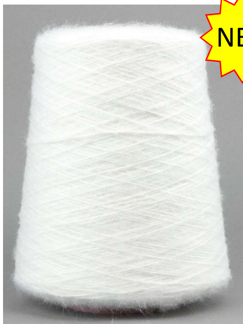
Farbe Juta Farbnummer. 007