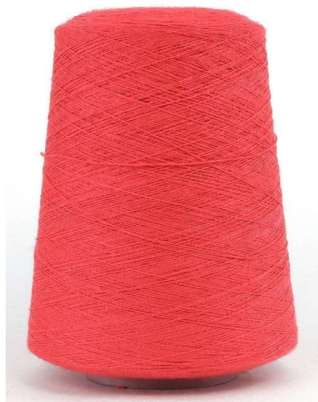
Farbe Chili Farbnummer. KAY