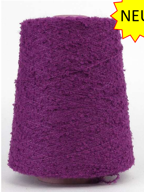
Farbe Lila Farbnummer. 3EX