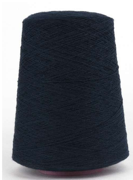
Farbe Blu Notte Farbnummer. NZ9