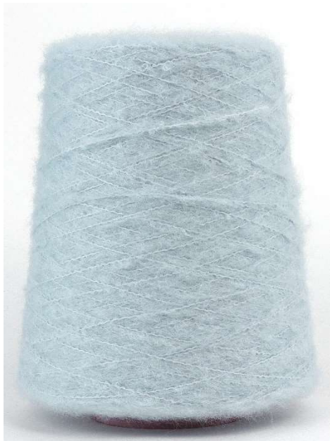
Farbe Waterblue Farbnummer. I98