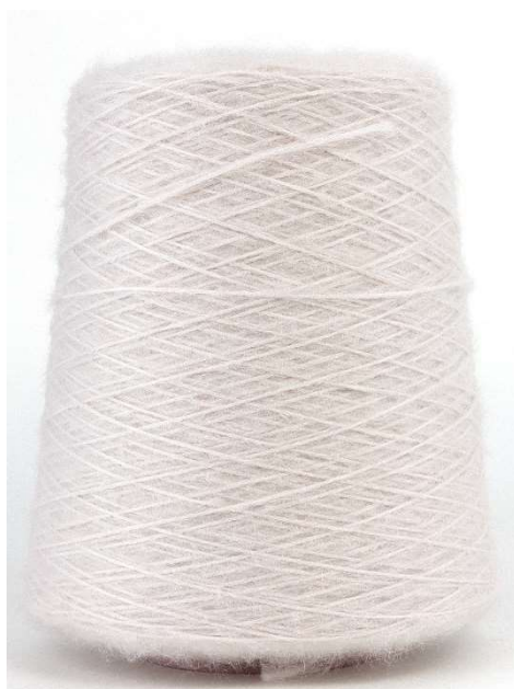
Farbe Perle Farbnummer. BK4