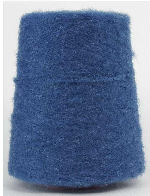
Farbe Jeans Hell Farbnummer. 8JU