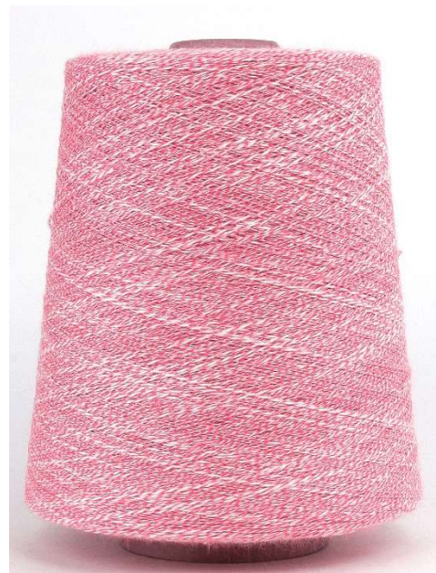
Farbe Flamingo Farbnummer. S4L