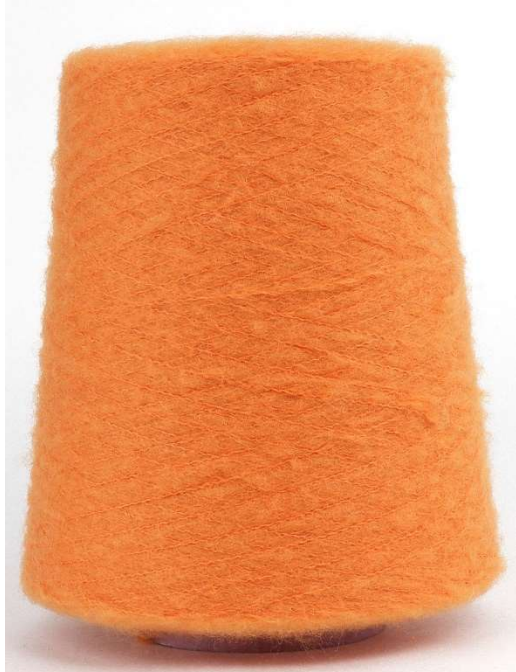
Farbe New Orange Farbnummer. 9UN