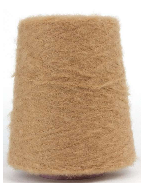
Farbe Kork Farbnummer. KWG