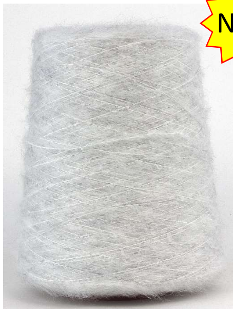
Farbe Cenere Farbnummer. 1240