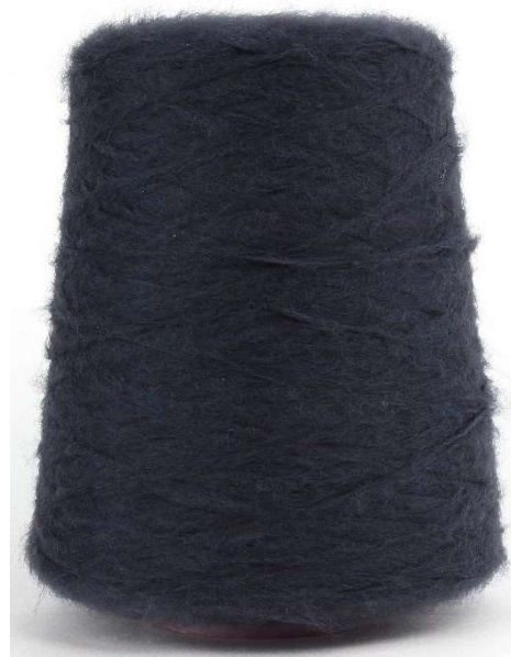
Farbe Nightblue Farbnummer. 9NZ