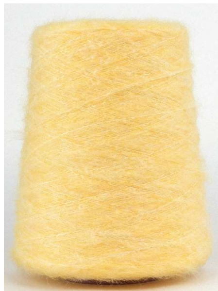
Farbe Sole Farbnummer. 111033