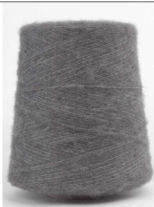
Farbe M'Grey Farbnummer. HWF