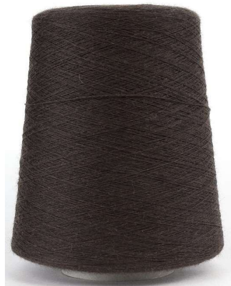
Farbe Tabacco Farbnummer. 837