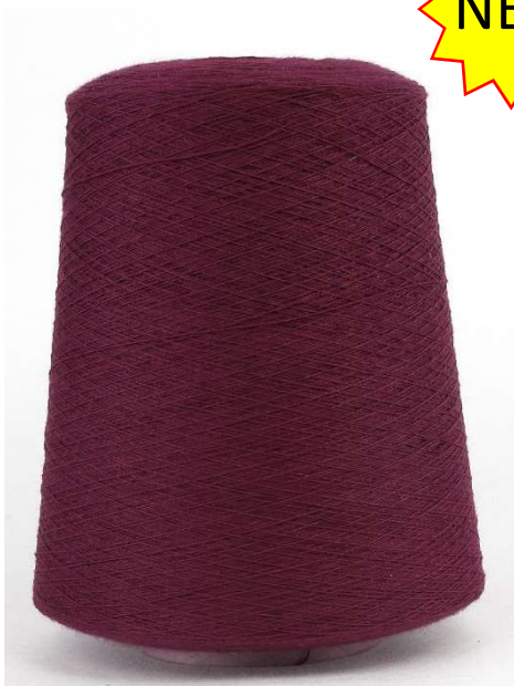
Farbe Bordeaux. Farbnummer. HK1