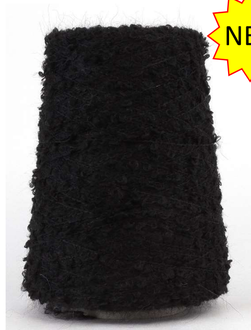
Farbe Nero Farbnummer. 099