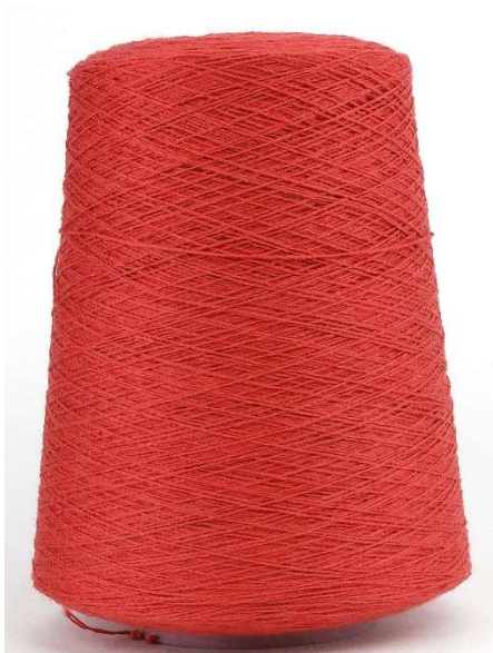
Farbe Carotta Farbnummer. B1W