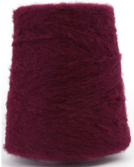
Farbe Barolo Farbnummer. ECT