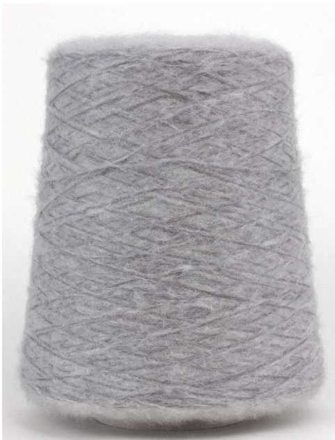
Farbe Topo Melange Farbnummer. 9S7