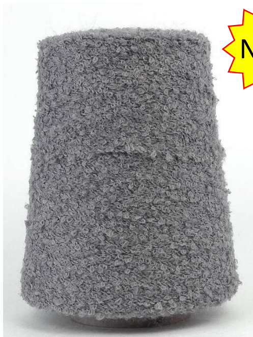
Farbe Granit Farbnummer. BK1