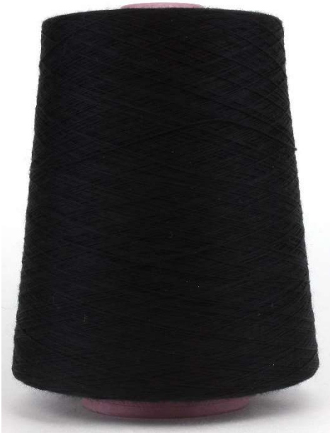
Farbe Nero Farbnummer. 099