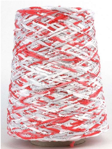
Farbe Flamingo Farbnummer. 20746