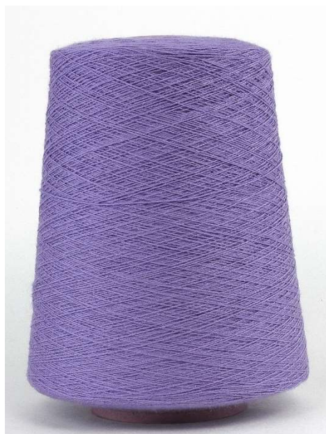
Farbe Lavendel Farbnummer. 7JT