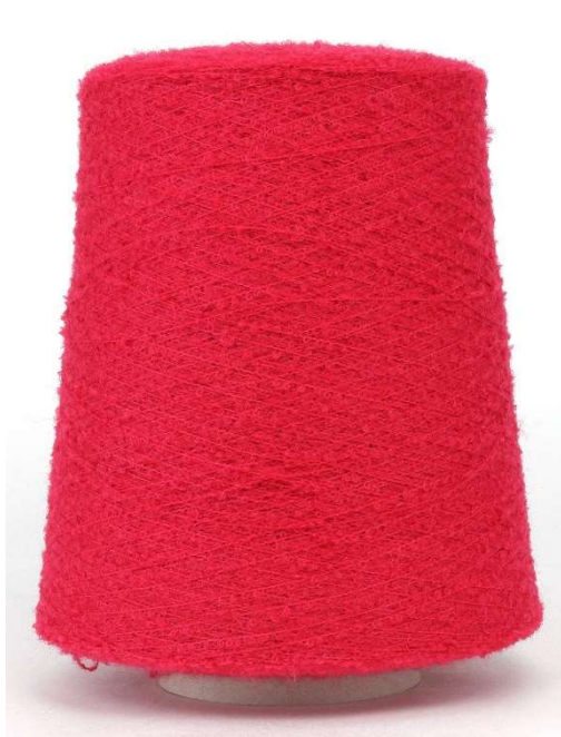
Farbe Rot Farbnummer. 702619