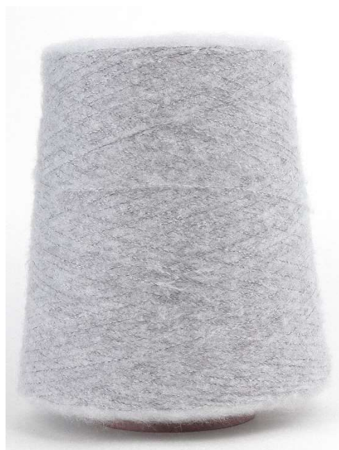
Farbe Silver Farbnummer. W33