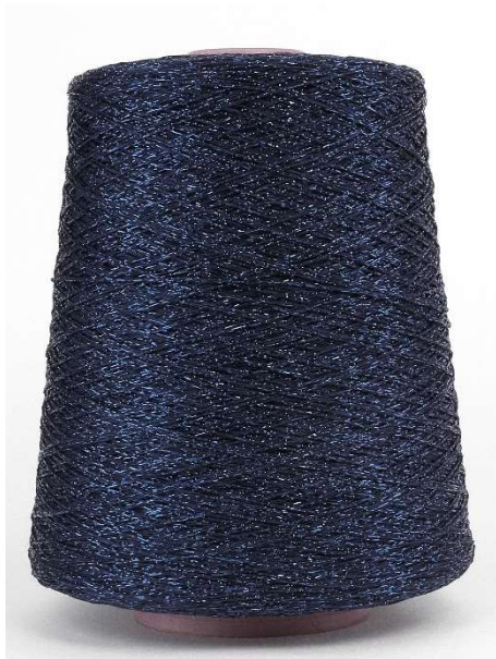
Farbe Deep Blue Farbnummer. BK 70