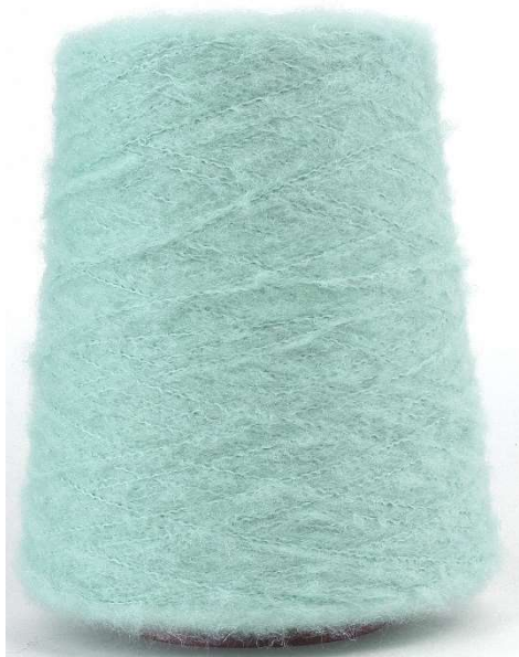
Farbe Wintertürkis Farbnummer. LU9