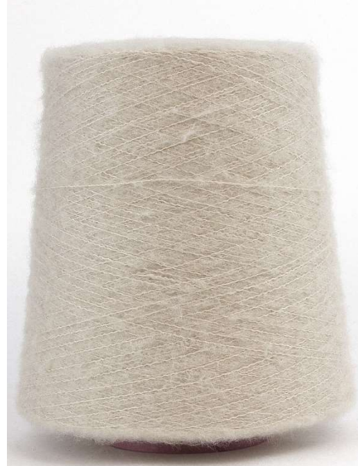
Farbe Kitt Farbnummer. 9PT