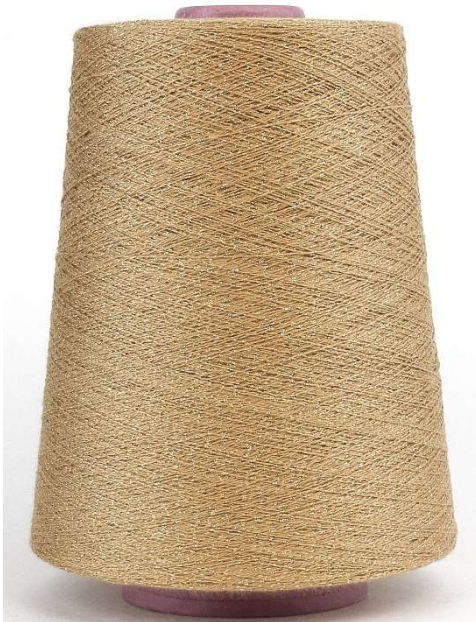
Farbe Lepre Farbnummer. VX8