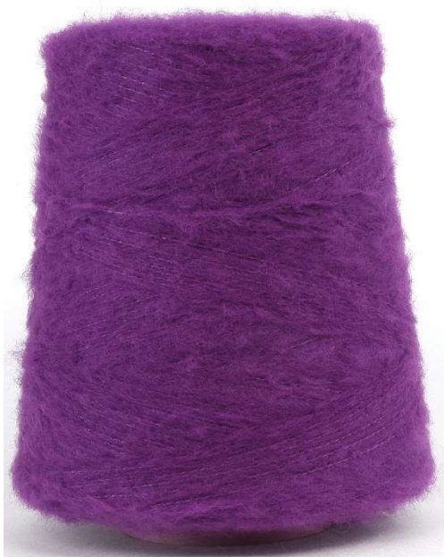
Farbe Lila Farbnummer 3EX