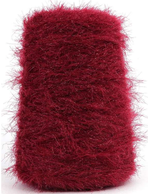
Farbe BORDEAUX Farbnummer. 112