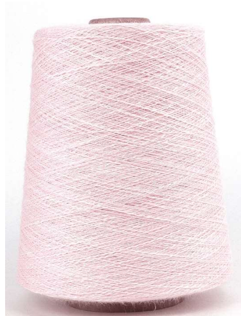
Farbe Rosa Farbnummer. 33J