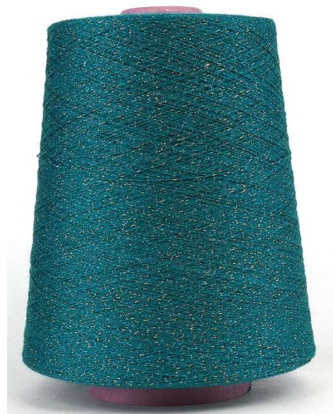
Farbe Petrol Farbnummer. VG3