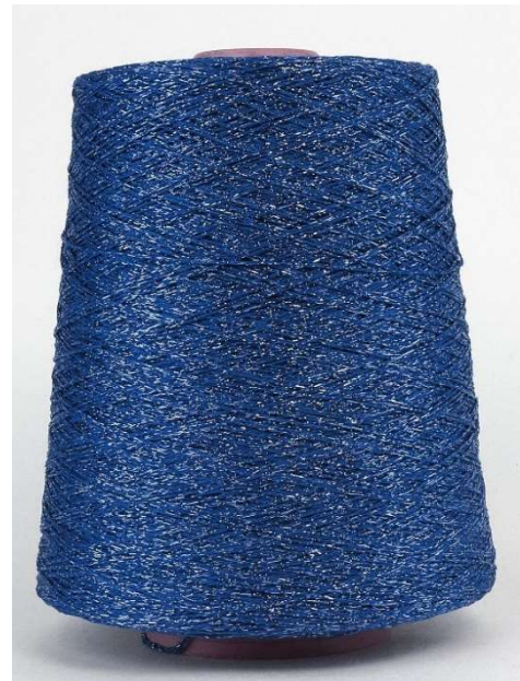
Farbe Royal Farbnummer. BK 160