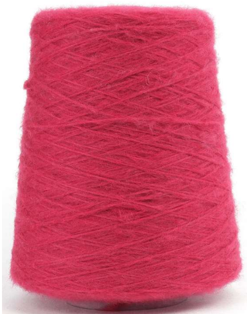
Farbe Amarena Farbnummer 9Q8