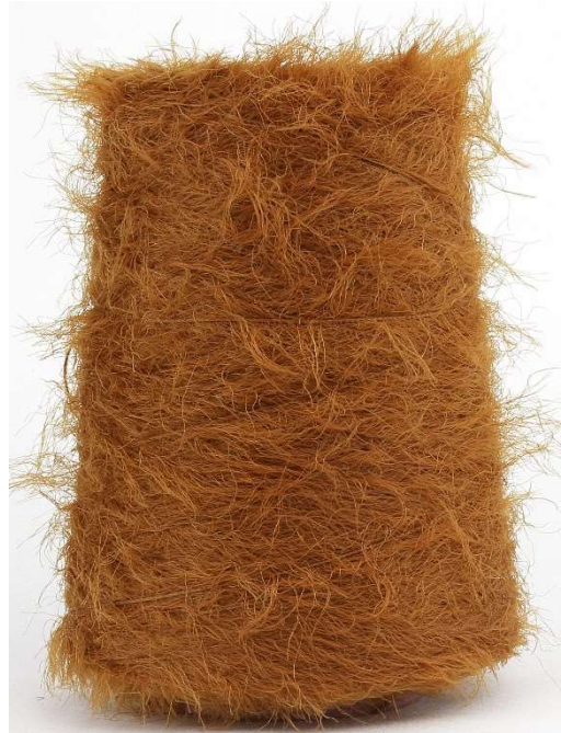
Farbe Brandy Farbnummer. S34