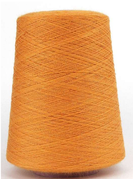
Farbe Sundance Farbnummer. 2B7