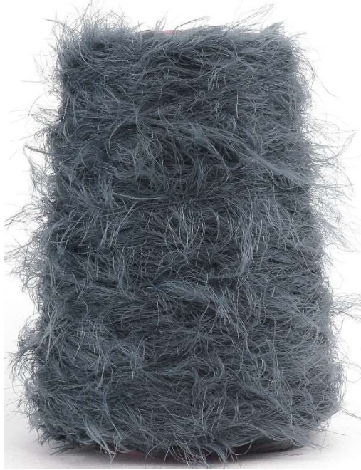
Farbe Steel Farbnummer. 284