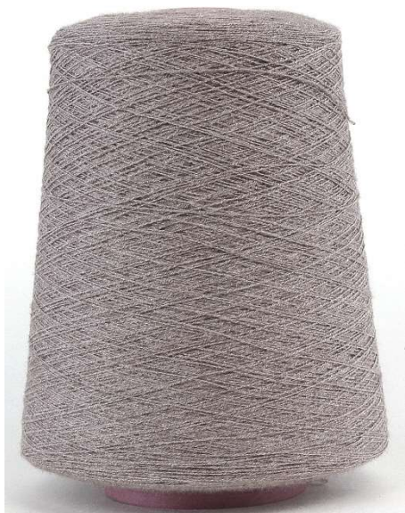
Farbe Chiccolato Farbnummer. W7Q