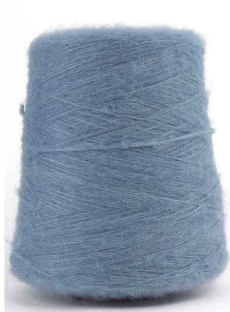
Farbe Polar Farbnummer. LOY