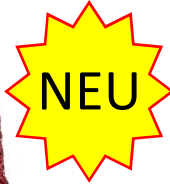
Farbe Rubin Farbnummer 446