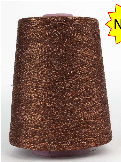
Farbe Kupfer Farbnummer: 68172