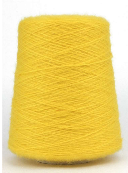
Farbe Yellow Farbnummer. 9PZ