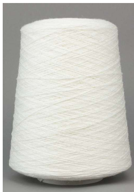
Farbe Bianco Farbnummer. CVS