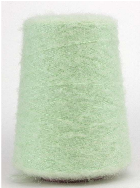
Farbe Asparago Farbnummer. 135