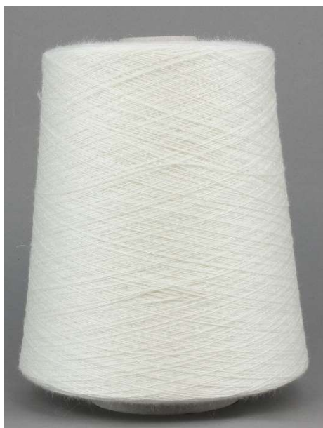
Farbe Panna Farbnummer. 10354