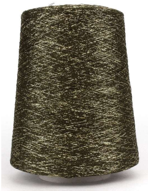
Farbe Musk Farbnummer. 68196