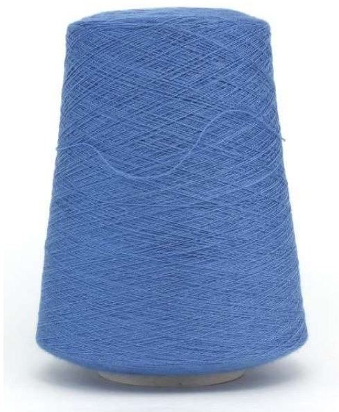
Farbe Polarblau . Farbnummer. B3C