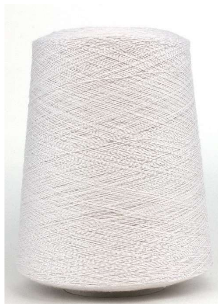
Farbe Perle Farbnummer. BK4