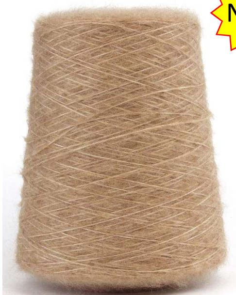
Farbe Shugero Farbnummer. 94F