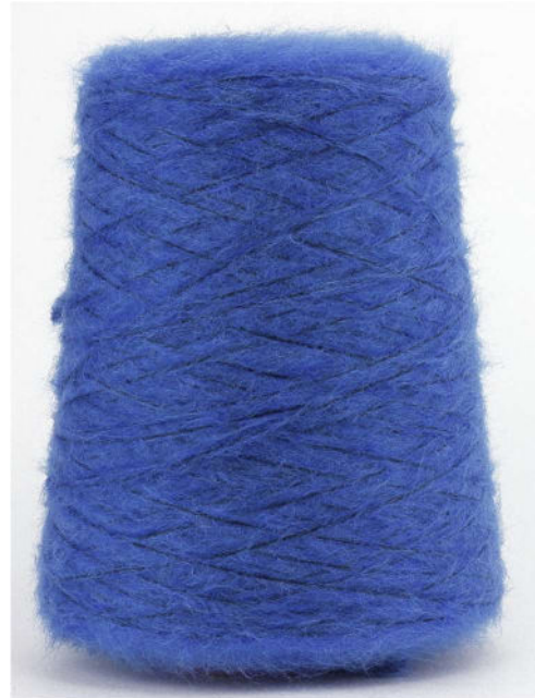
Farbe Royal Farbnummer. 94Y