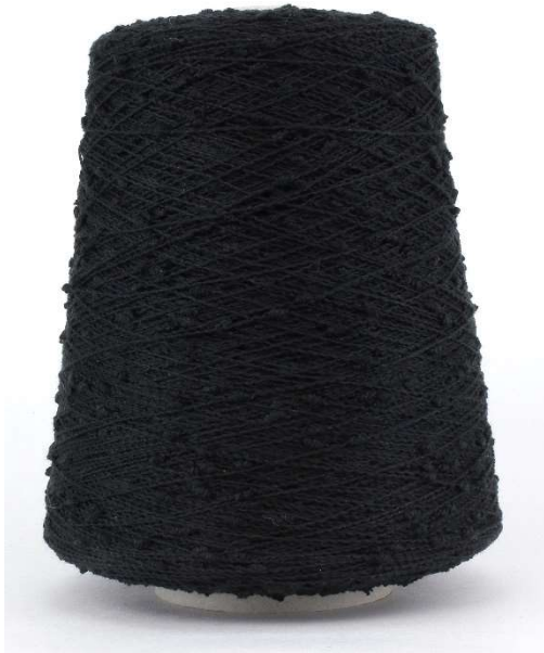
Farbe Nero Farbnummer. ZCB