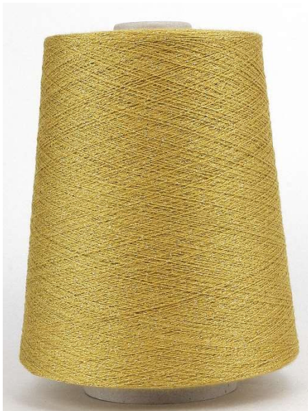
Farbe Senape Farbnummer. VX8