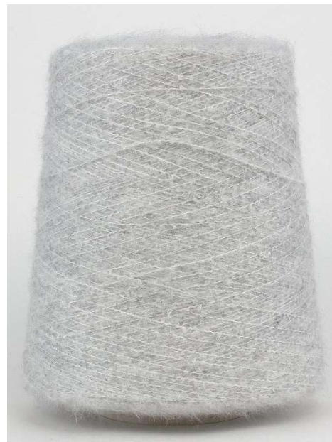
Farbe Perla Farbnummer. 1138