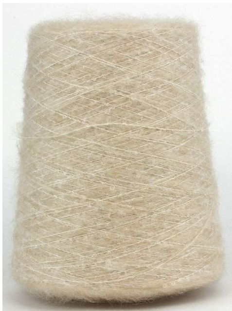
Farbe Macchiato Farbnummer. 1114