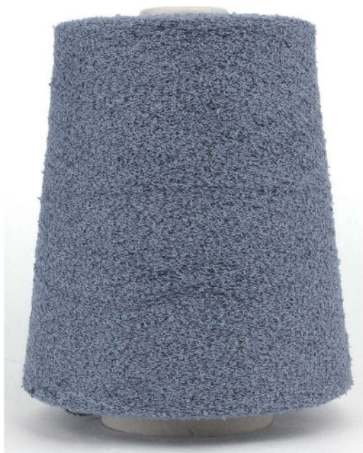
Farbe Smoke Farbnummer 4021