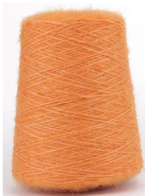
Farbe Girasole Farbnummer. 9VW