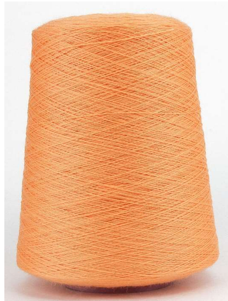
Farbe Arancio Farbnummer. 2YJ