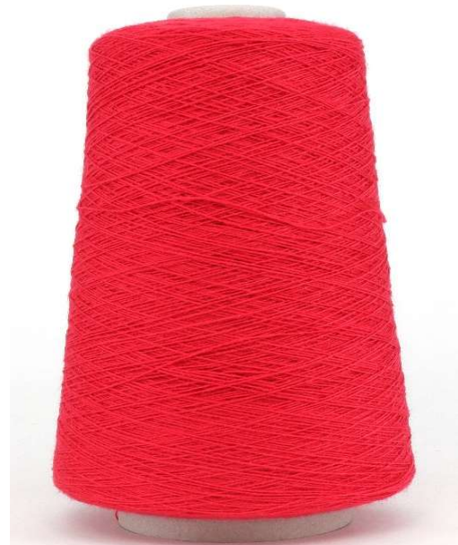
Farbe Rosso Farbnummer. CLK