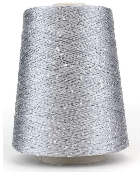
Farbe Silber Farbnummer. 014