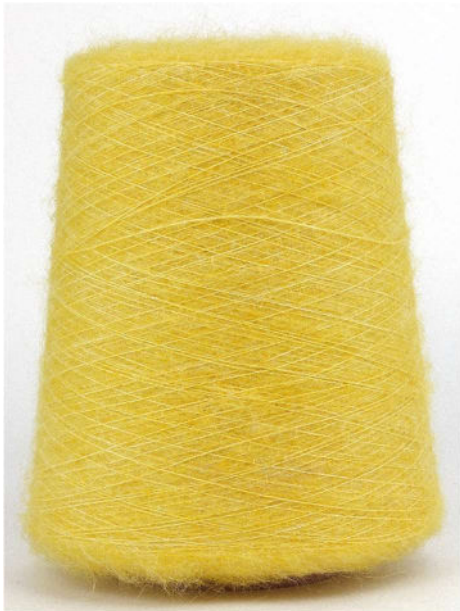
Farbe Limone Farbnummer. 1362