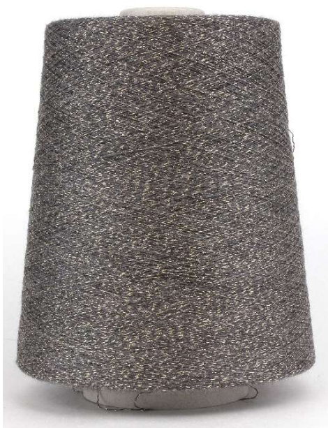
Farbe Topo (Gold Lurex) Farbnummer. WPS