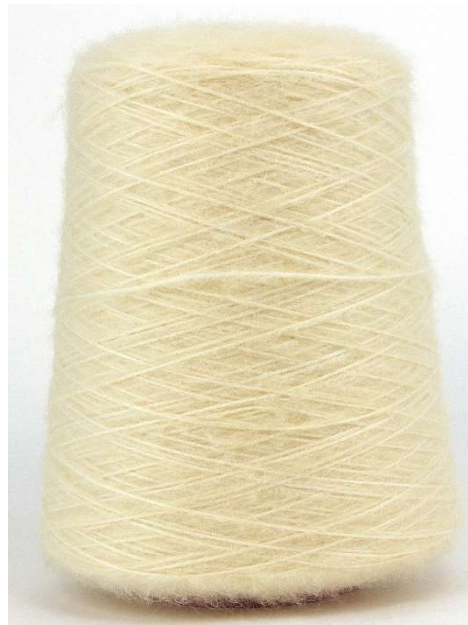
Farbe Sabbia Farbnummer. J6J