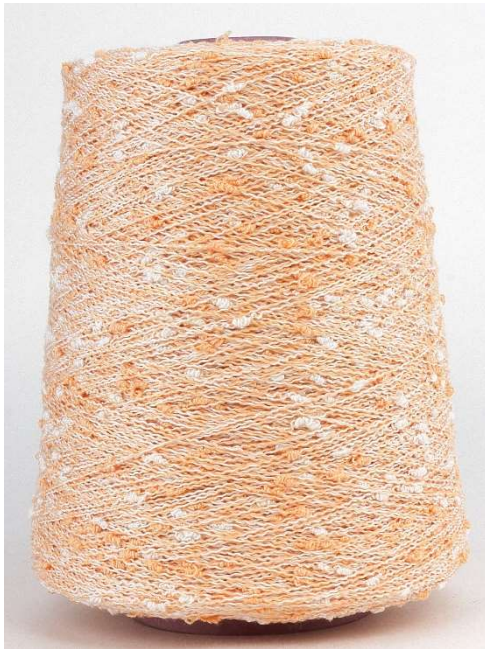
Farbe Chiarea Farbnummer. 8DN