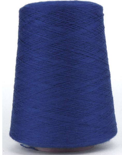
Farbe Royal Farbnummer. 3K3