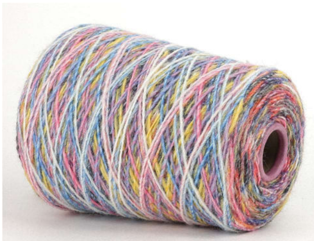
Farbe Colorato Farbnummer. 052420