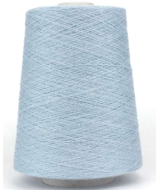
Farbe Sky Farbnummer. 1261