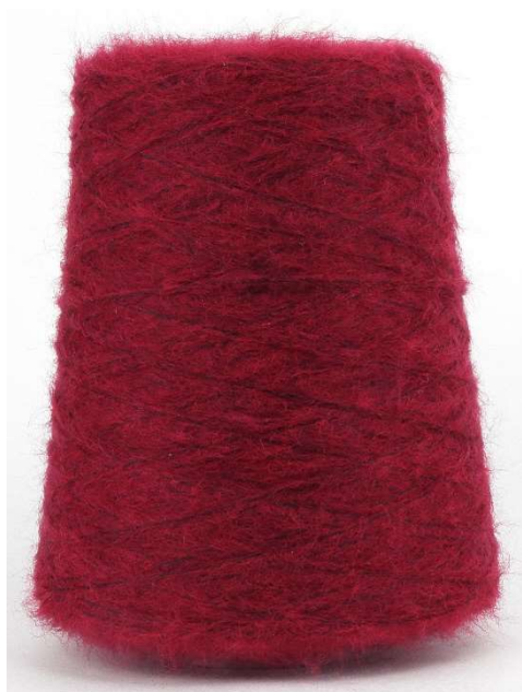
Farbe Amarena Farbnummer. 96J