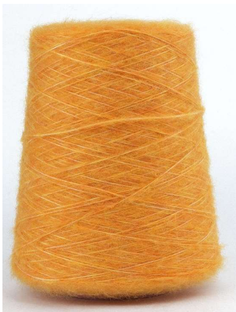
Farbe Frumento Farbnummer. 9QB