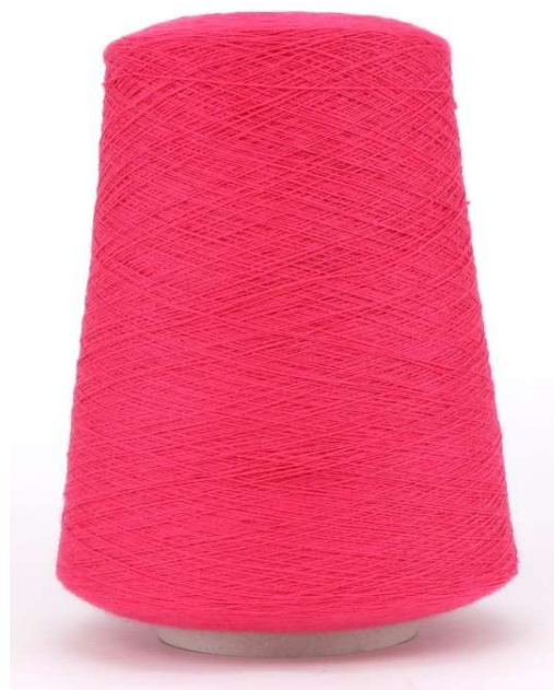
Farbe Ciclamino Farbnummer. G01