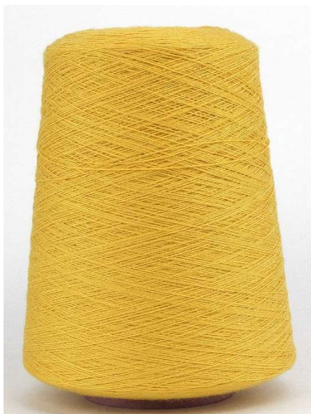
Farbe Mimosa Farbnummer. T2D