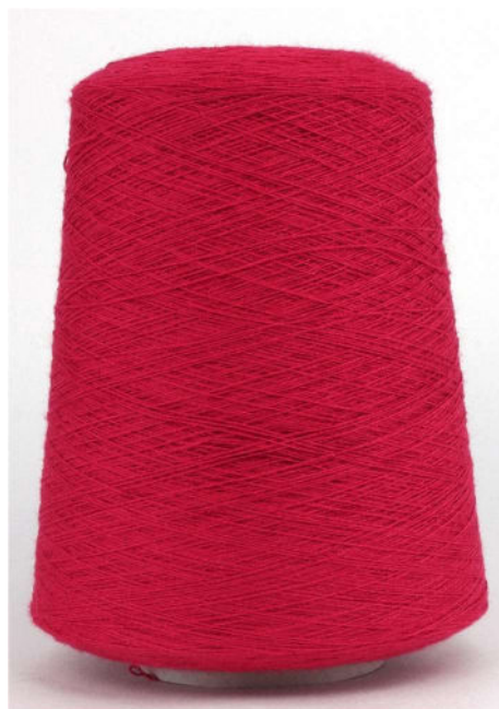
Farbe Rubin Farbnummer. HRB