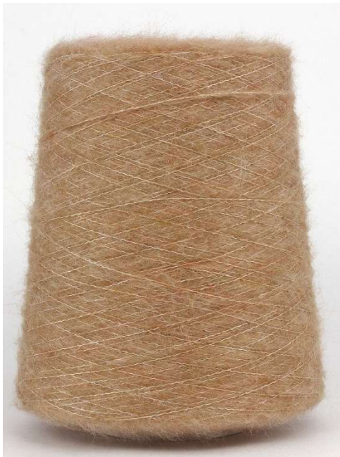
Farbe Camel Farbnummer. 419342