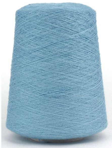
Farbe Blue Farbnummer. FXA