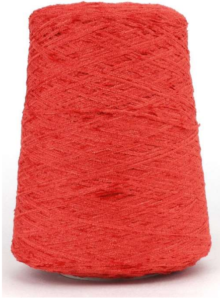
Farbe Brace Melange Farbnummer. YF8