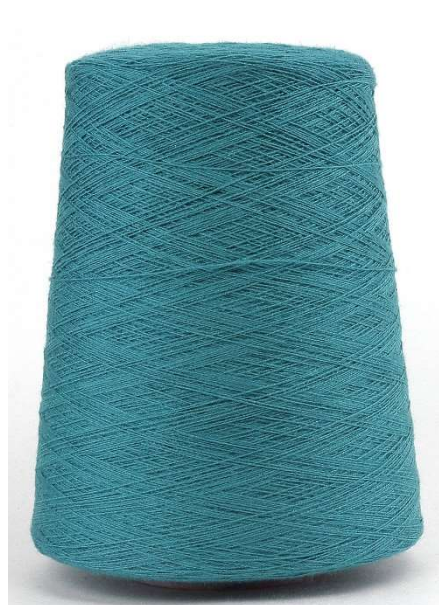
Farbe Petrol Farbnummer. 552