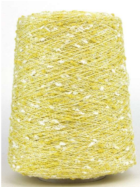
Farbe Cedro Farbnummer. VGL