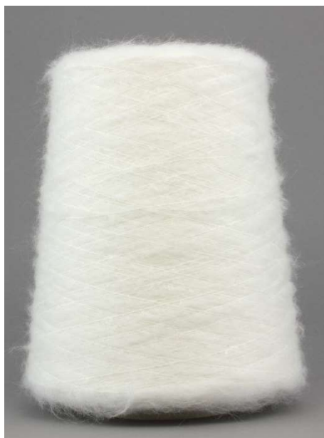
Farbe Bianco Farbnummer. 90791