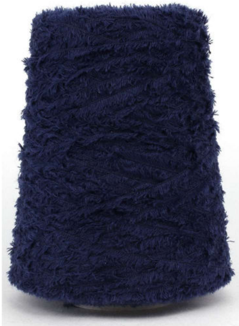
Farbe Blu Scuro Farbnummer. V8B