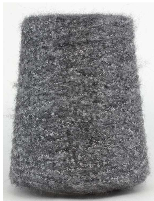
Farbe Anthracite Farbnummer. 2140