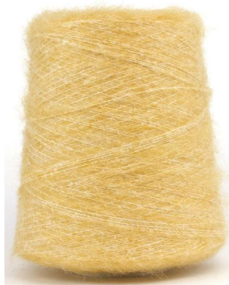
Farbe Giallino Farbnummer. 11017