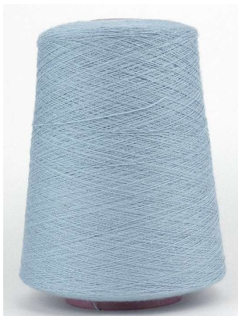
Farbe Arktis Farbnummer. KG6