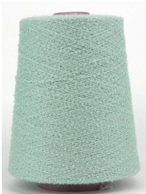
Farbe Mint Farbnummer. 409