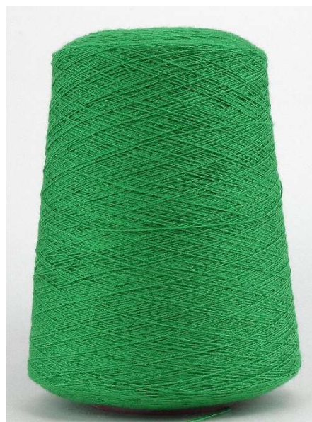
Farbe Prato Farbnummer. R74