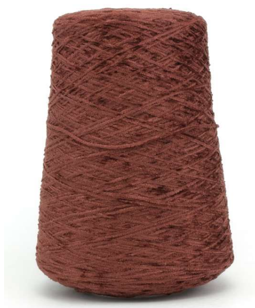
Farbe Castagna Farbnummer. P94