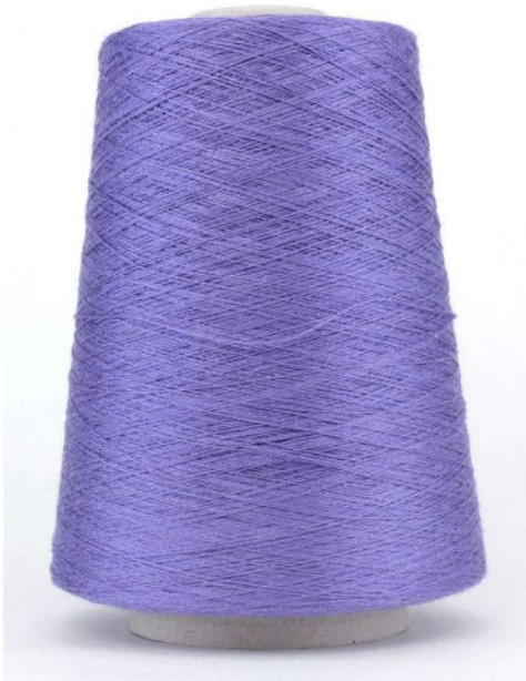
Farbe Mirtillo Mela Farbnummer. EIY