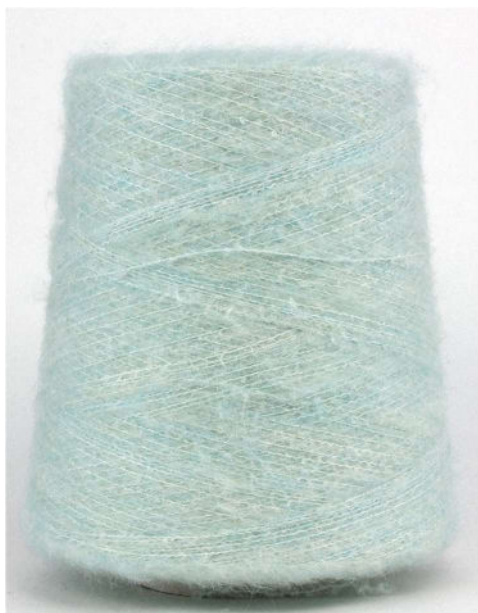
Farbe Lattementa Farbnummer. 90791