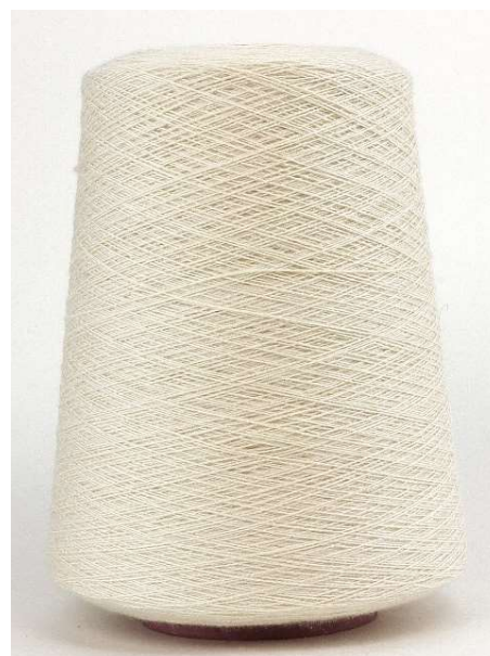
Farbe Sand Farbnummer. 0J5