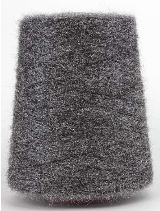
Farbe Grigio Farbnummer. 67