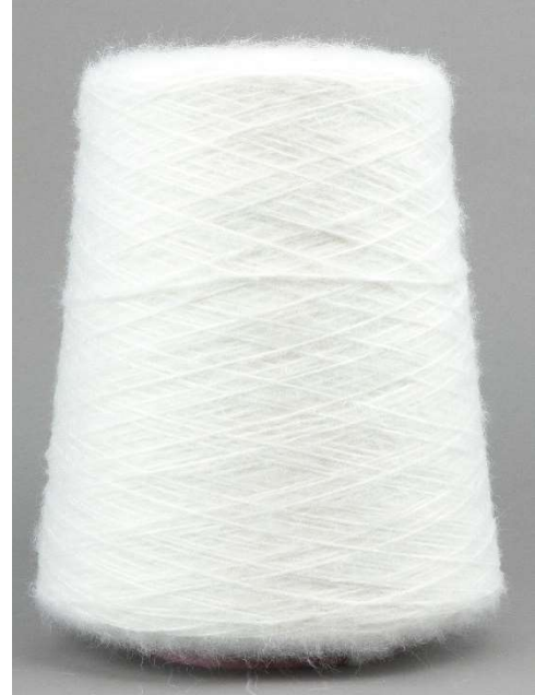
Farbe White Farbnummer. 007