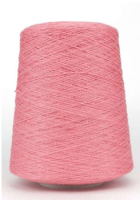
Farbe Rosa Farbnummer. BFI