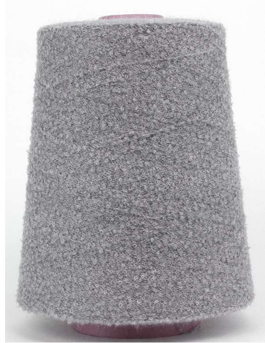
Farbe Flanell Farbnummer. 72629