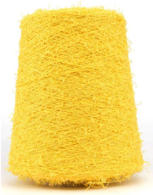
Farbe Yellow Farbnummer. 1F6