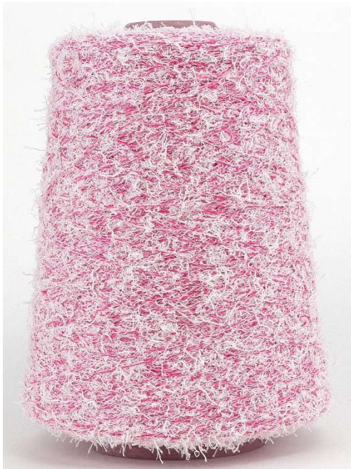
Farbe Magenta Farbnummer. ZGA