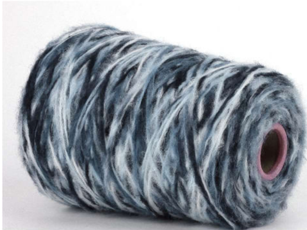
Farbe Tornado Farbnummer. 8BF