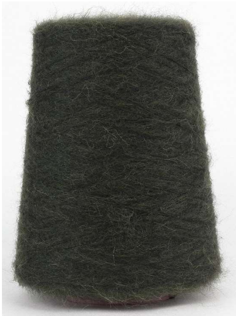
Farbe Militare Farbnummer. 2346