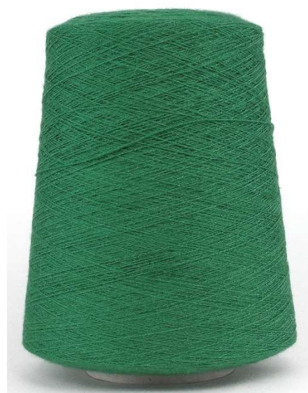
Farbe Green Farbnummer. P2M