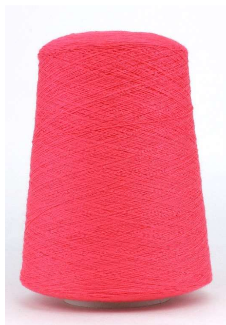
Farbe Koralle Farbnummer. ET4