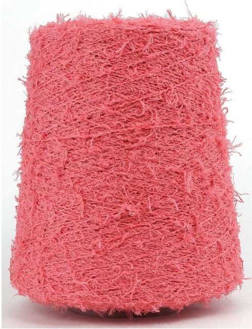
Farbe Corallo Farbnummer. 12011