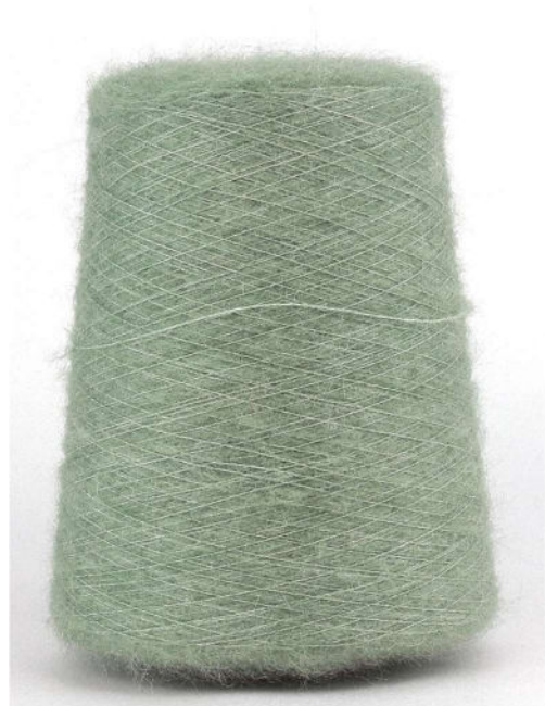
Farbe Salvia Farbnummer. 1364