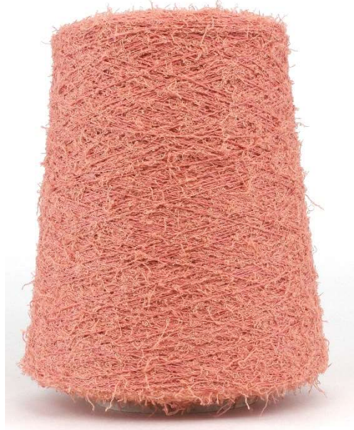
Farbe Powder Farbnummer. EA6