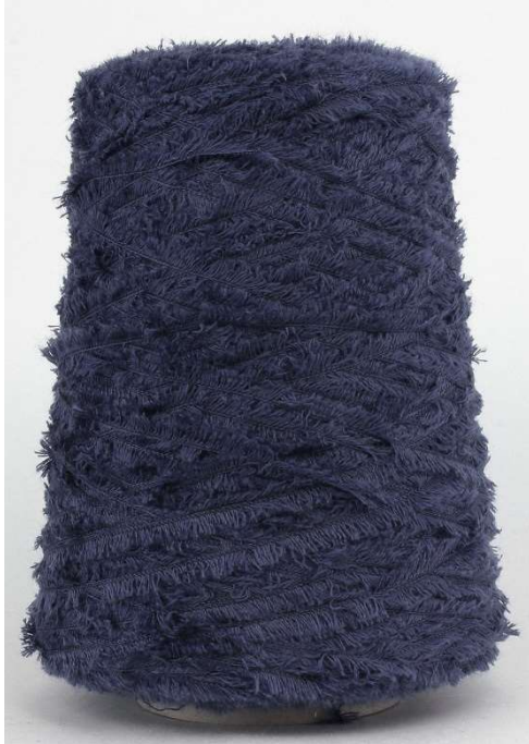
Farbe Indigo Farbnummer. VBG