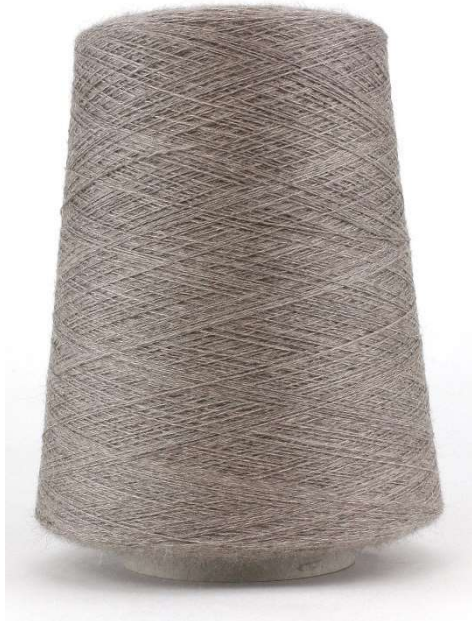
Farbe Nougat Farbnummer. RP9