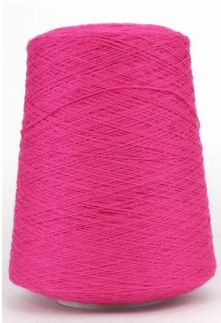
Farbe Fuxia Farbnummer. FXC