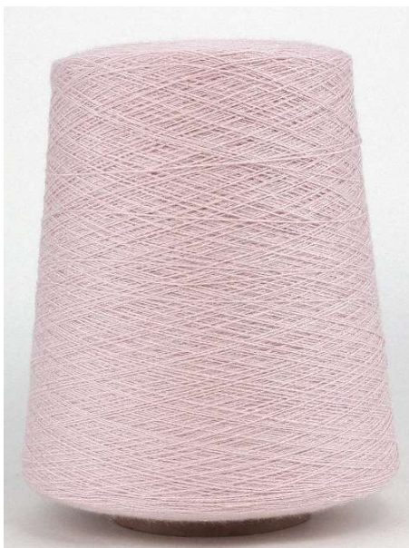
Farbe Rose Farbnummer. HL7