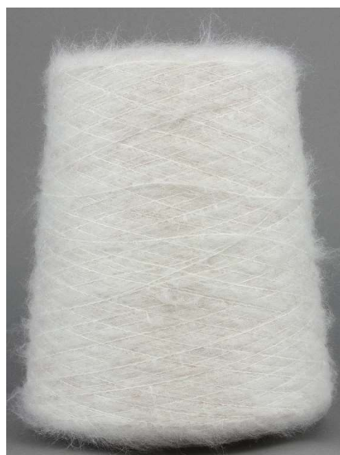
Farbe Perle Farbnummer. 111021