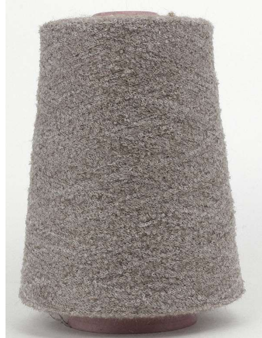
Farbe Taupe Farbnummer. 26131