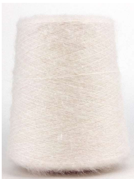
Farbe Avorio Farbnummer. 1218