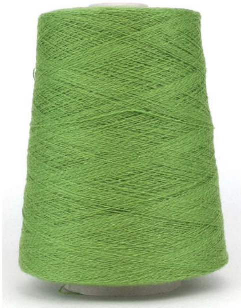
Farbe Fresh Apple Farbnummer. 2615