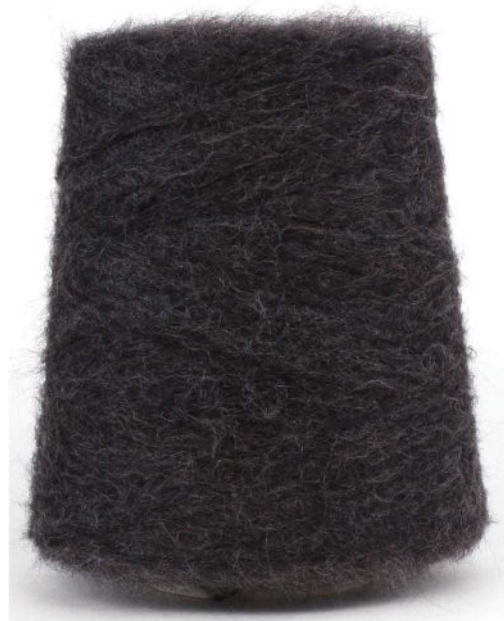
Farbe Cespuglio Farbnummer. 90771