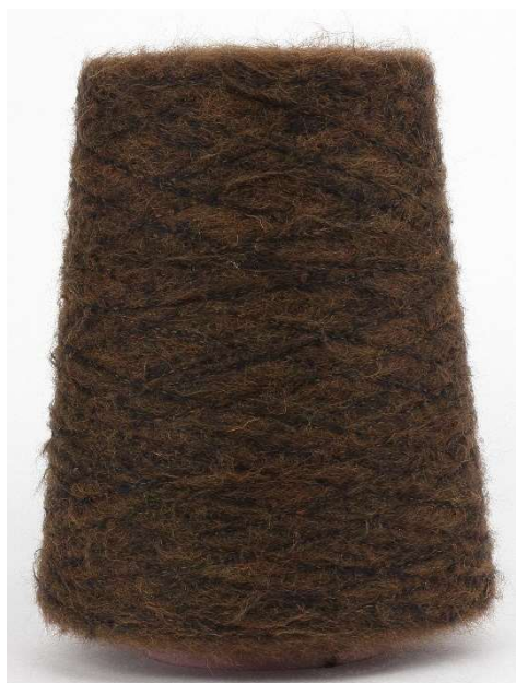
Farbe Calvados Farbnummer. 290425