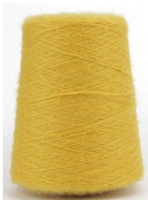
Farbe Senape Farbnummer STW