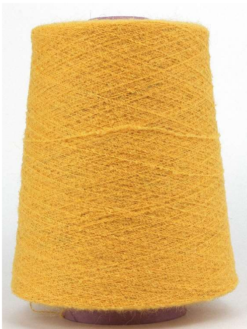
Farbe Curry Farbnummer. 26186