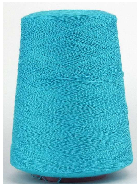
Farbe Türkis Farbnummer. 39E