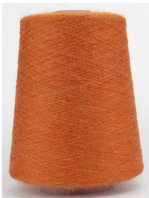
Farbe Aragosta Farbnummer: 1833