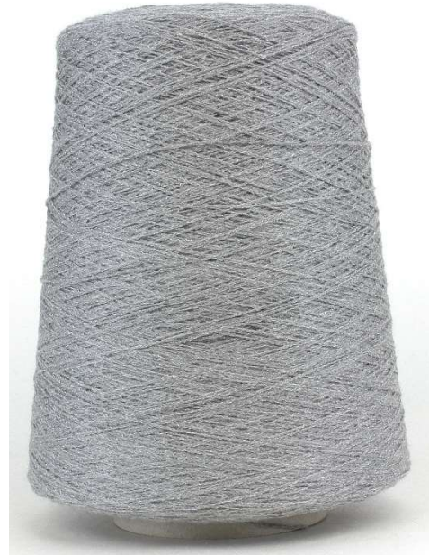
Farbe Asphalto Farbnummer. A32