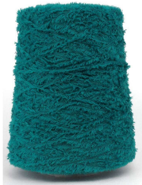
Farbe Petrol Farbnummer. VGA