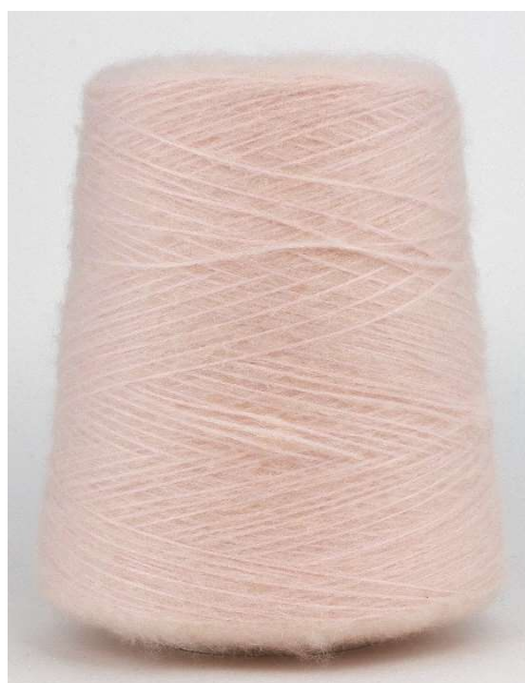
Farbe Rosenquarz Farbnummer. LRA