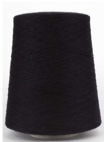
Farbe Nero Farbnummer. 89200

Alle obigen Preisangaben sind Netto ohne USt. – Ihr Rabatt ist bereits abgezogen Katalog August 2024