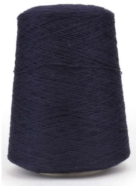
Farbe Dark Blue Farbnummer. NAB