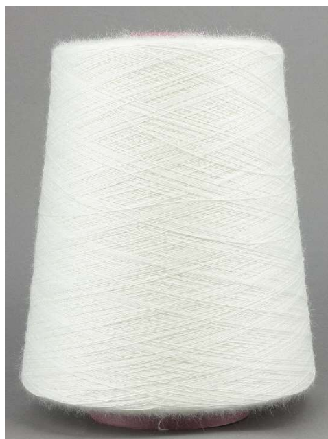
Farbe Nature Farbnummer: 100