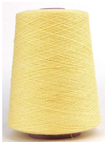
Farbe Sunshine Farbnummer. 7IT