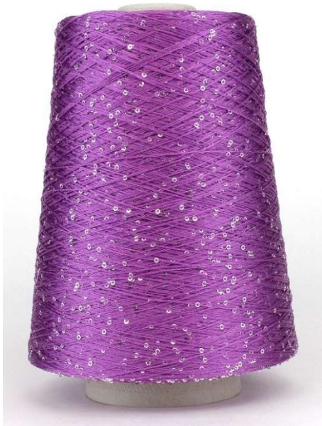
Farbe Violetto Farbnummer. 7610