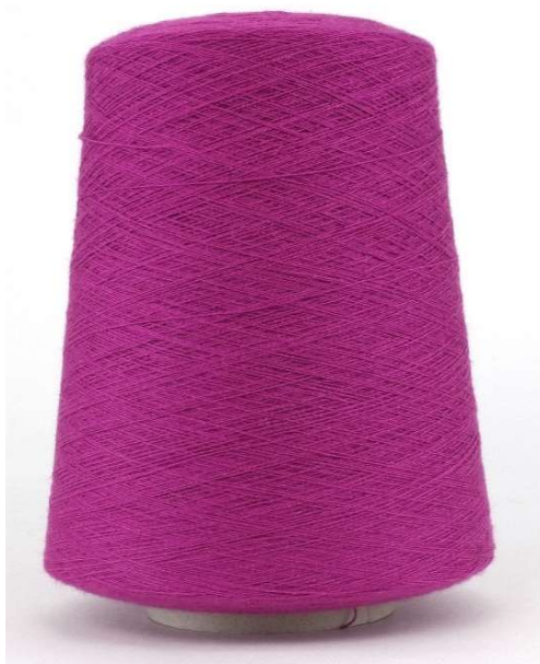
Farbe Carminio Farbnummer. AMT