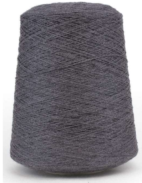
Farbe Granit Melange Farbnummer. BWJ