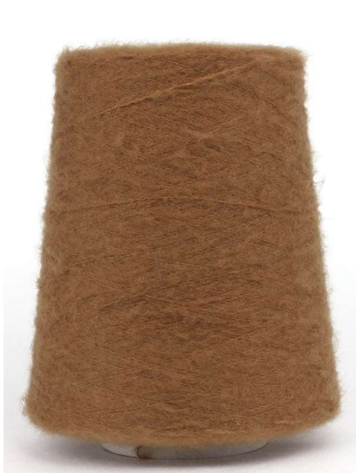
Farbe Calvados Farbnummer. CRS