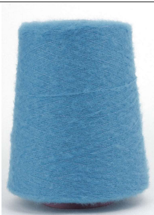
Farbe Gletscher Farbnummer. 6ZH