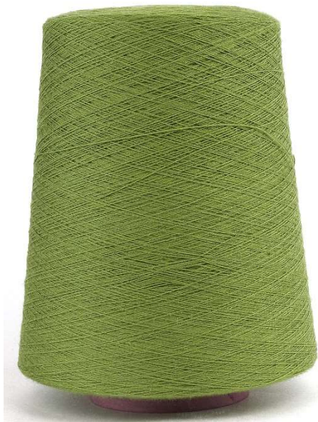
Farbe Foglia. Farbnummer. 7G2