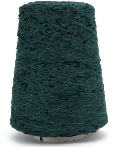
Farbe Pino Farbnummer. CN3