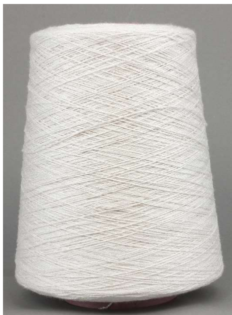
Farbe Perle Farbnummer. BK4