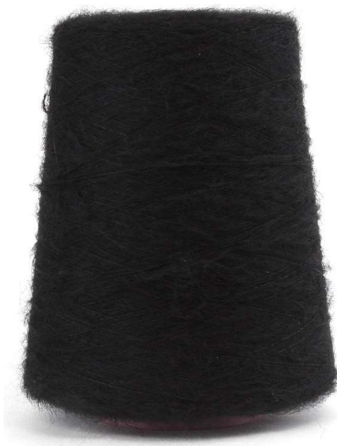
Farbe: Nero Farbnummer 099