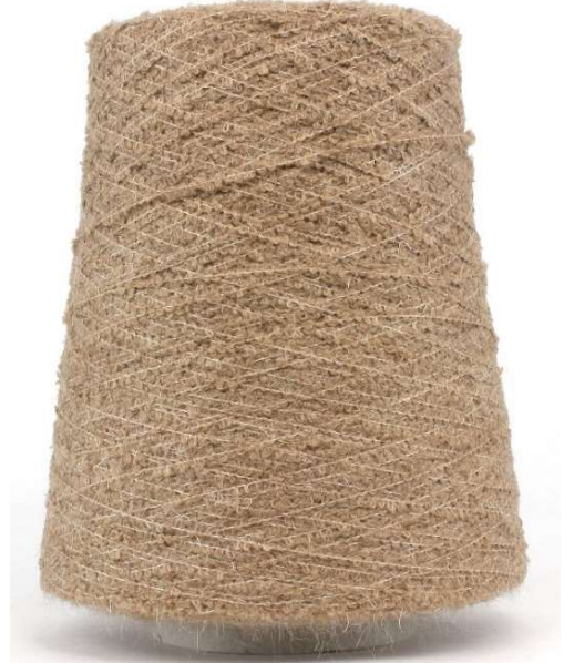
Farbe Oakwood Farbnummer. 2315