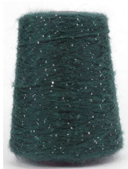
Farbe Foresta Farbnummer. 8545