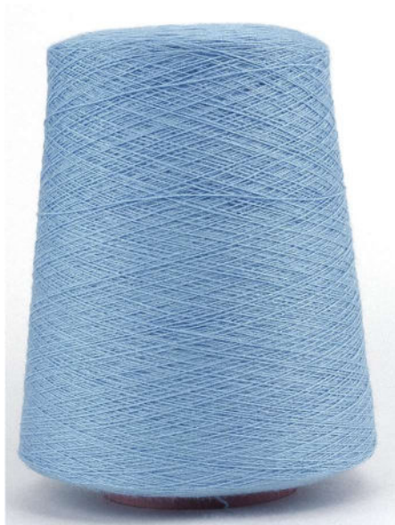
Farbe Eisblau Farbnummer. 74H