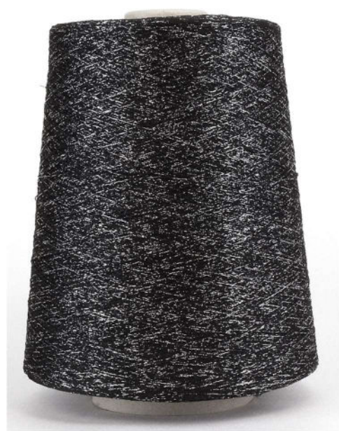
Farbe:Schwarz Silber Farbnummer: 1305