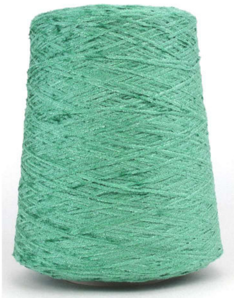
Farbe Mistel Farbnummer. CP3