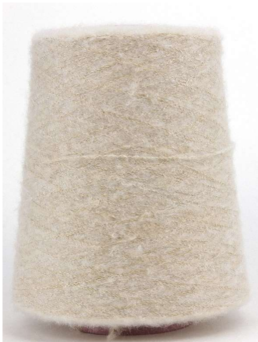
Farbe Xilene Farbnummer. W36