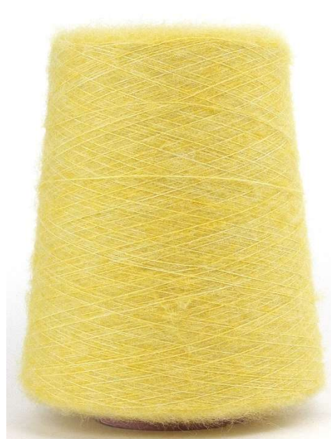
Farbe Yellow Farbnummer. 500858