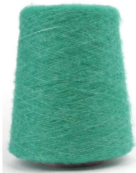
Farbe Smaragd Farbnummer. 85Q