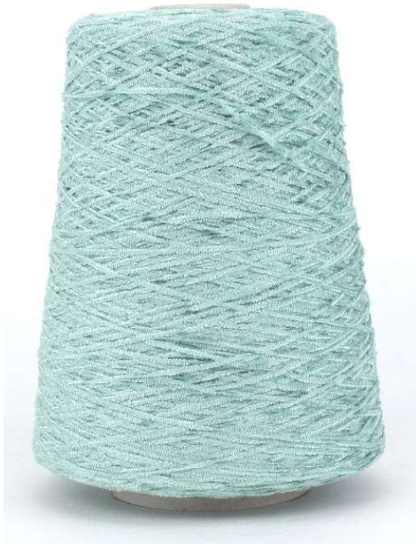
Farbe Misty Green Farbnummer. BW4