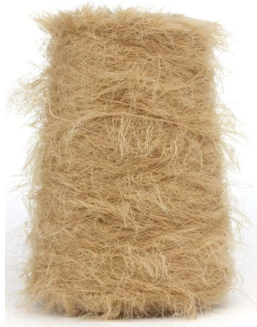
Farbe Camel Farbnummer. YUF