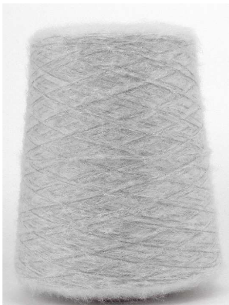
Farbe Piccione Farbnummer. 9S6L