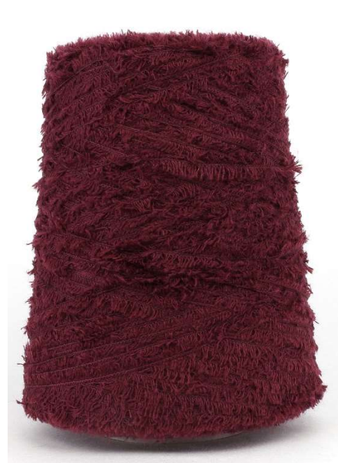
Farbe Bordeaux Farbnummer. V86