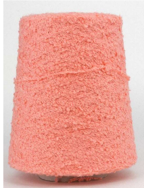
Farbe Lachs Farbnummer. 20946