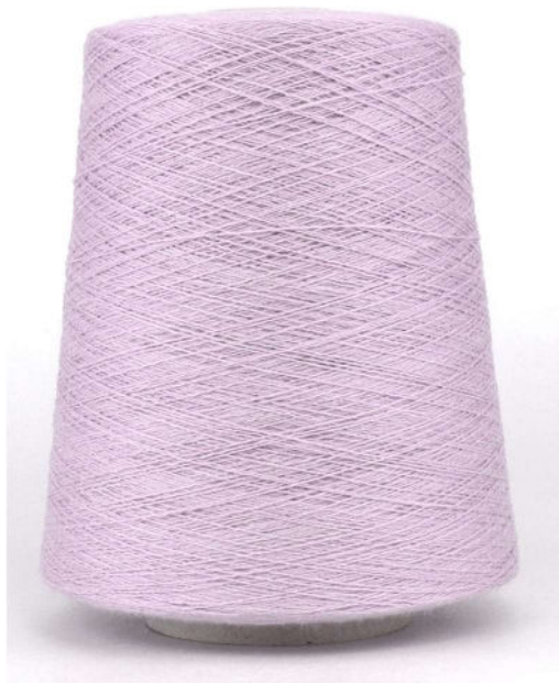
Farbe Flieder Farbnummer. 1862