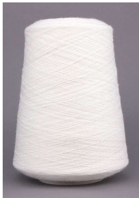
Farbe Bianco Farbnummer. CVS