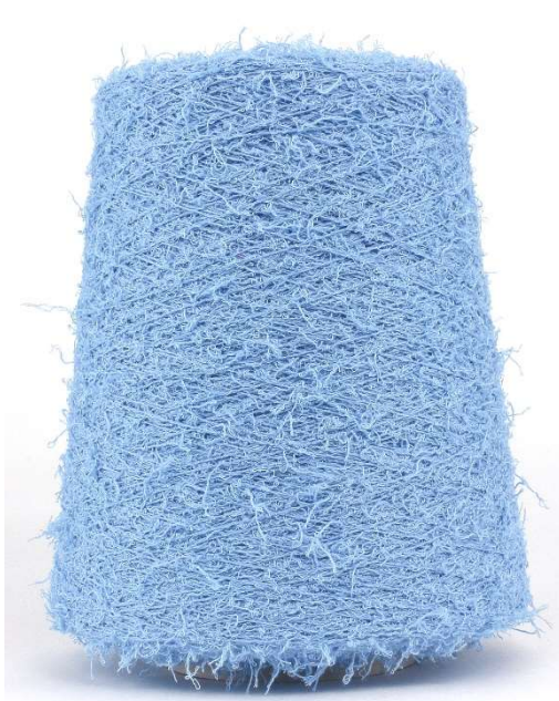
Farbe Azzurro Farbnummer. I71