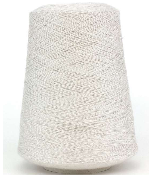
Farbe Argento Farbnummer. G9B