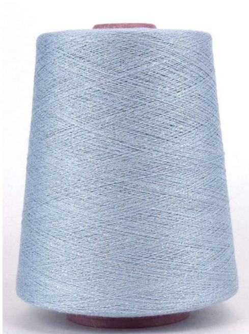
Farbe Celeste Farbnummer. WEC