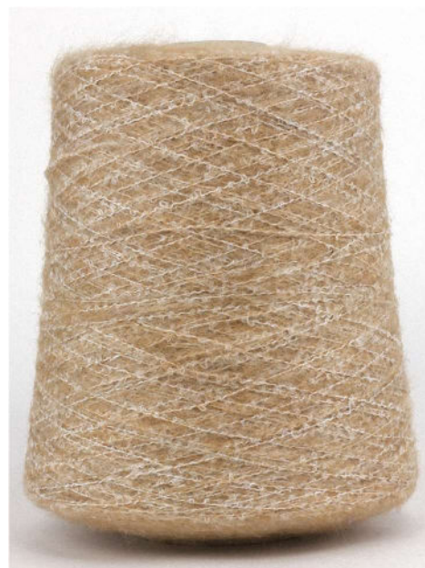
Farbe Cammello Farbnummer. 190462