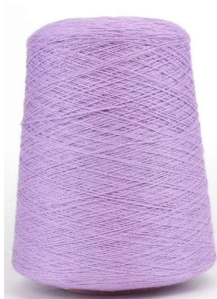
Farbe Purple Farbnummer. L2W