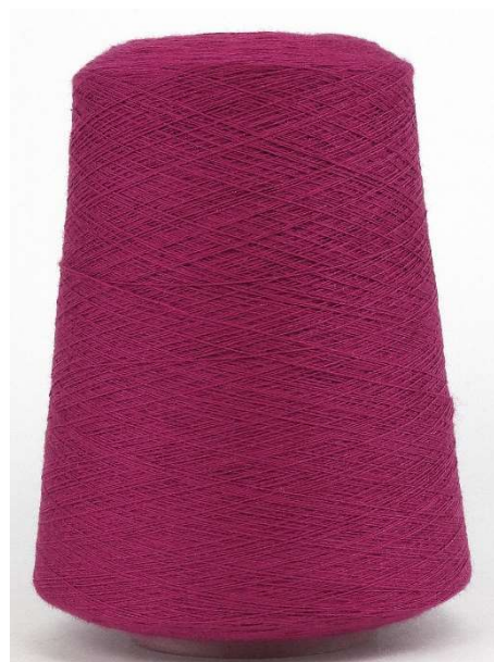
Farbe Fuchsia Farbnummer. RPU