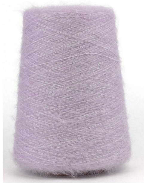
Farbe Lilac Farbnummer. 1358