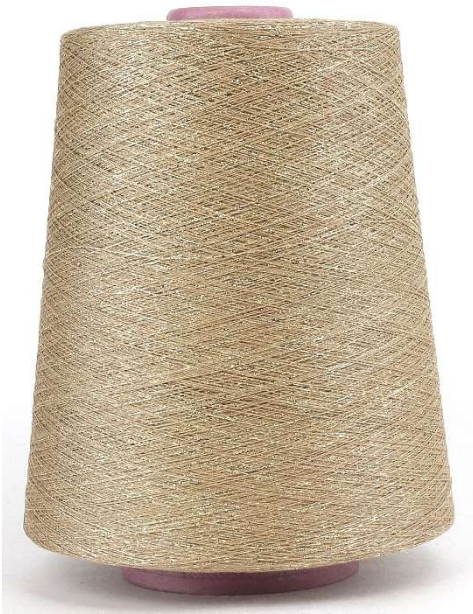
Farbe:Beige Gold Farbnummer: 1340