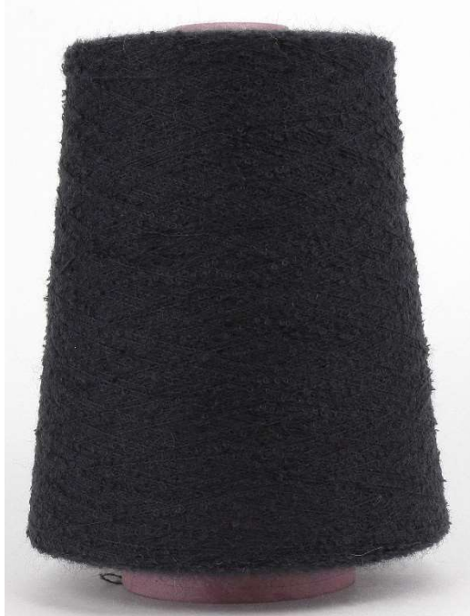
Farbe Schwarz Farbnummer. 762033