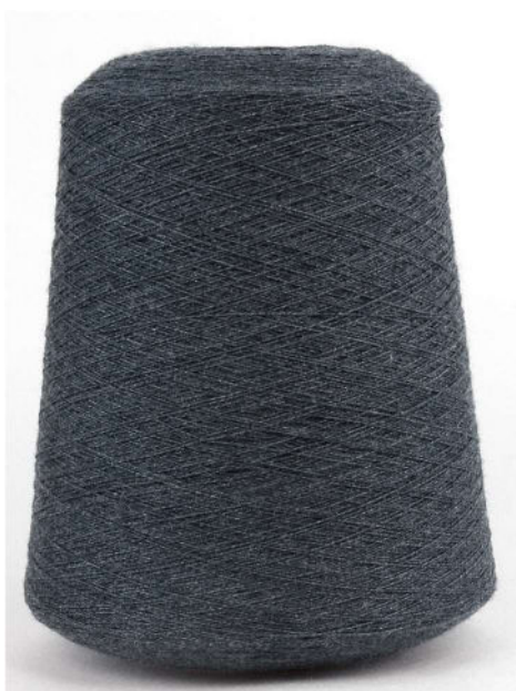
Farbe Nero Melange Farbnummer. W3T