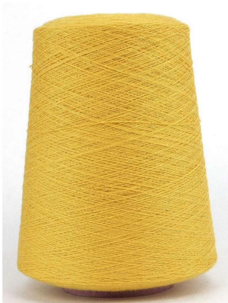
Farbe Ananas. Farbnummer. AWD