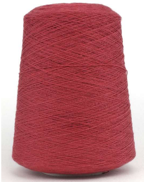
Farbe Rust Farbnummer. 3BQ