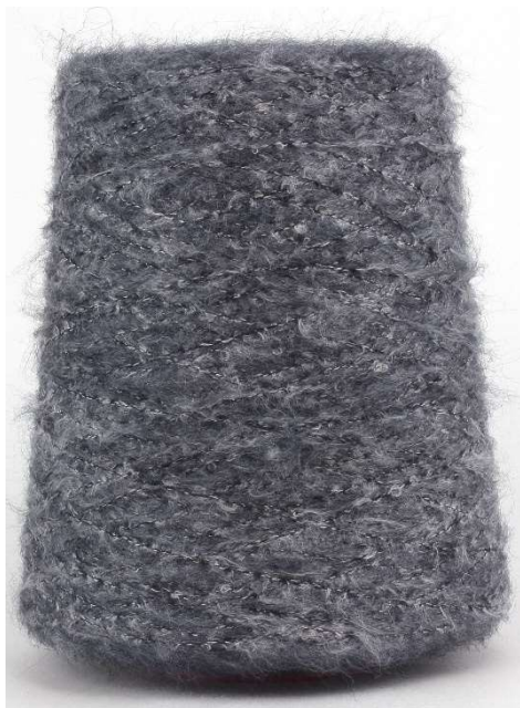
Farbe Notte Farbnummer. 2137