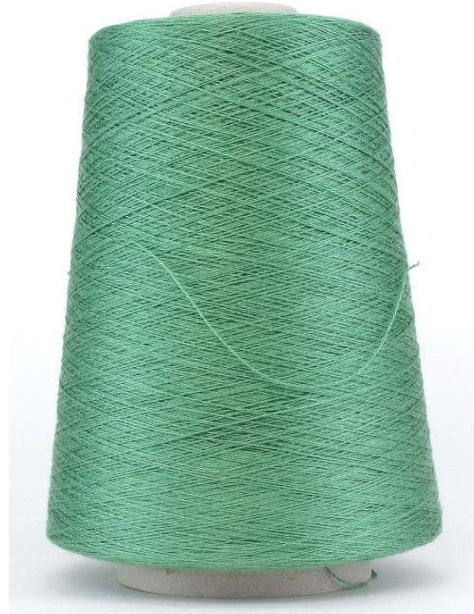
Farbe Militare Mela Farbnummer. EIQ