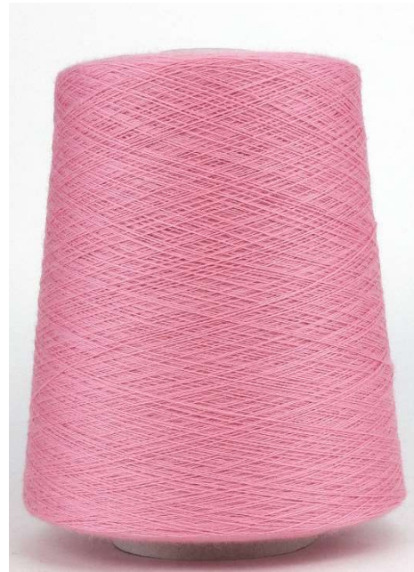
Farbe Rosa Farbnummer. 028348