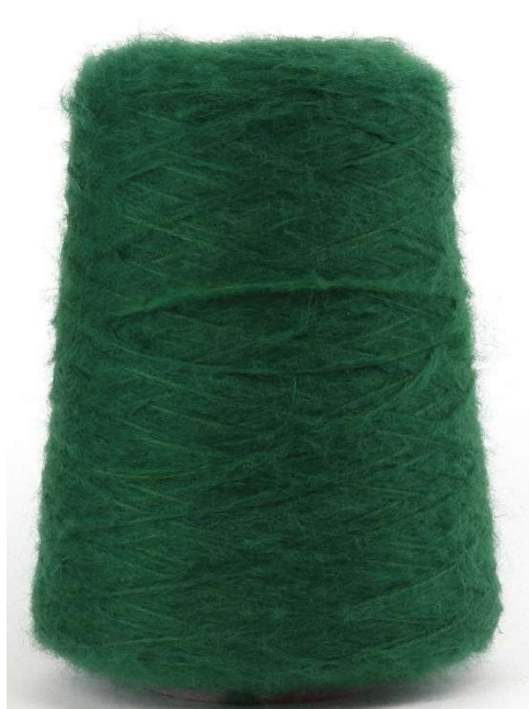
Farbe Loden Farbnummer 9S2