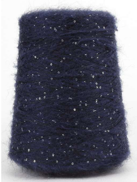
Farbe Night Farbnummer. 8546