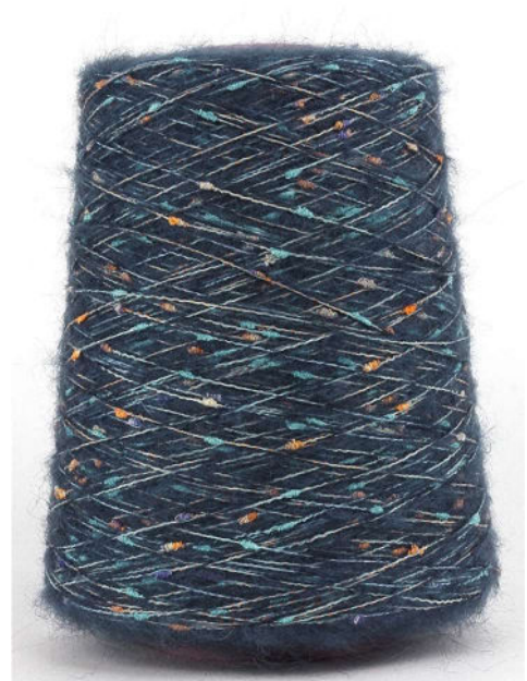
Farbe Blu Farbnummer. 6073