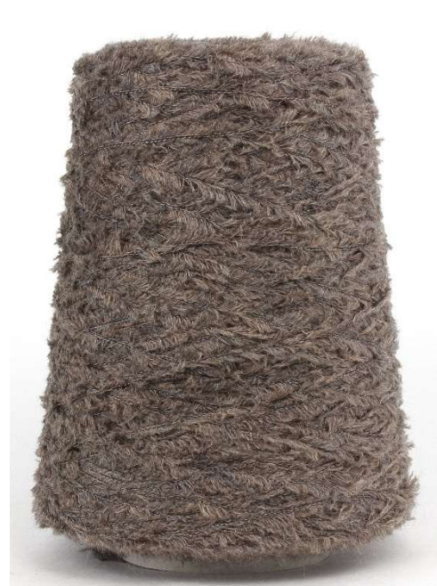
Farbe Topo Farbnummer. 8OP