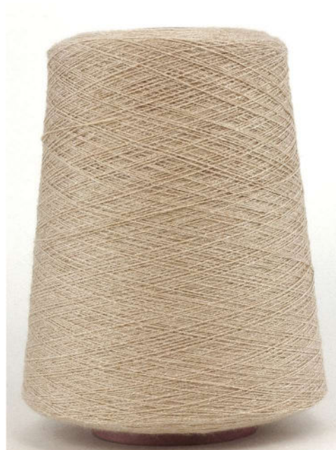
Farbe Mandel Farbnummer QX7