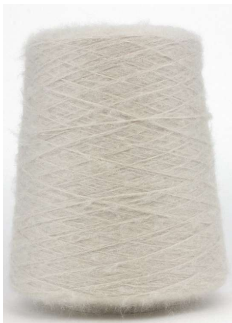
Gabbiano Farbnummer. 9PT