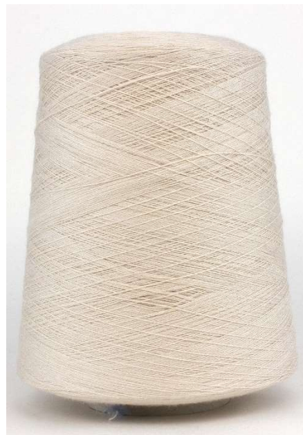
Farbe Cashew Farbnummer. DSZ