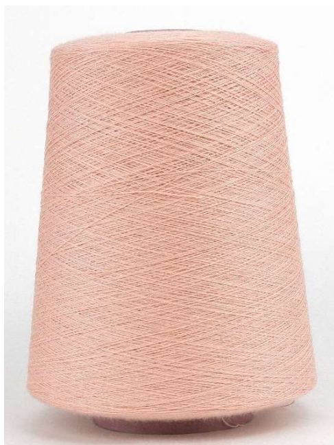
Farbe Salmone. Farbnummer. G956