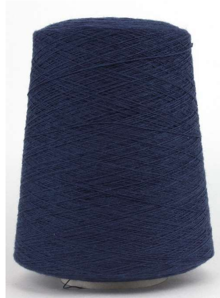
Farbe Fiele Farbnummer. 198