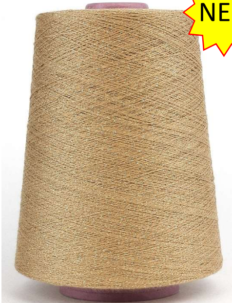
Farbe Lepre Farbnummer. VX8