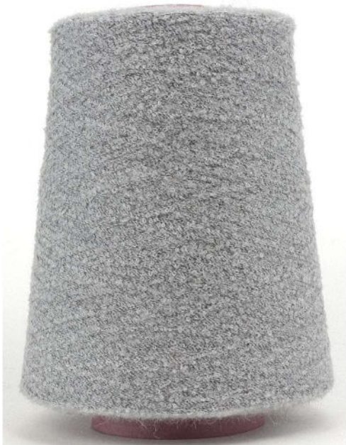
Farbe Grigio Farbnummer. 26104