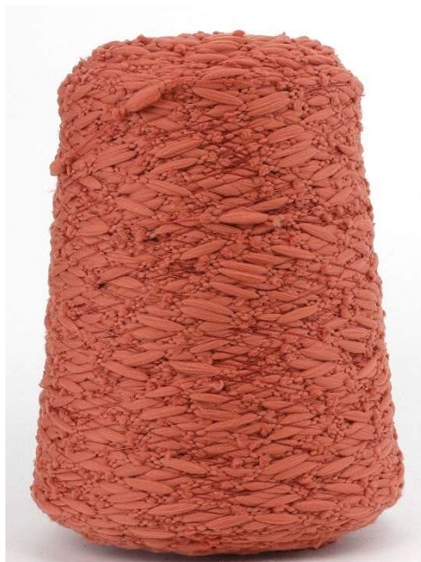
Farbe Terracotta Farbnummer. 3923