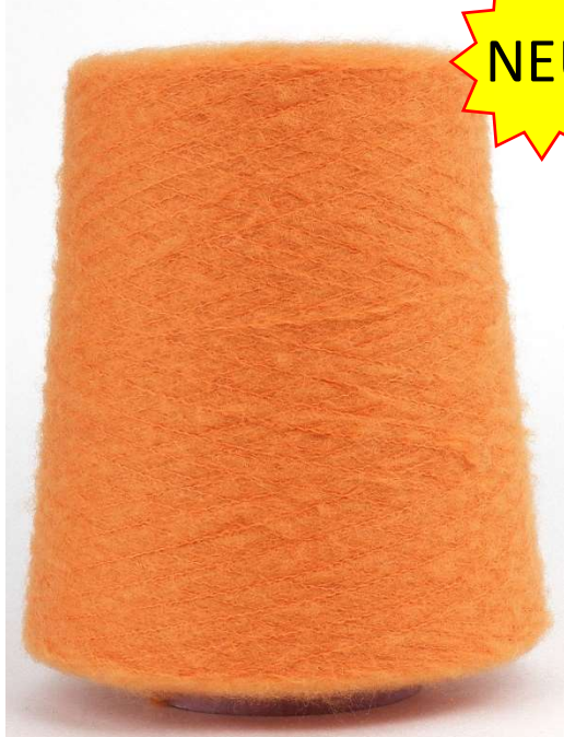
Farbe New Orange Farbnummer. 9UN