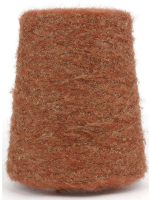
Farbe Cognac Farbnummer. 42339