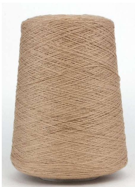
Farbe Karamel Farbnummer. Q91