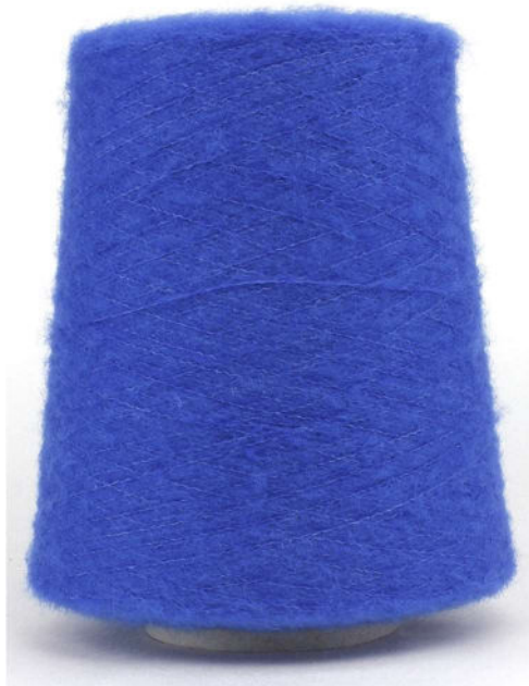
Farbe Blue Farbnummer. 6OY