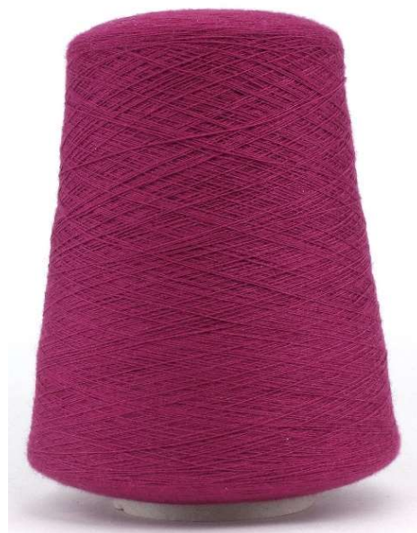
Farbe Fuchsia Farbnummer. RPU