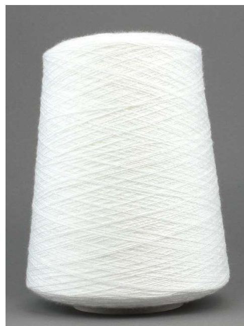
Farbe Bianco Farbnummer. 001