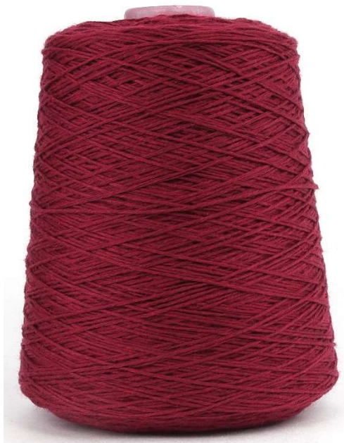
Farbe Cabernet Farbnummer: 928