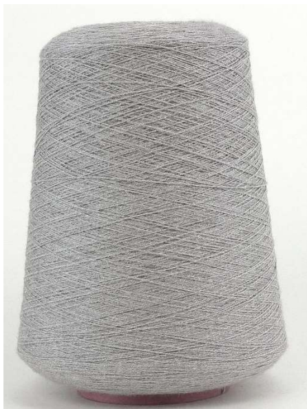
Farbe Grigio Melange Farbnummer. W0T