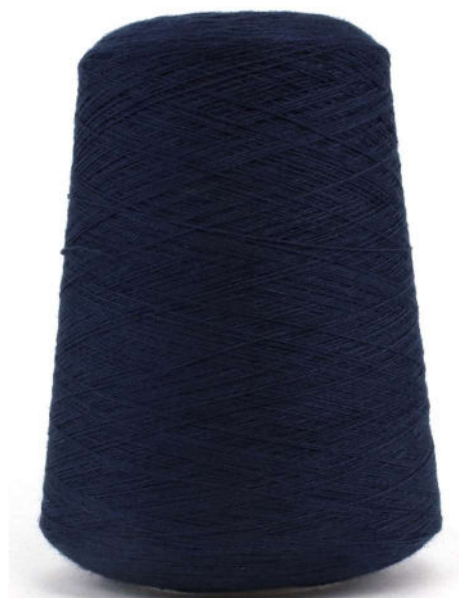
Farbe Marine Farbnummer. LPE