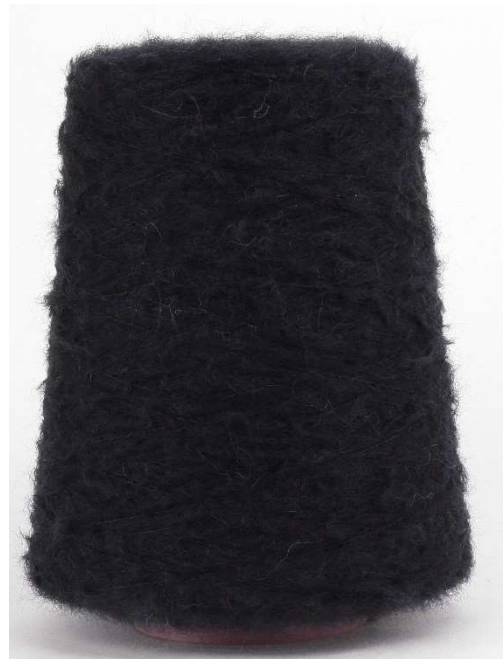
Farbe Nero Farbnummer. 200