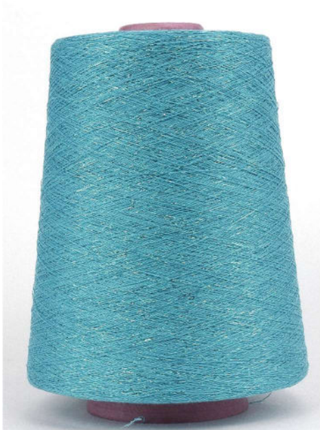
Farbe Türkis Farbnummer: 68872