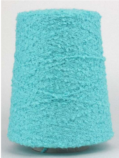
Farbe Türkis Farbnummer. 20955