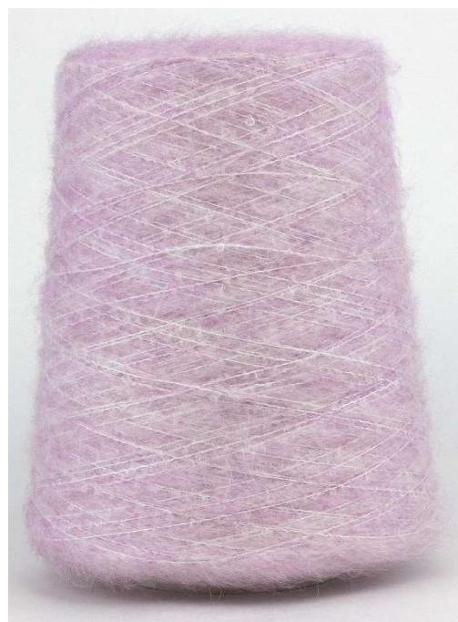
Farbe Lilla Farbnummer. 1131