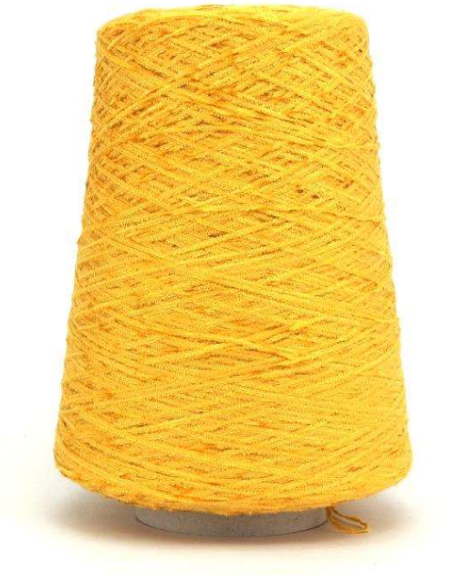
Farbe Polenta Farbnummer. DGP