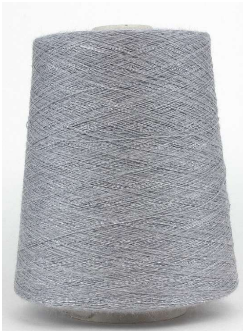
Farbe Grigio Farbnummer. 420266