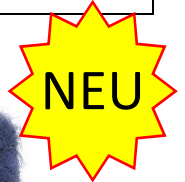
Farbe Royal Farbnummer. 22513