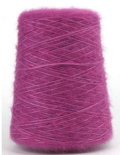
Farbe Begonia Farbnummer. 9VQ