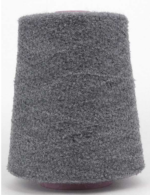
Farbe Granit Farbnummer. 26145