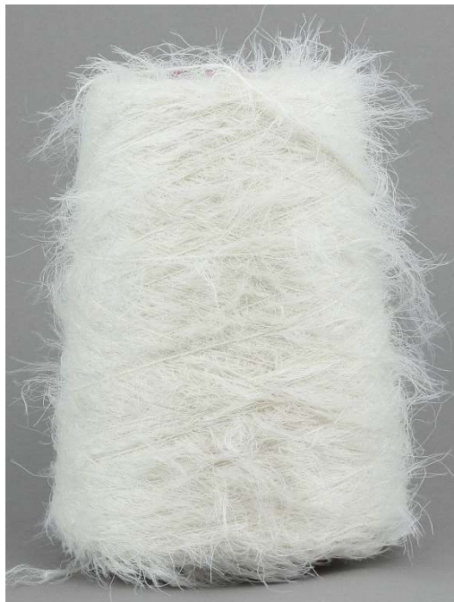
Farbe Angora Farbnummer. 020