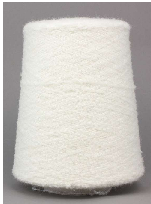
Farbe Crema Farbnummer. 26149