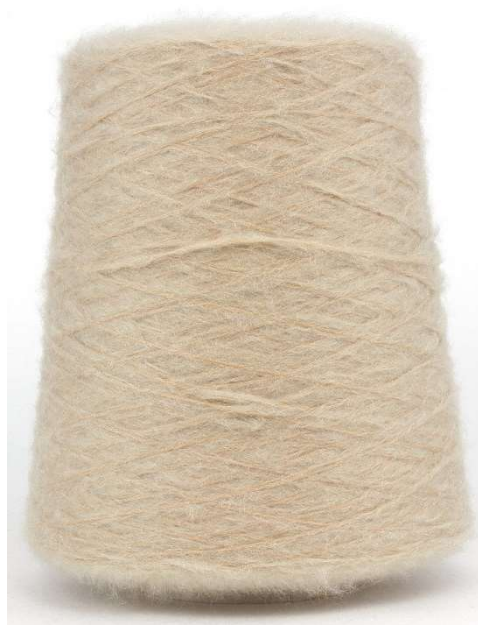
Farbe Beige Farbnummer. EEU