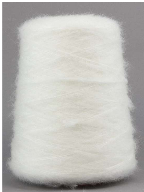
Farbe Snow Farbnummer. 94Y