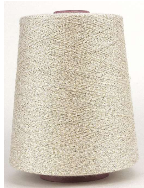
Farbe Ecrú Farbnummer. VX2