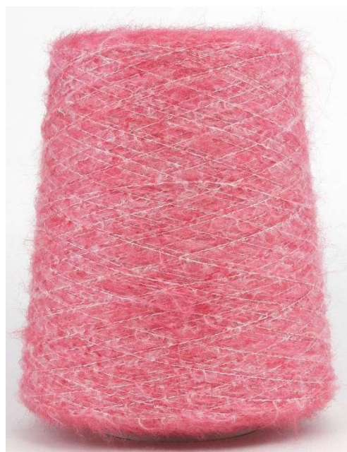
Farbe Dark Corall Farbnummer. 90512