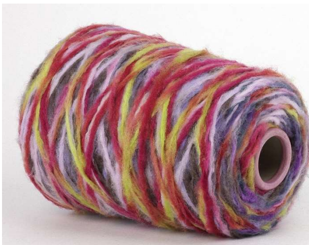
Farbe: Vina-Ottanio Multicolor Farbnummer. 8B9