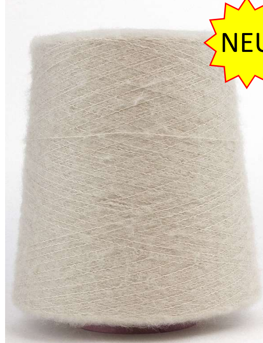
Farbe Kitt Farbnummer. 9PT