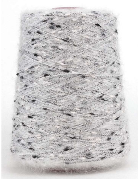
Farbe Pepper & Salt Farbnummer. 6047