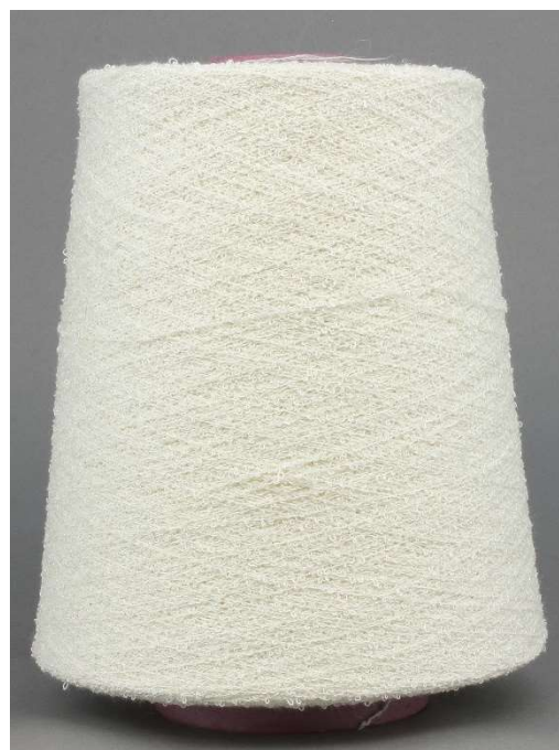
Farbe Crema Farbnummer 4000