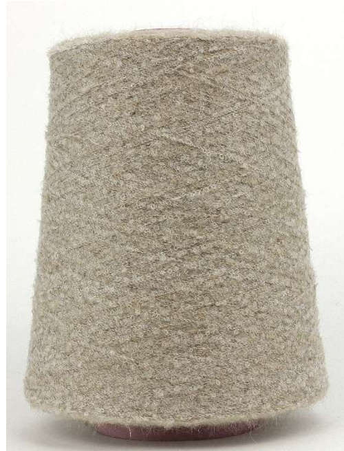
Farbe Perlmutter Farbnummer. 26130