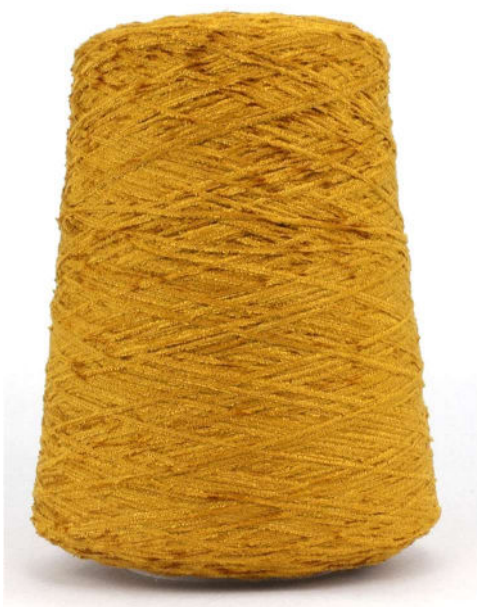
Farbe Tobacco Farbnummer. YG3