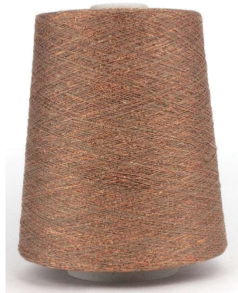
Farbe Cupro Farbnummer. 63689