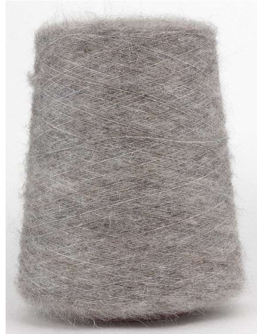
Farbe Talpa Farbnummer. 1360