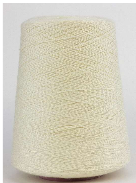
Farbe Vanille Farbnummer. 3MU