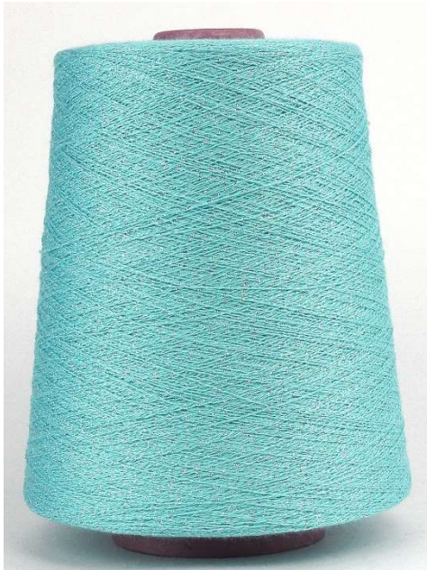
Farbe Cielo Farbnummer. 8EK