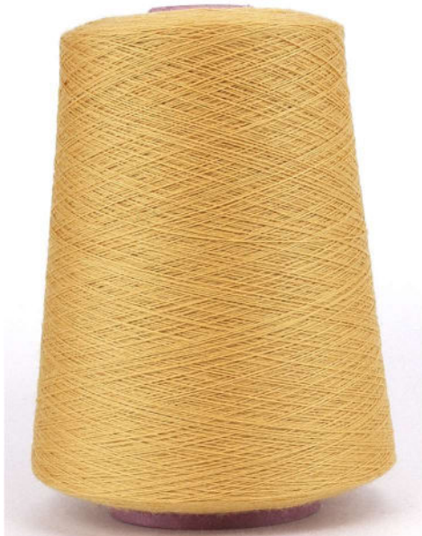
Farbe Senape Farbnummer. DJ7