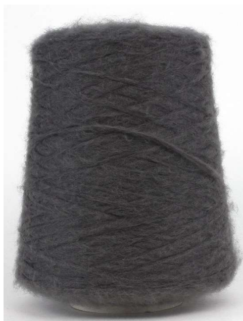
Farbe Dark Taupe Farbnummer. A1H