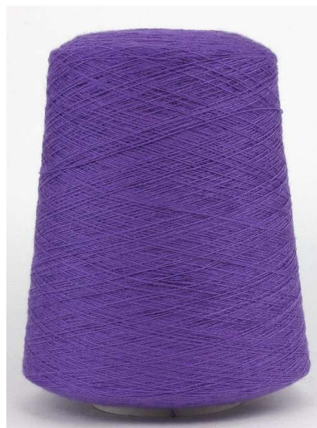
Farbe Violett Farbnummer. LZL