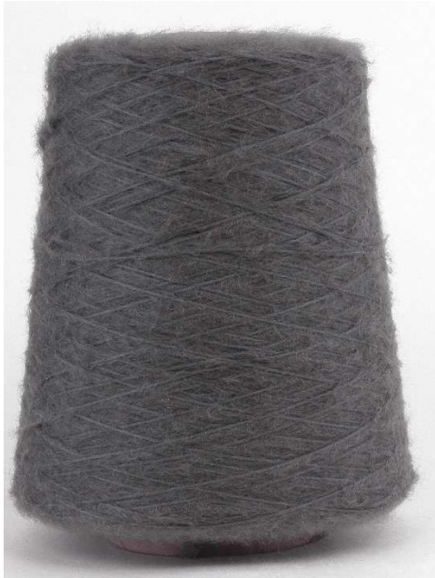
Farbe Topo Melange Farbnummer. 9PY