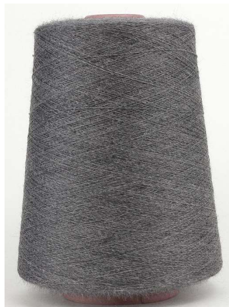
Farbe Dark Grey Farbnummer: 1245