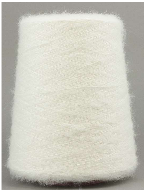
Farbe Bianco Farbnummer. 901