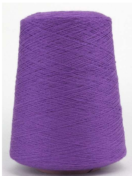
Farbe Viola Farbnummer. 3C3