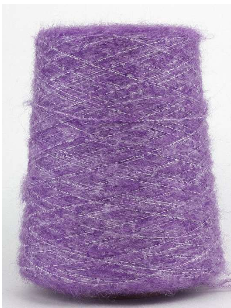
Farbe Viola Farbnummer. 1228