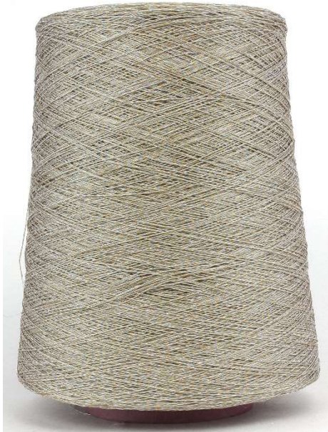
Farbe Naturale Farbnummer. 203