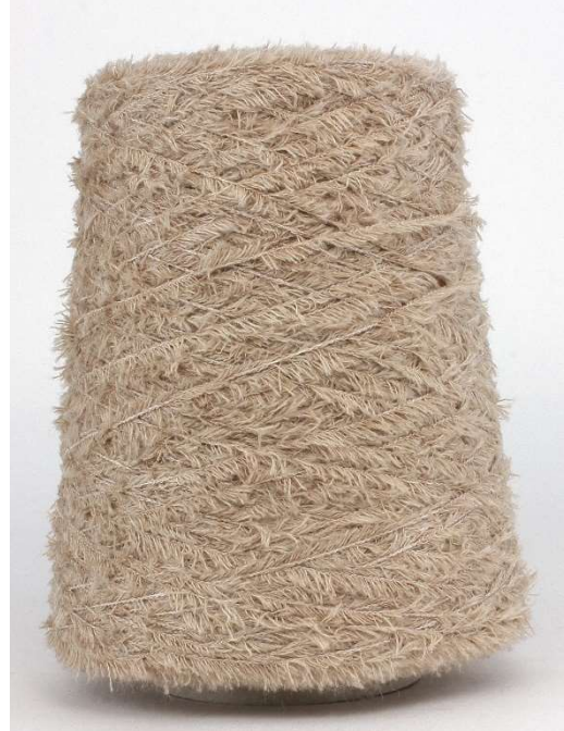
Farbe Spunga Farbnummer. 80N