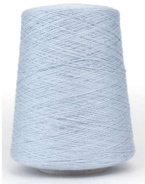
Farbe Medusa Farbnummer. MQI