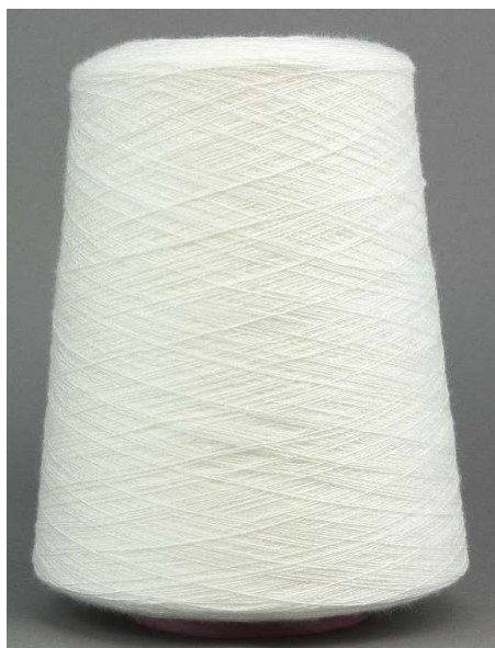
Farbe Juta Farbnummer. 007