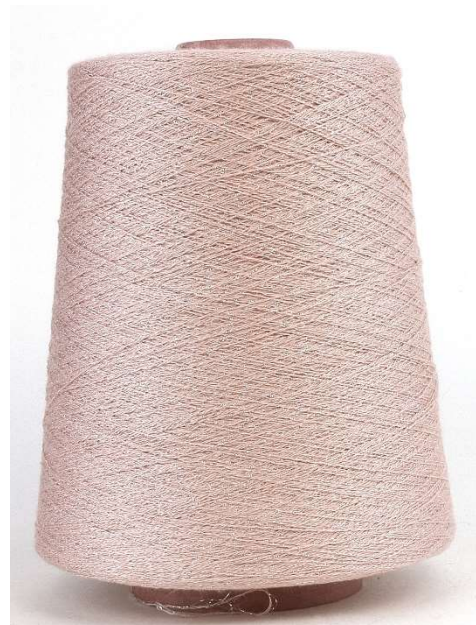
Farbe Labra Farbnummer. 912