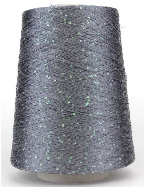
Farbe Graphit (grüne Pailletten) Farbnummer. EE010