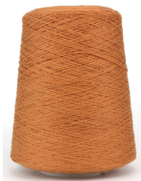
Farbe Brandy Farbnummer. NBB