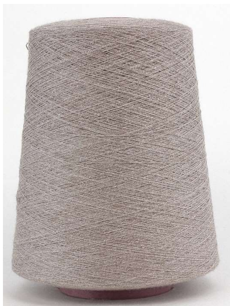
Farbe Cashew Mel. Farbnummer. QY6