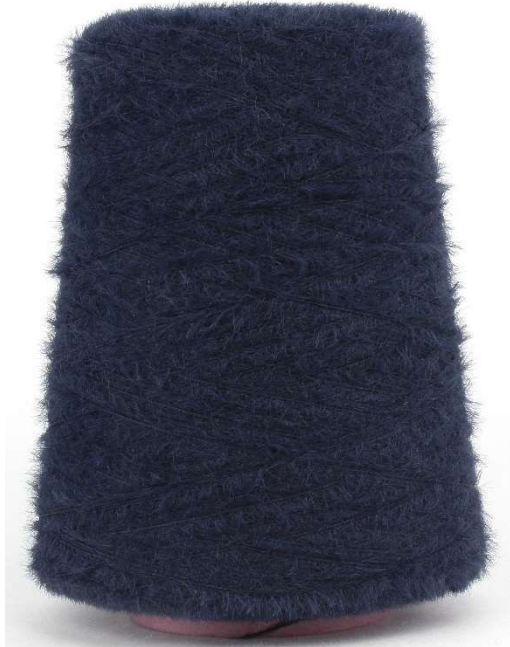
Farbe Navy Farbnummer. 846