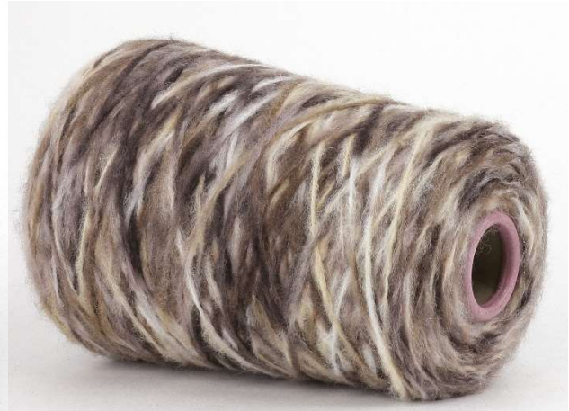
Farbe Cinghiale Farbnummer. 8BH