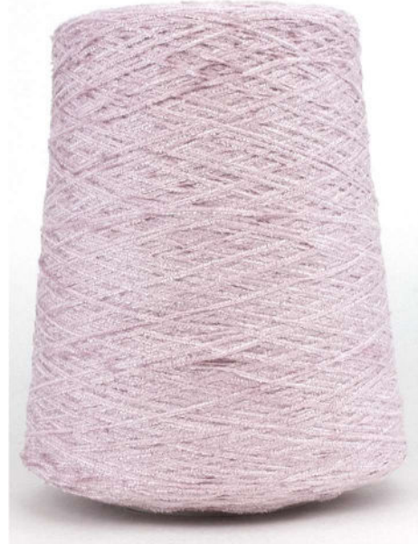
Farbe Artico Farbnummer. VF4