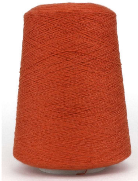
Farbe Rame Farbnummer. 2R3