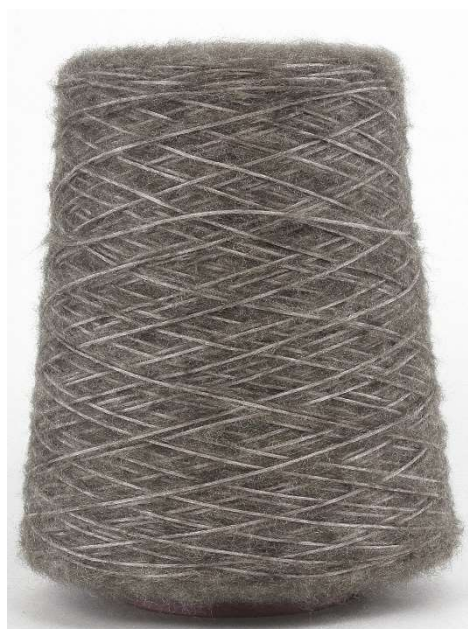
Farbe Ardesia mel. Farbnummer. 9VH