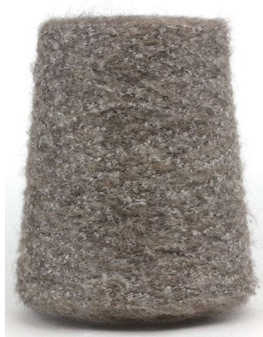
Farbe Sigaro Farbnummer. 2209