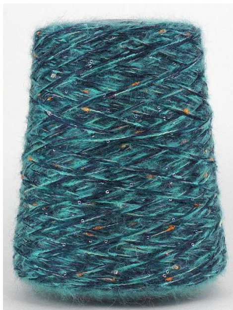
Farbe: Topas Farbnummer 4948