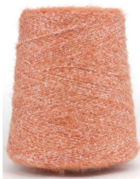
Farbe Pomo Farbnummer. 90739