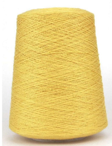
Farbe Honey Farbnummer. KAX