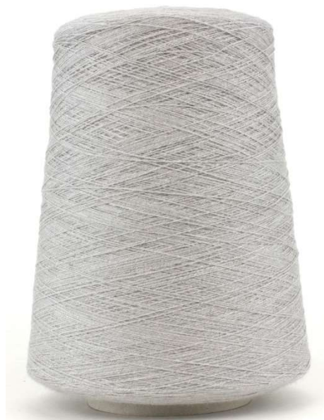
Farbe Gabbiano Mela Farbnummer. BN3