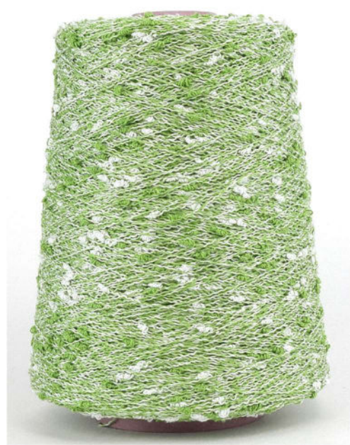
Farbe Pistacchio Farbnummer. X85