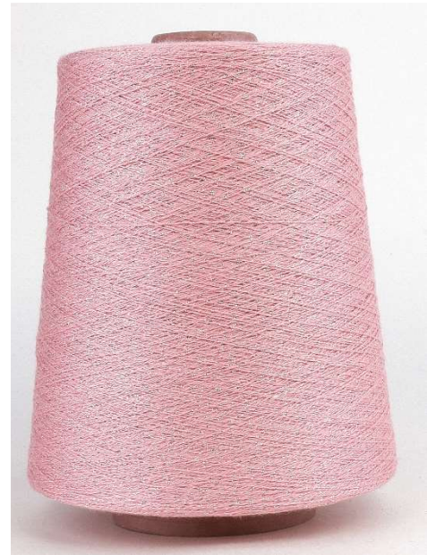
Farbe Cinabro Farbnummer. ZAE