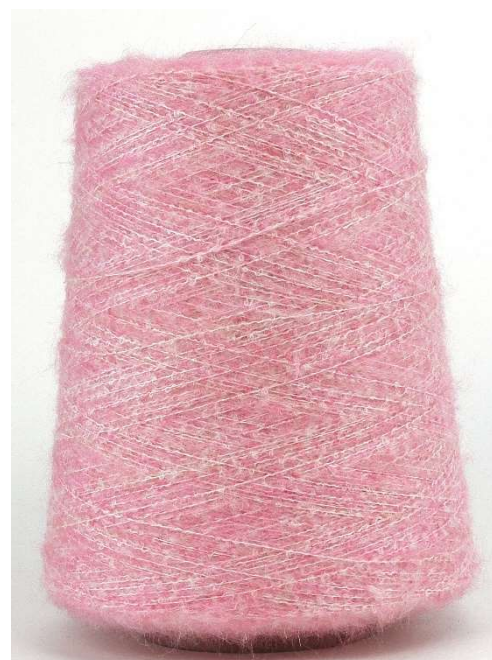
Farbe Azalea Farbnummer. 90794