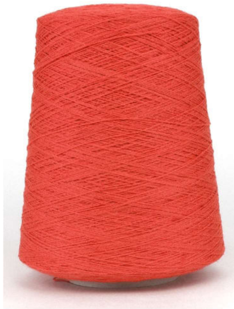
Farbe Chili Farbnummer. KAJ