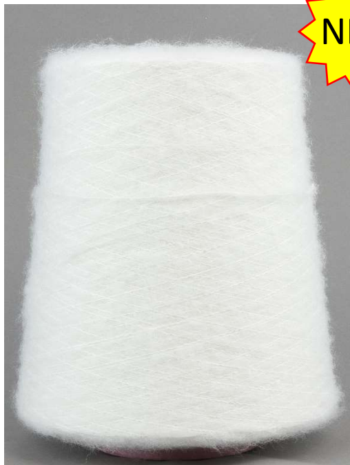
Farbe Bianco Farbnummer. CVS