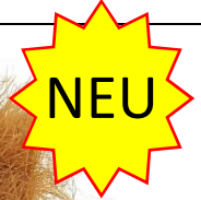
Farbe Brandy Farbnummer. S34