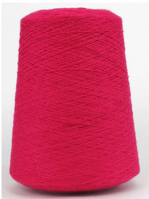
Farbe Amaryllis Farbnummer. HN4