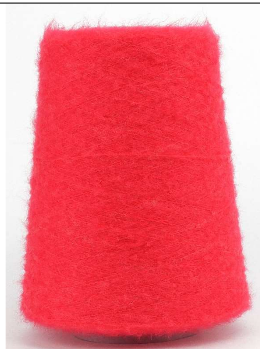
Farbe Rosso Farbnummer. 9Q7