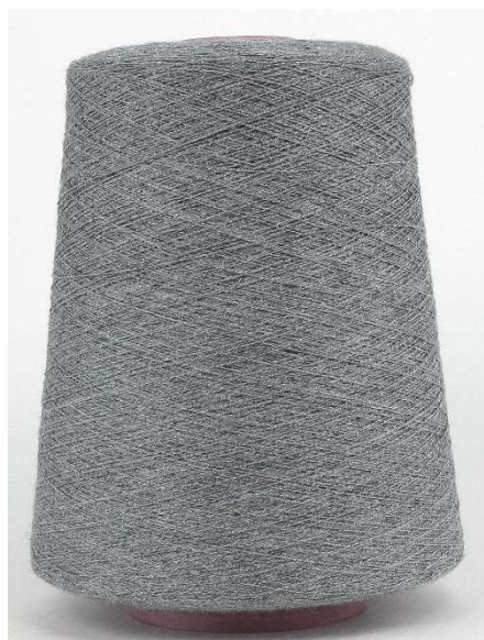
Farbe Asphalt Mel. Farbnummer. W1T