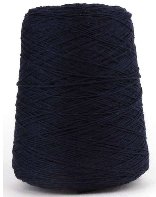
Farbe Bluek Farbnummer: 942