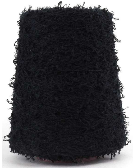
Farbe Nero Farbnummer. 12004