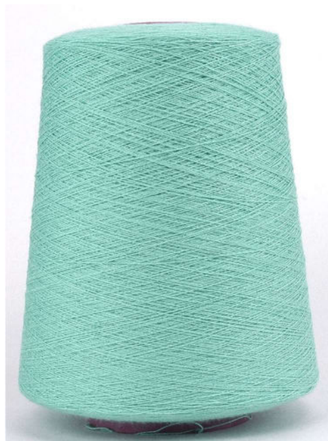
Farbe Ice Farbnummer. BAX