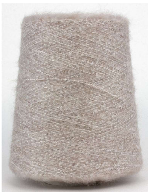
Farbe Frappe Farbnummer. 90735