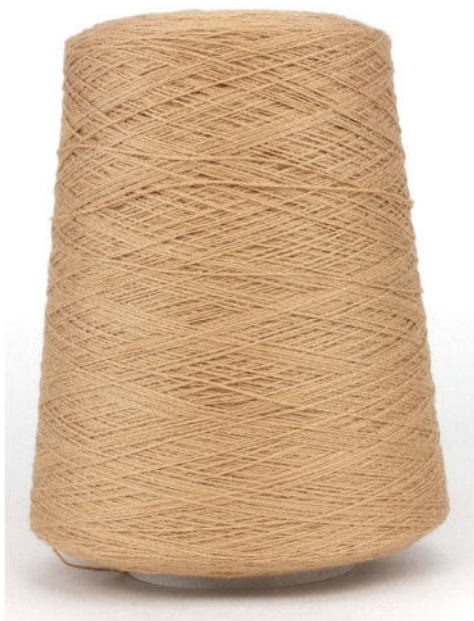
Farbe Beige Farbnummer. KAW