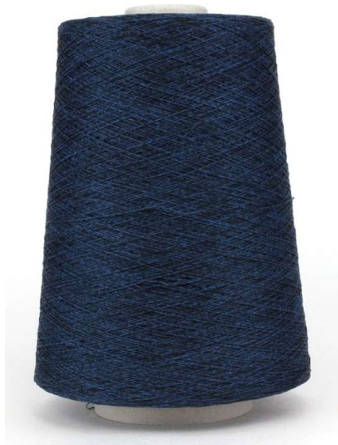
Farbe Deep Sea Farbnummer. 164