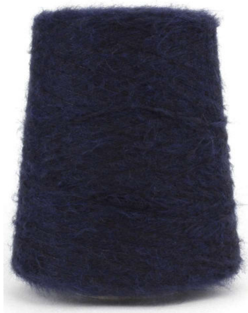
Farbe Bluette Farbnummer. 22525