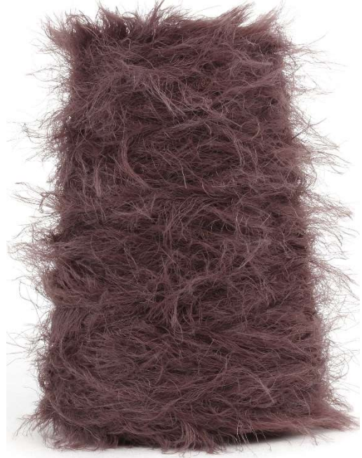
Farbe Garnet Farbnummer. VOX