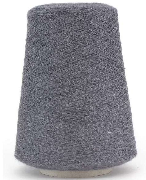
Farbe Graphit Farbnummer. OVS