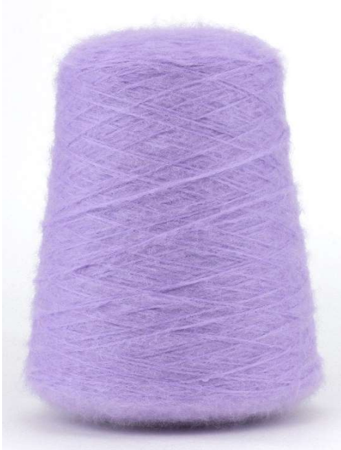
Farbe Violett Farbnummer L2W