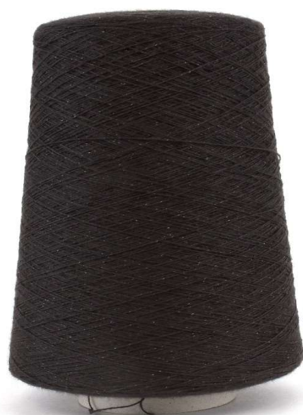
Farbe Espresso Censo Farbnummer. TR01