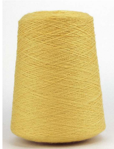
Farbe Giallo Farbnummer. EPB