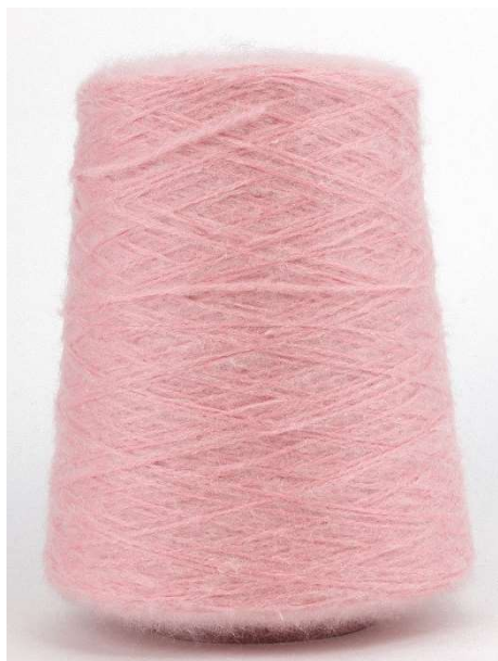
Farbe Puderrosa Farbnummer. 6LH