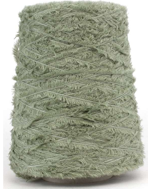
Farbe Cenericcio Farbnummer. VGC