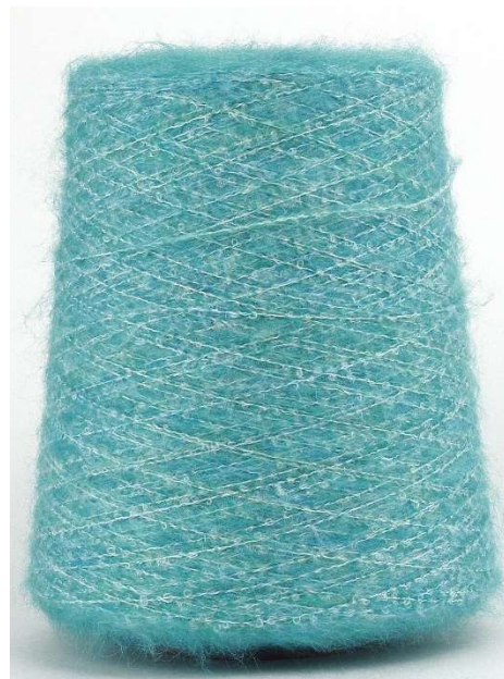
Farbe Turchese Farbnummer. 1149