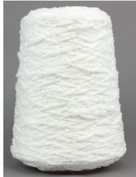
Farbe Bianco Farbnummer. 3900