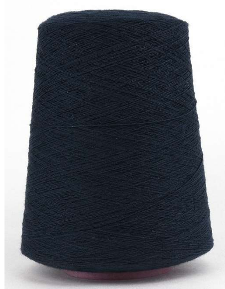
Farbe Blu Notte Farbnummer. NZ9