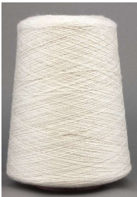
Farbe Spunga Farbnummer. Q8U