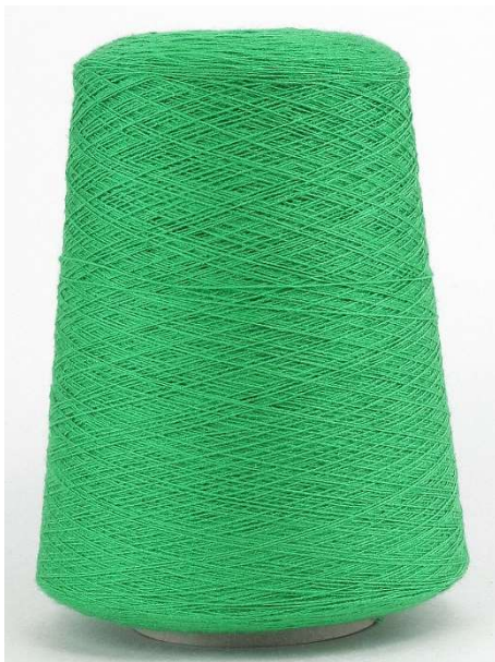
Farbe Smaragd Farbnummer. 3AE