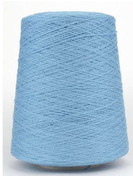
Farbe Blue Farbnummer. FXA