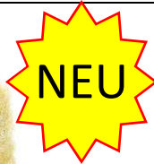
Farbe Polenta Farbnummer. 29518