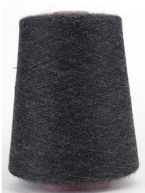
Farbe Anthrazit Farbnummer: 1145