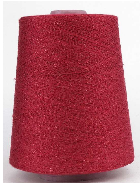
Farbe Vino Farbnummer. VUN