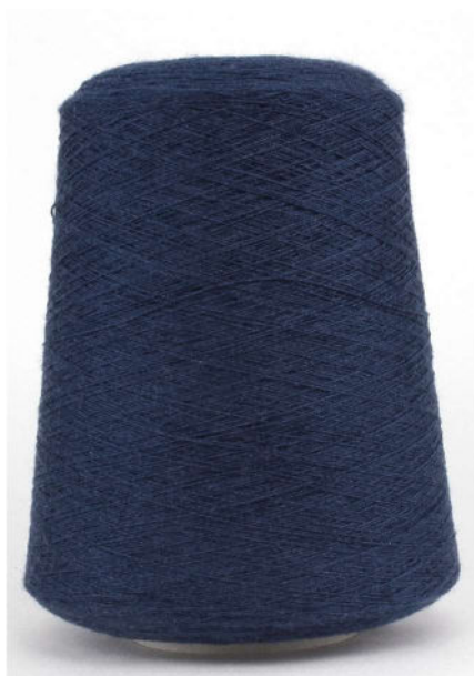
Farbe Blue Jeans Farbnummer. F8N