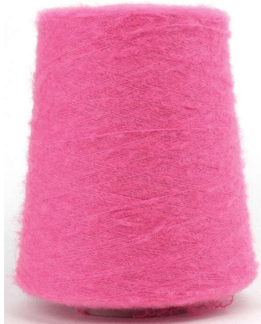
Farbe Pink Farbnummer. 9R0