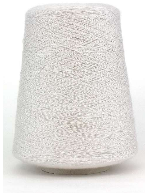
Farbe Chalk Farbnummer. BS9