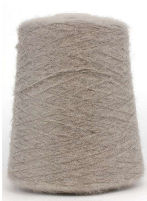
Farbe Tartufo Farbnummer. 9PU