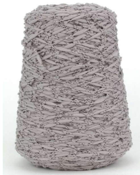
Farbe Taupe Farbnummer. 3905