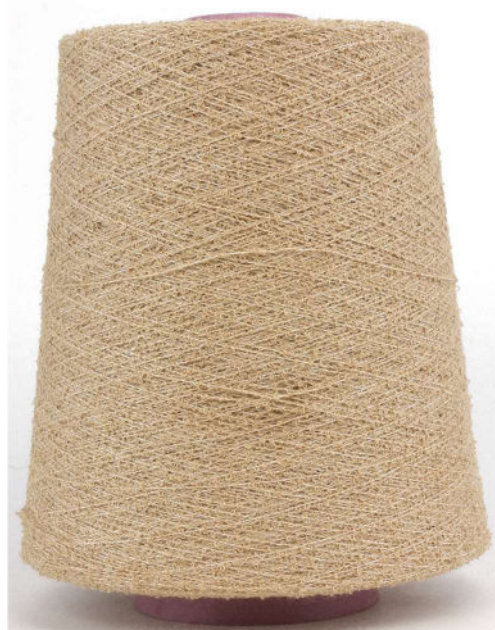
Farbe Torrone Farbnummer. 4002