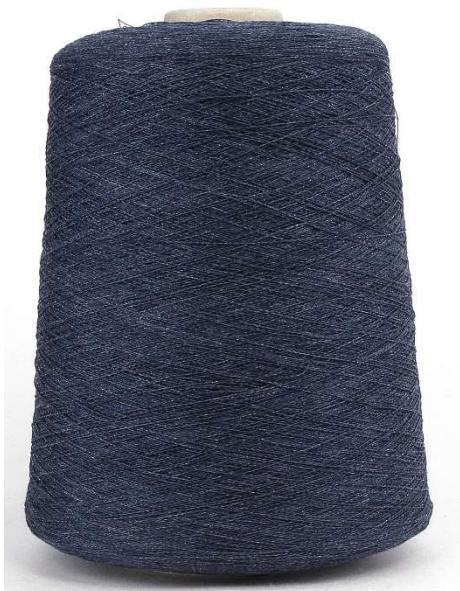
Farbe Nigt Blue Farbnummer. 926