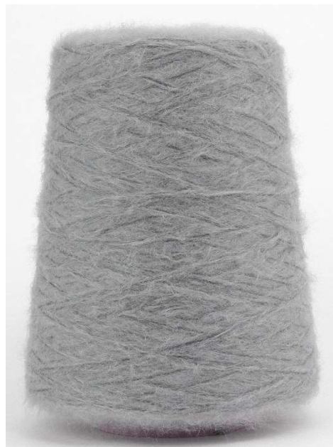
Farbe Kiesel Farbnummer. A05