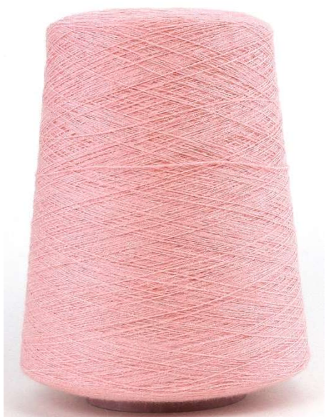
Farbe Fresh Corall Farbnummer. FGF