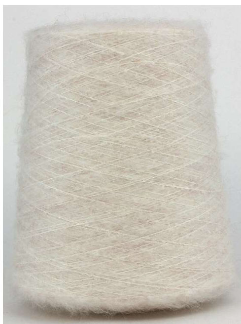
Farbe Rosina Farbnummer. 1194