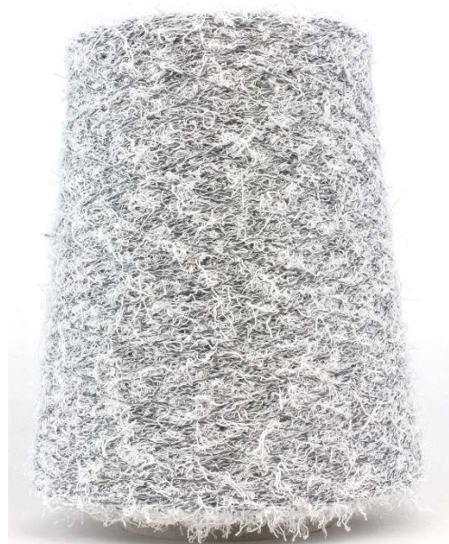
Farbe Black & White. Farbnummer. 9Q6