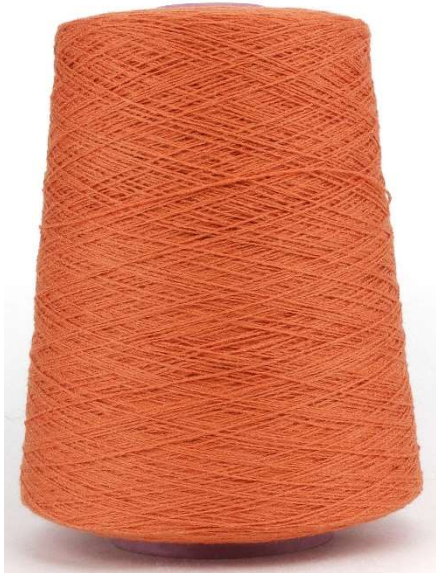
Farbe Kürbis Farbnummer. EMQ