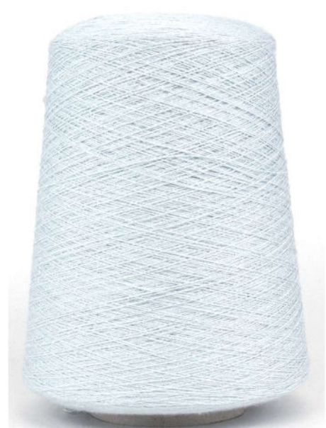
Farbe Powderblu Farbnummer. BFG