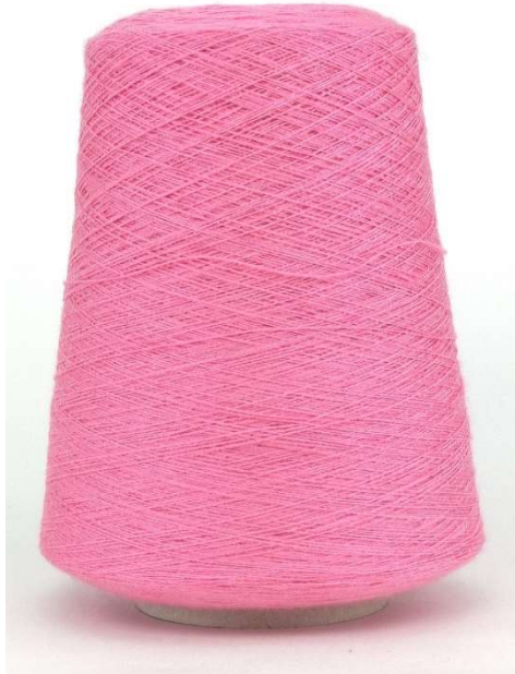
Farbe Magnolie Farbnummer. FHX