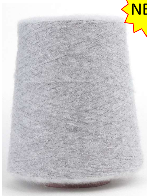
Farbe Silver Farbnummer. W33