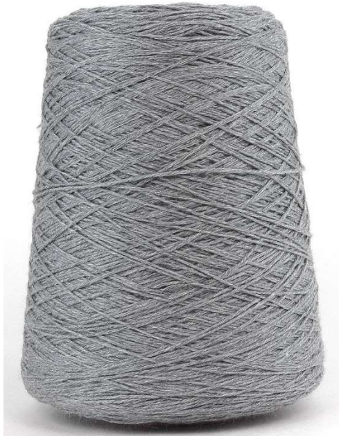
Farbe Heather Grey Farbnummer: WDG