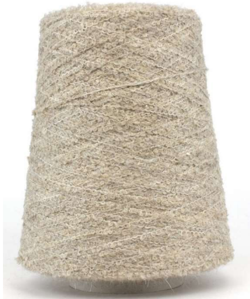
Farbe Mushroom Farbnummer 2314