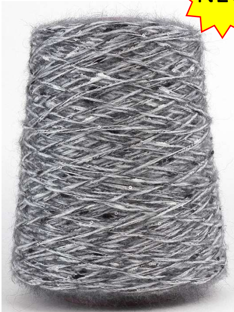
Farbe Flanell Farbnummer. 4909