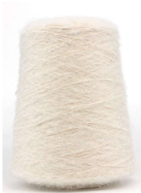
Farbe Cashew Farbnummer. 0J5