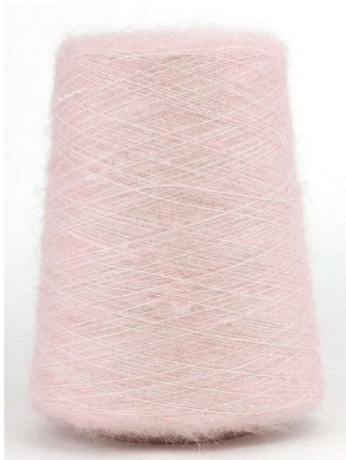
Farbe Rosa Farbnummer. 1357