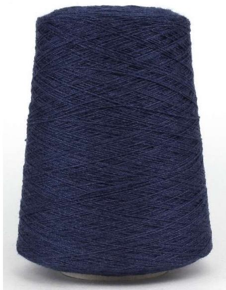
Farbe Blau Melange Farbnummer. GKD