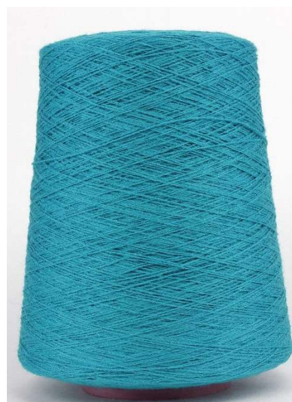
Farbe Türkis Farbnummer. EMP