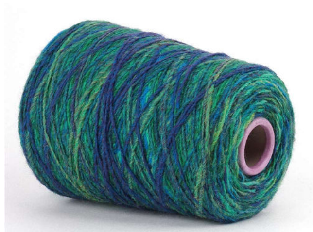
Farbe Pavona Farbnummer. 064389