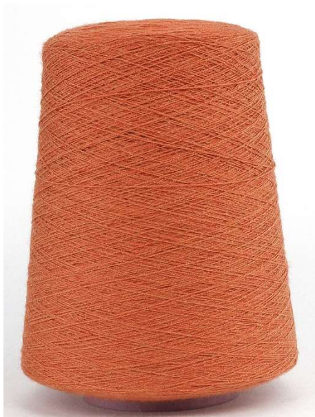
Farbe Allodola Farbnummer. 2F9