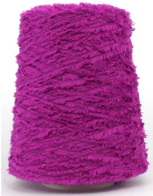
Carminio Farbnummer. V83