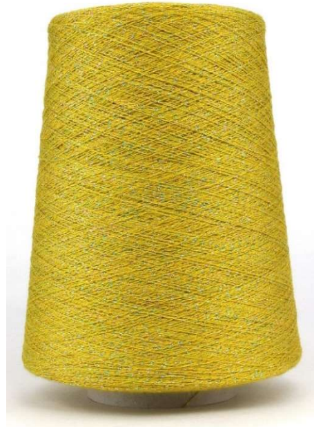
Farbe Ramarro Farbnummer. 8FA