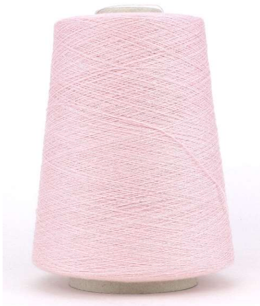
Farbe Light Rose Farbnummer. BJ6