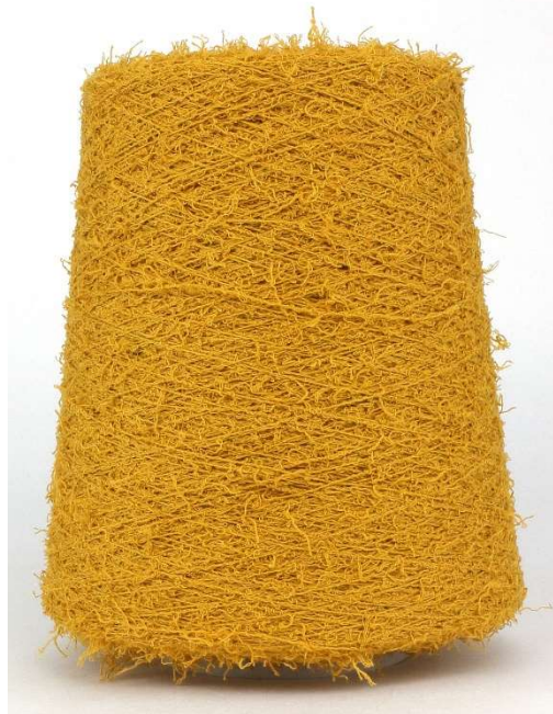
Farbe Cece Farbnummer. 4LN