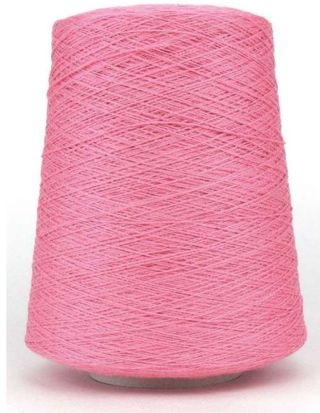
Farbe Magnolie Farbnummer. FXH