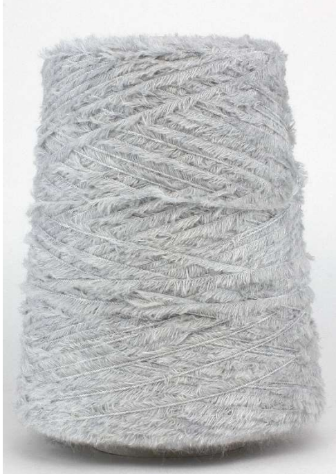
Farbe Gihaccio Farbnummer. 80H