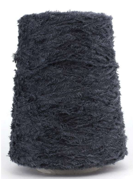
Farbe Anthracite Farbnummer. 80J