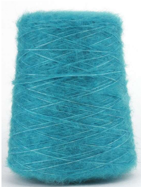
Farbe Mare Farbnummer. 94L