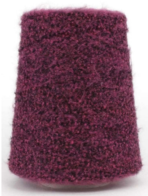
Farbe Bacca Farbnummer. 90803N