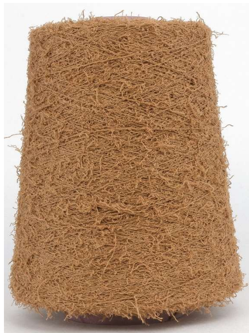
Farbe Kork Farbnummer. KWG