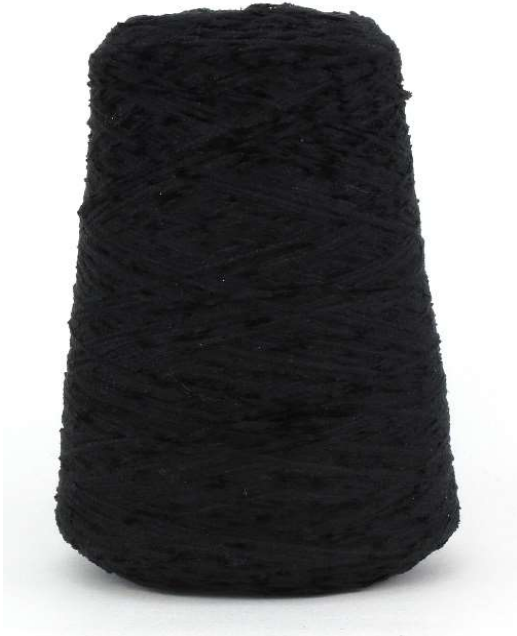
Farbe Nero Farbnummer. 099