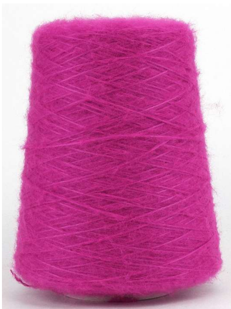
Farbe Hyazinte Farbnummer. 6Xf