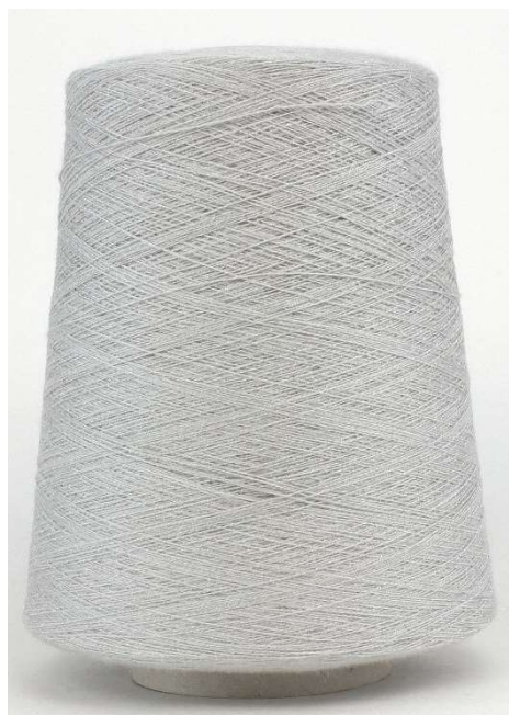
Farbe Smokey Grey Farbnummer. AR8