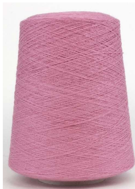
Farbe Raspberry Shake Farbnummer. HZ8