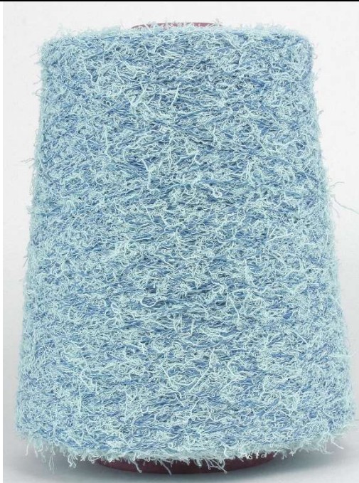
Farbe Tsuni Farbnummer. Y79