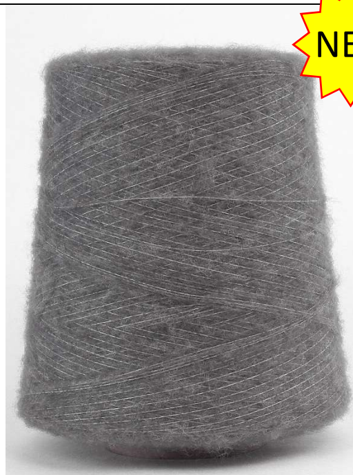
Farbe M'Grey Farbnummer. HWF