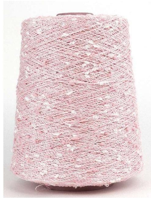
Farbe Rosa Farbnummer. X97