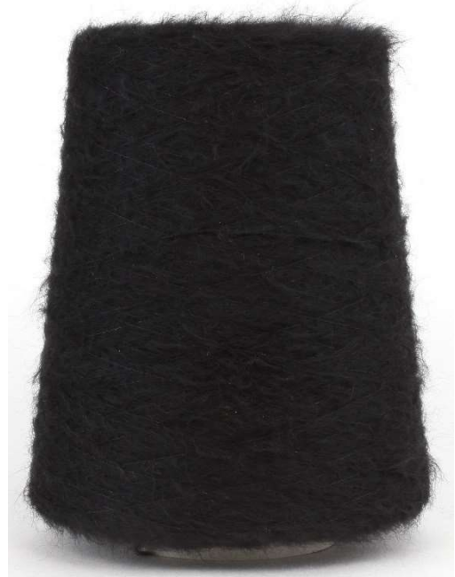
Farbe Nero Farbnummer. 22141