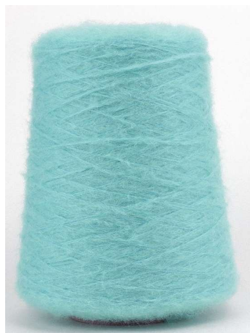
Farbe Türkis Farbnummer. LG7