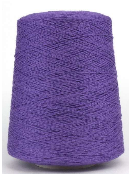
Farbe Violett Farbnummer. LZL