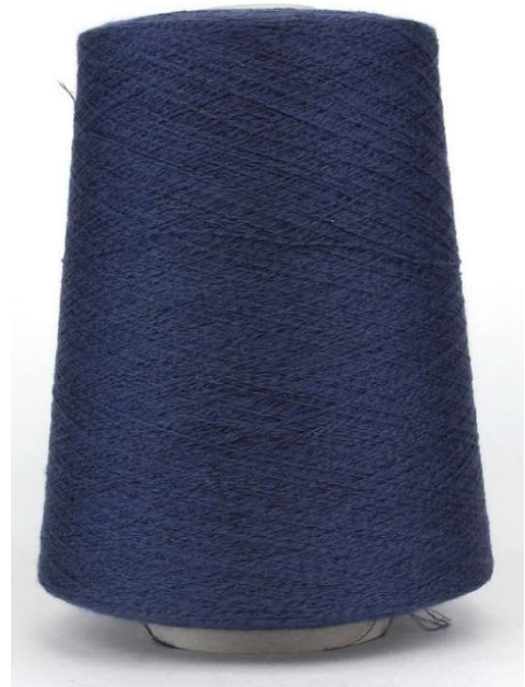
Farbe Blue Jeans Farbnummer. FE0