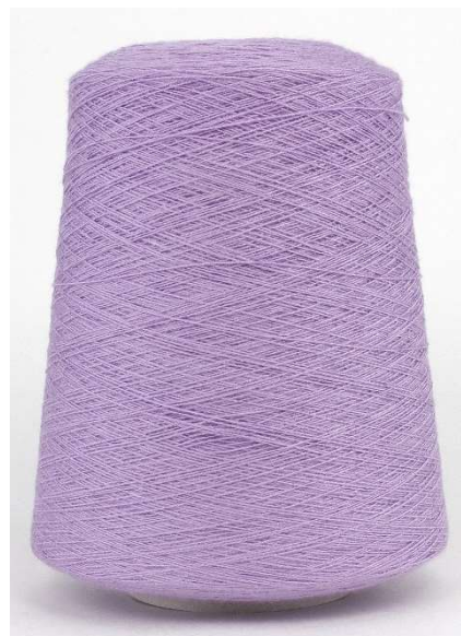
Farbe Purple Farbnummer. L2W