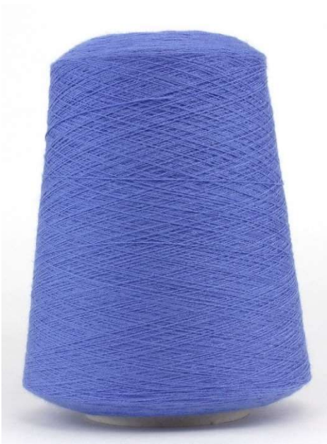
Farbe Kobalt Farbnummer. H9X