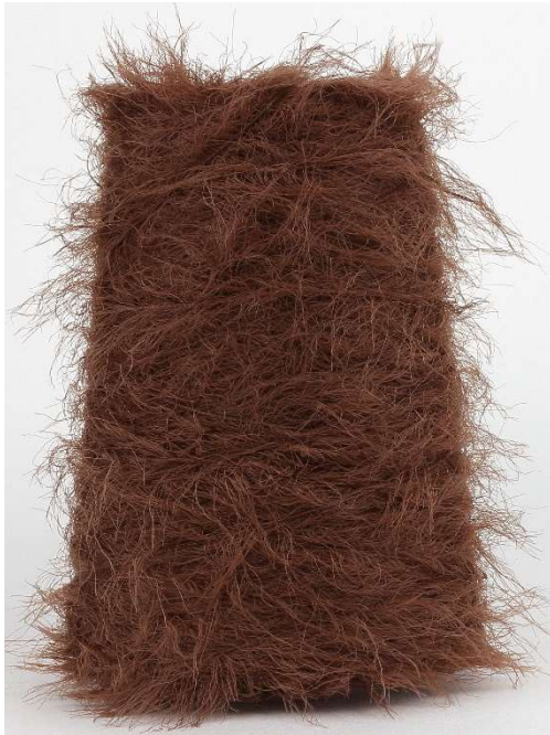
Farbe Castagna Farbnummer. D92