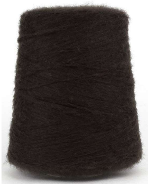
Farbe Rovere Farbnummer. LQN