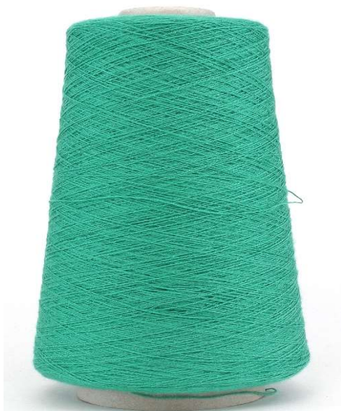
Farbe Pavone Farbnummer. J9L