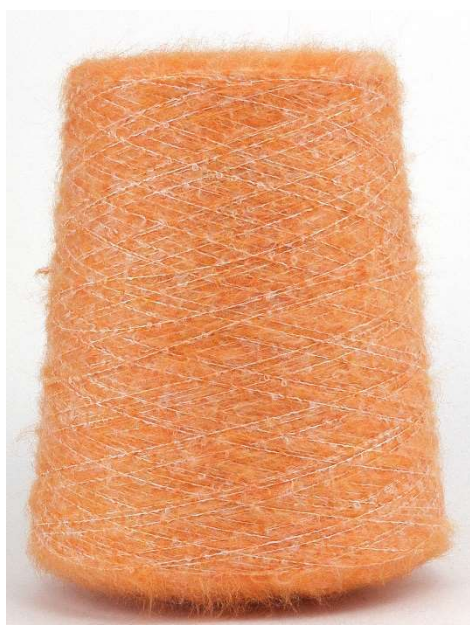
Farbe Arancio Farbnummer. 1522