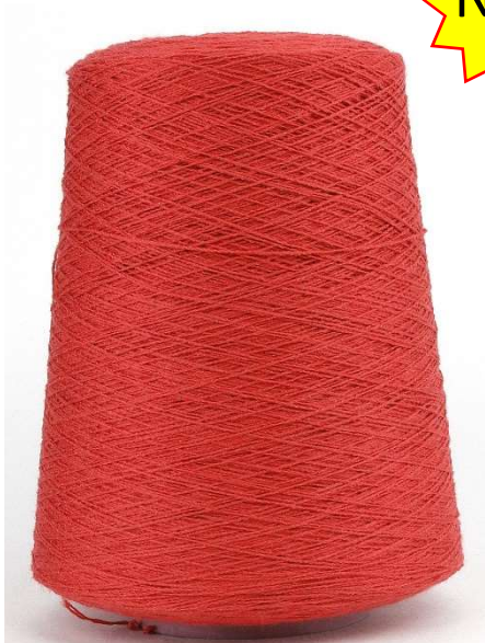
Farbe Carotta Farbnummer. B1W