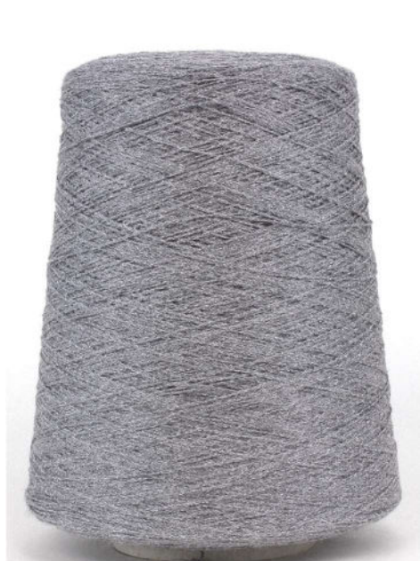
Farbe Grigio Melange Farbnummer. QAA