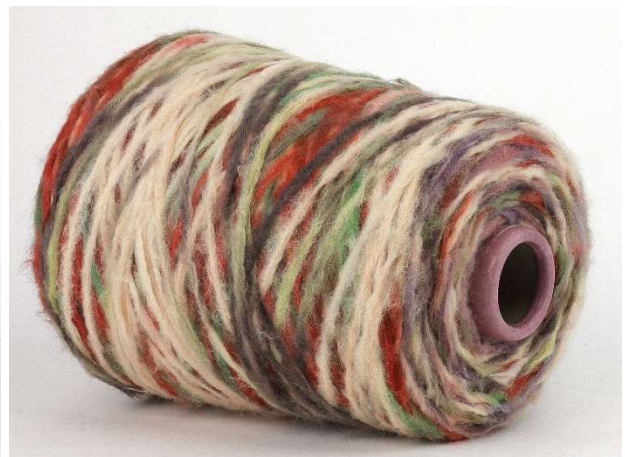
Farbe: Marrone Beige Multicolor Farbnummer. 8BD