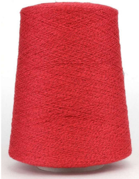
Farbe Papavero Farbnummer. 8I6