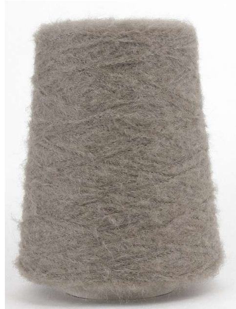
Farbe Fango Farbnummer. 244