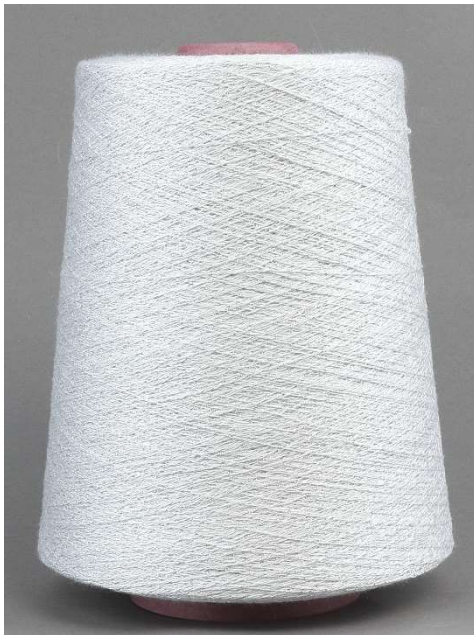
Farbe Bianco Farbnummer. VW7