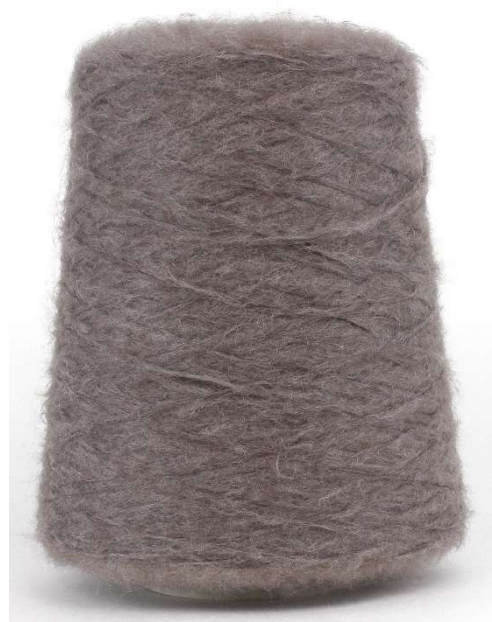
Farbe Taupe Farbnummer. M1A