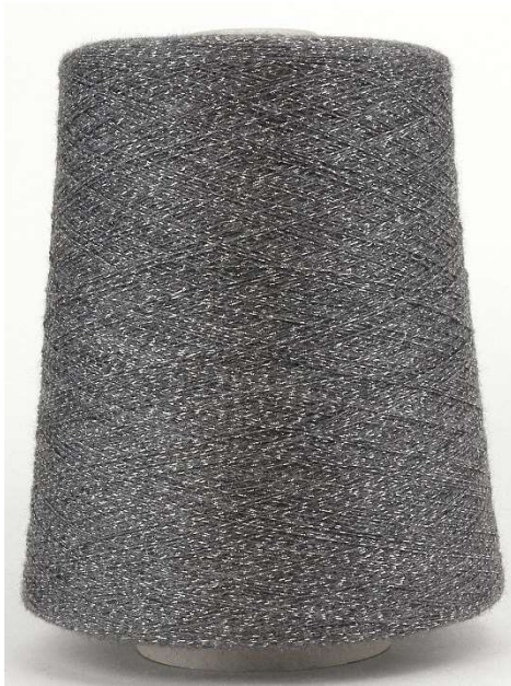
Farbe Platino (Silber Lurex) Farbnummer. YFK