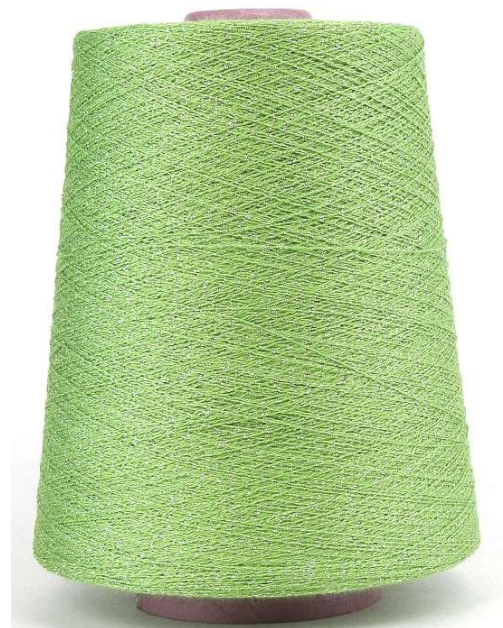
Farbe Prato Farbnummer. VHM