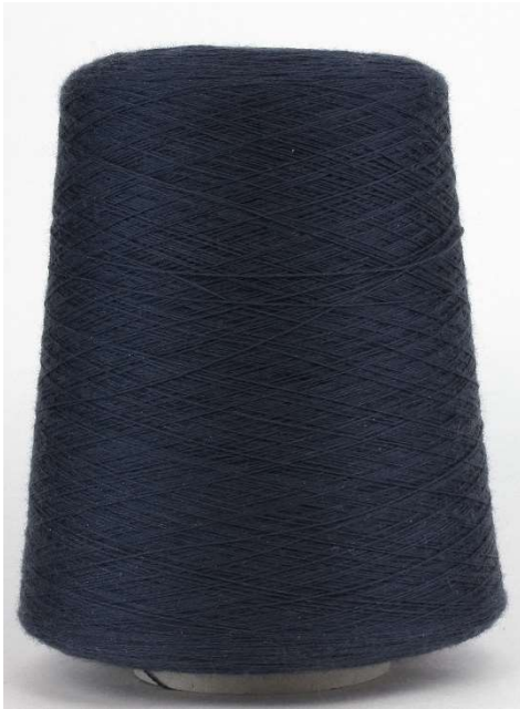
Farbe Indigo Farbnummer. 028363