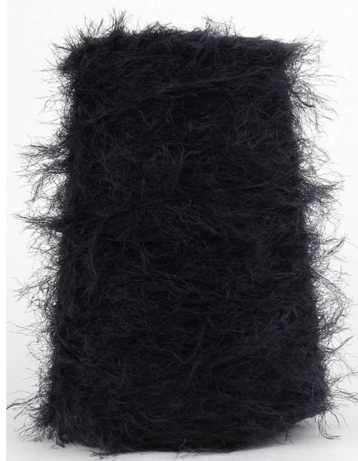
Farbe Nero Farbnummer. 099