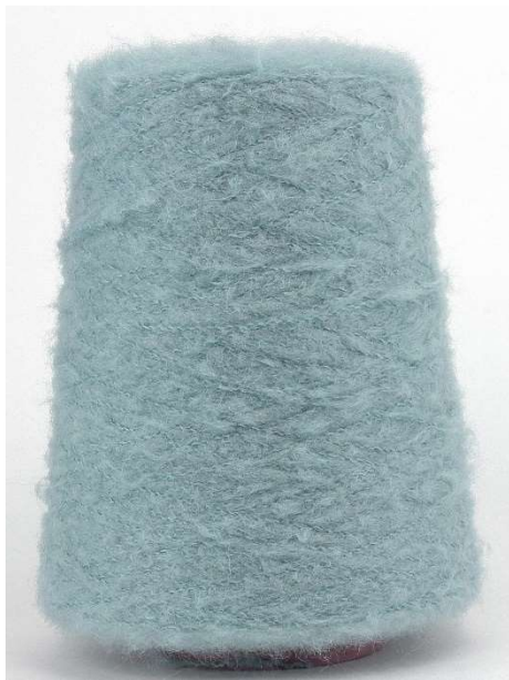
Farbe . Carta Zucchero Farbnummer. 238