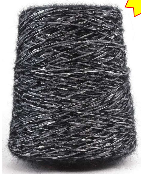
Farbe Nero Farbnummer. 4915