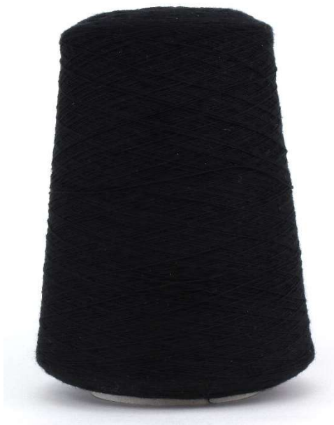
Farbe Nero Farbnummer. 099