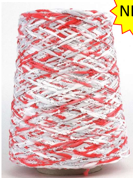
Farbe Flamingo Farbnummer. 20746