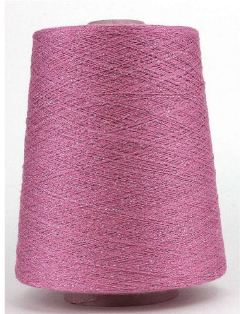
Farbe Peonia Farbnummer. VHQ