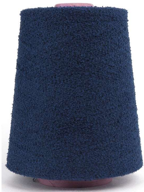
Farbe Baltic Sea Farbnummer 4023