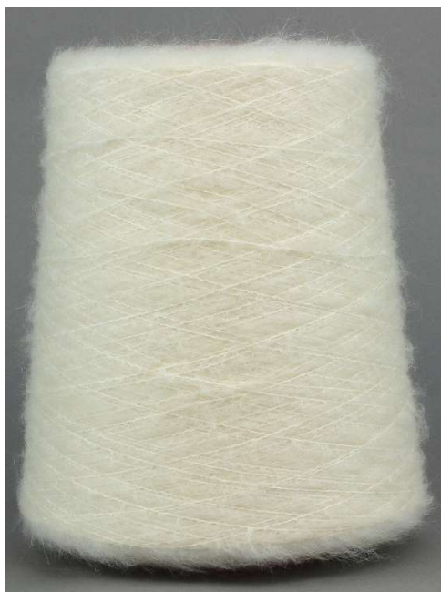
Farbe Panna Farbnummer. 1110