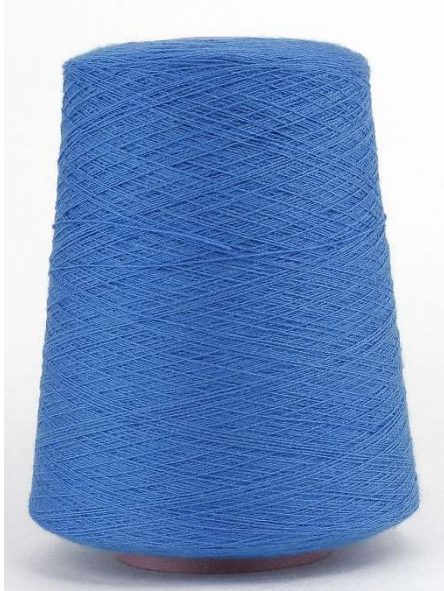
Farbe Royal Blue Farbnummer. E0T