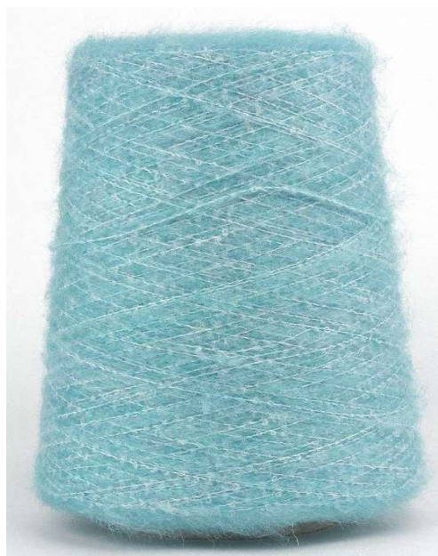
Farbe Lago Farbnummer. 1156