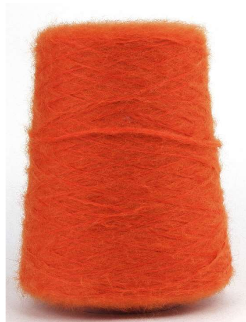
Farbe Orange Farbnummer. CZK