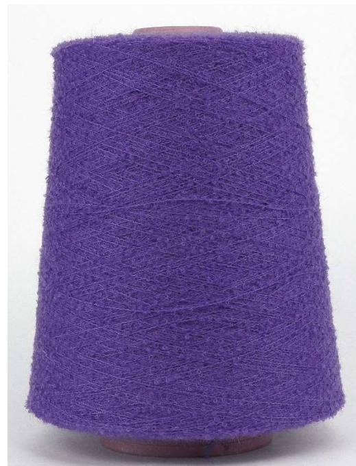
Farbe Violett Farbnummer. 280