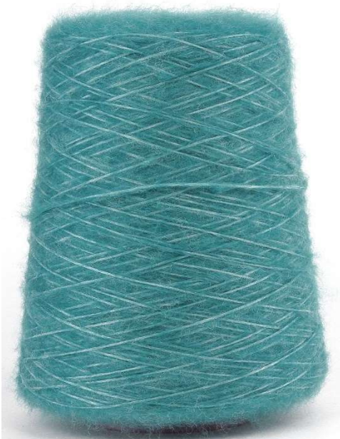
Farbe Fiele Farbnummer. 8LA