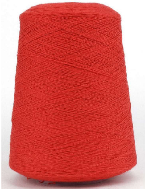
Farbe Paprika Farbnummer. HAA