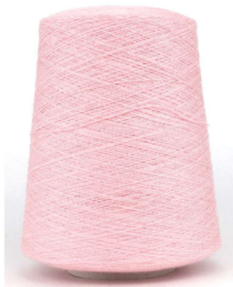
Farbe Rosa Pastello Farbnummer. QOZ