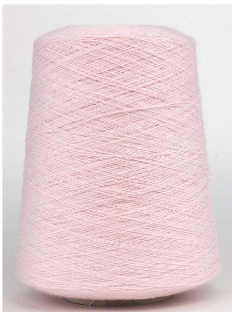
Farbe Petalo Farbnummer. 3P4