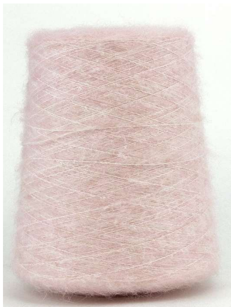
Farbe Cipria Farbnummer. 1148