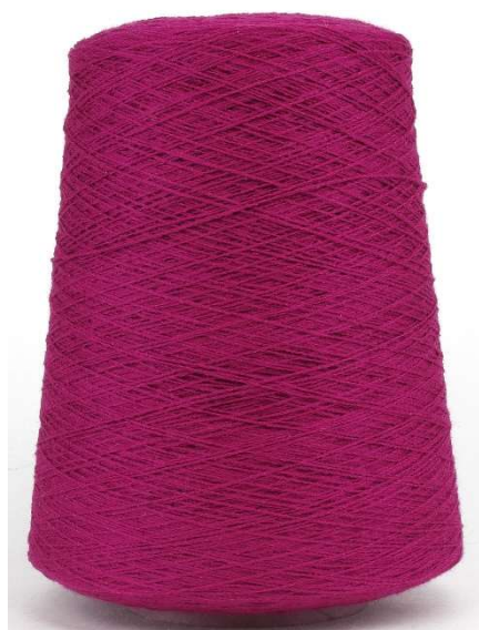
Farbe Magenta Farbnummer. LZK