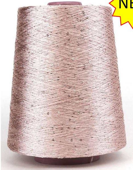
Farbe Rosa Antico Farbnummer. 7604