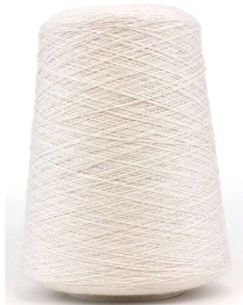
Farbe Totoro Farbnummer. 0Q4