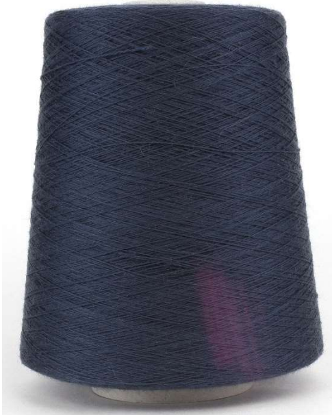
Farbe Indigo Farbnummer. 028363