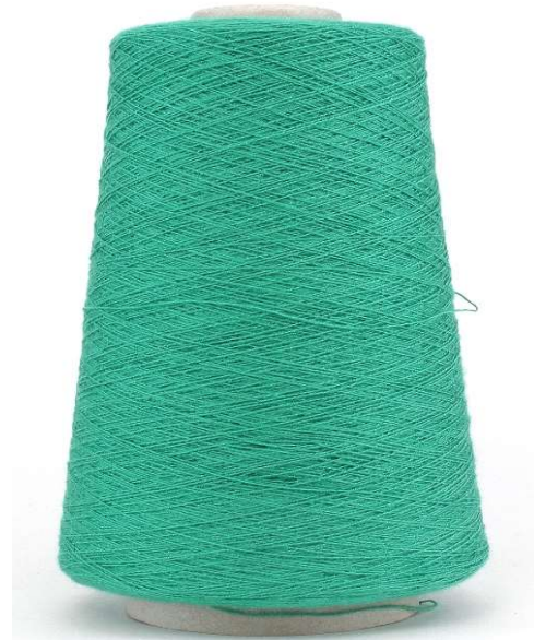
Farbe Pavone Farbnummer. J9L