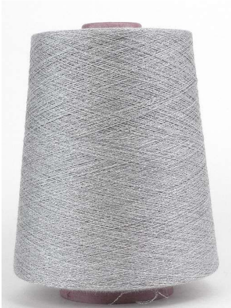
Farbe Grigio Chiaro Farbnummer. WMS