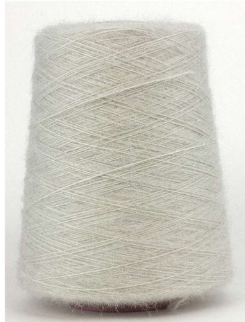
Farbe Platin Farbnummer. 31