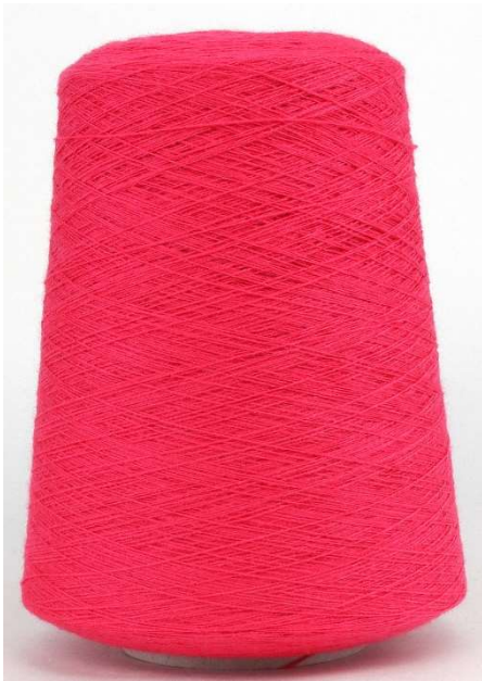
Farbe Corallo Farbnummer. NZR