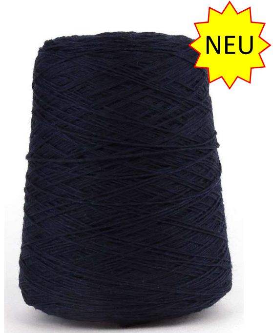
Farbe Bluek Farbnummer: 942