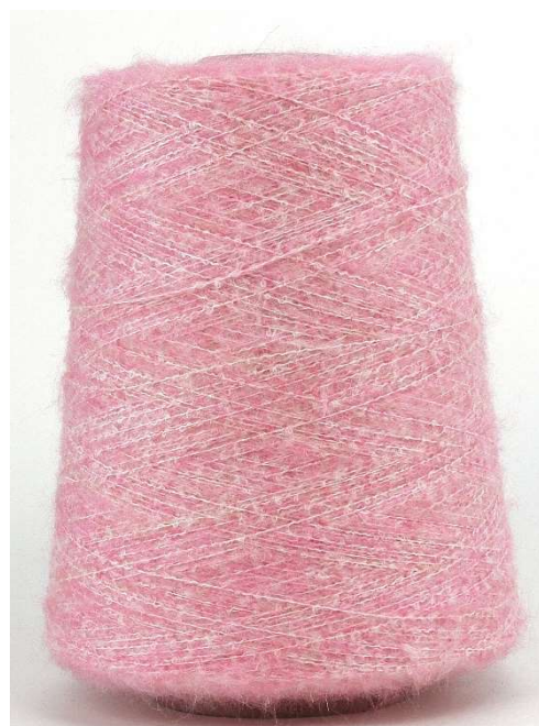
Farbe Azalea Farbnummer. 90794