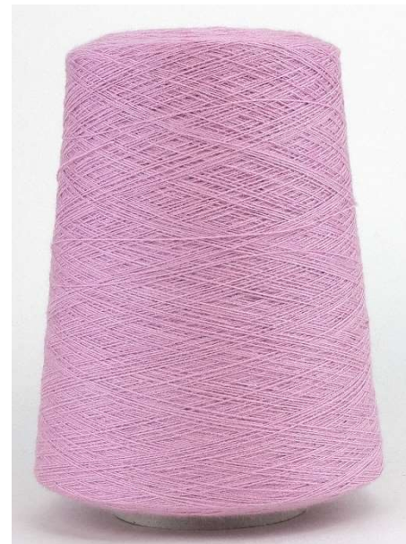
Farbe Jasmin Farbnummer. 6ZE