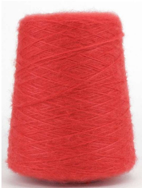
Farbe Senape Farbnummer STW