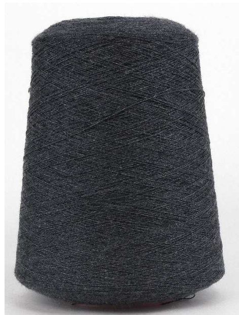
Farbe Anthrazit Farbnummer. BJG