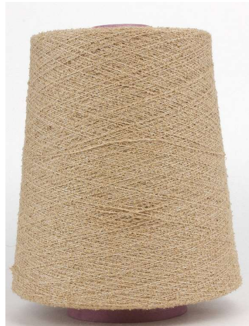
Farbe Torrone Farbnummer. 4002