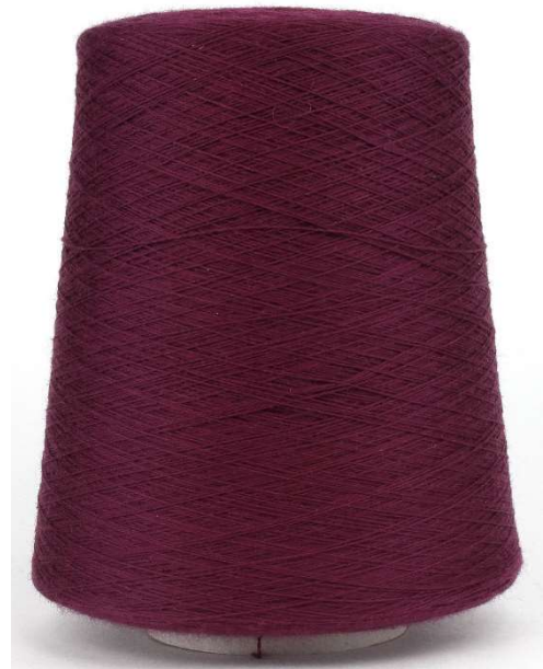
Farbe Vino Farbnummer. 527