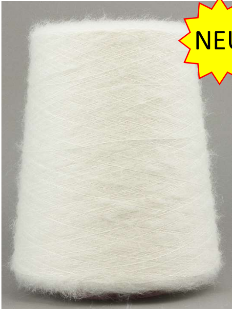
Farbe Bianco Farbnummer. 901