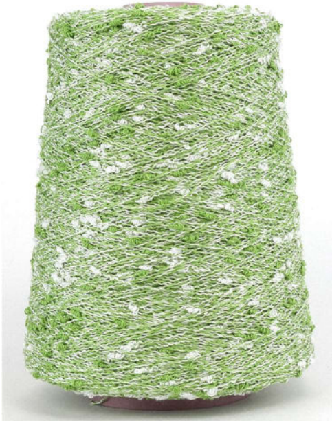
Farbe Pistacchio Farbnummer. X85