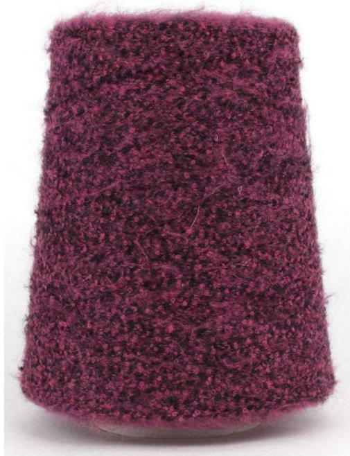
Farbe Bacca Farbnummer. 90803N