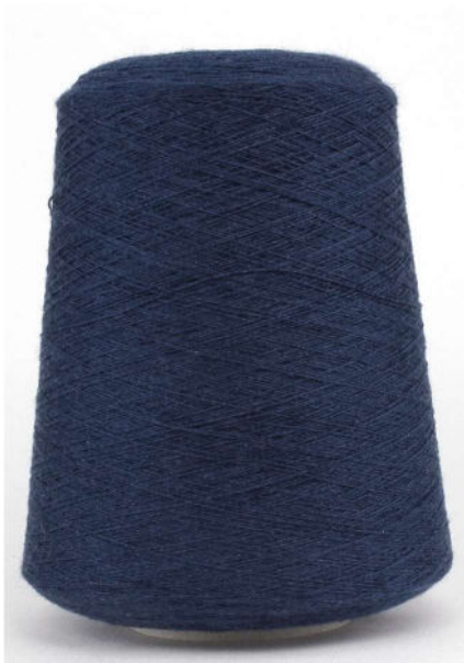
Farbe Blue Jeans Farbnummer. F8N