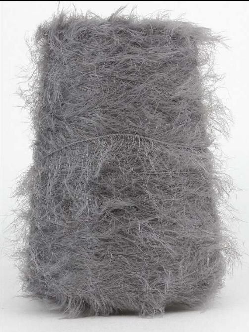
Farbe Amarena Farbnummer. 3R7