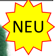
Farbe Loden Farbnummer 9S2