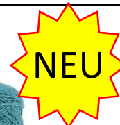
Farbe Petrol Farbnummer. 552