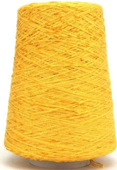
Farbe Polenta Farbnummer. DGP