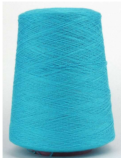
Farbe Türkis Farbnummer. 39E