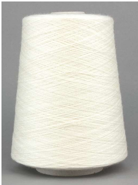
Farbe Crema Farbnummer. 1205