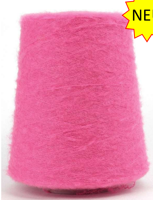
Farbe Pink Farbnummer. 9R0