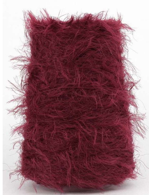
Farbe Amarena Farbnummer. 3R7