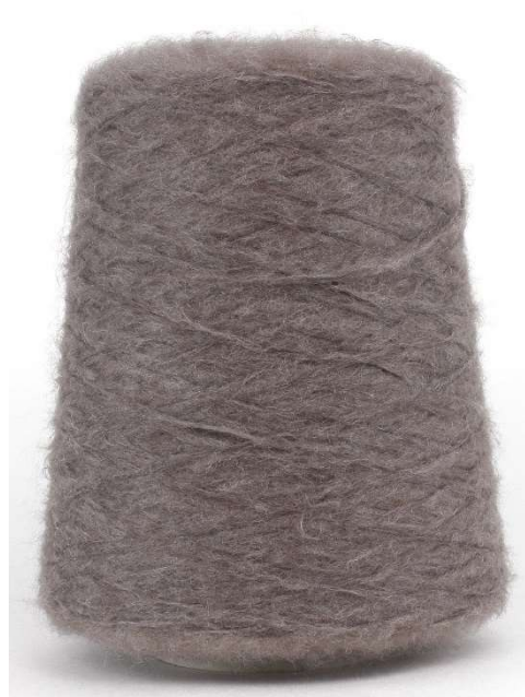
Farbe Taupe Farbnummer. M1A