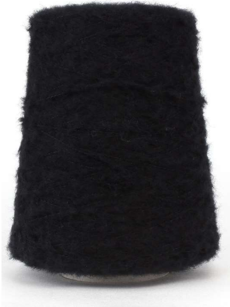
Farbe Nero Farbnummer. 099