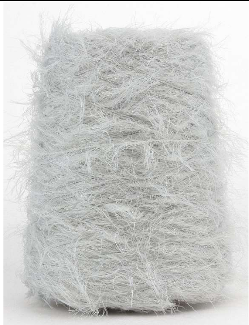
Farbe Gabbiano Farbnummer. 071