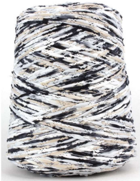
Farbe Street Farbnummer. 4001