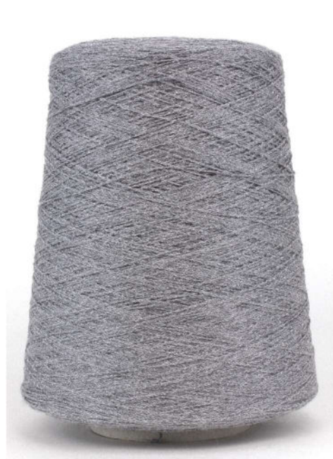
Farbe Grigio Melange Farbnummer. QAA