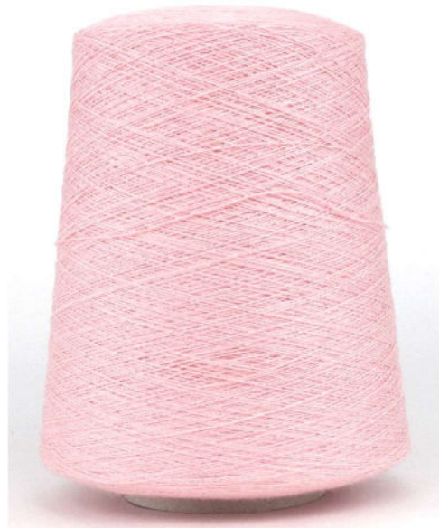
Farbe Rosa Pastello Farbnummer. QOZ