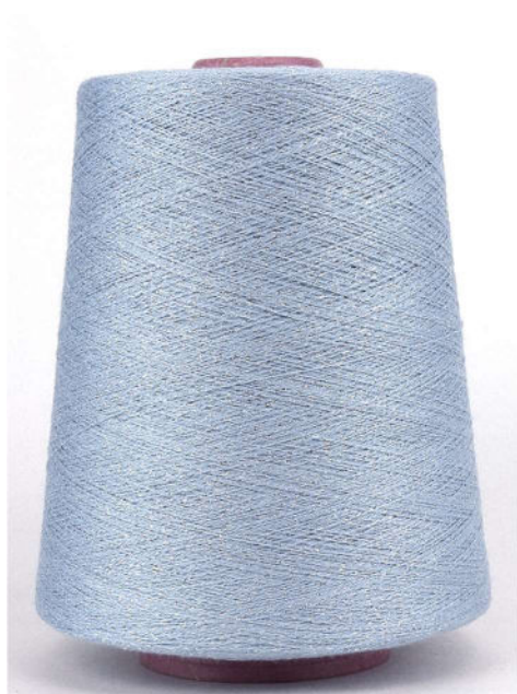
Farbe Celeste Farbnummer. WEC