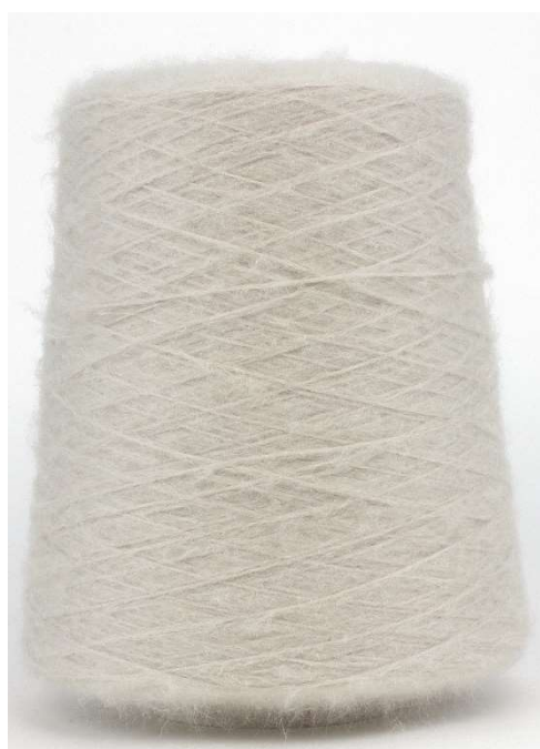
Gabbiano Farbnummer. 9PT