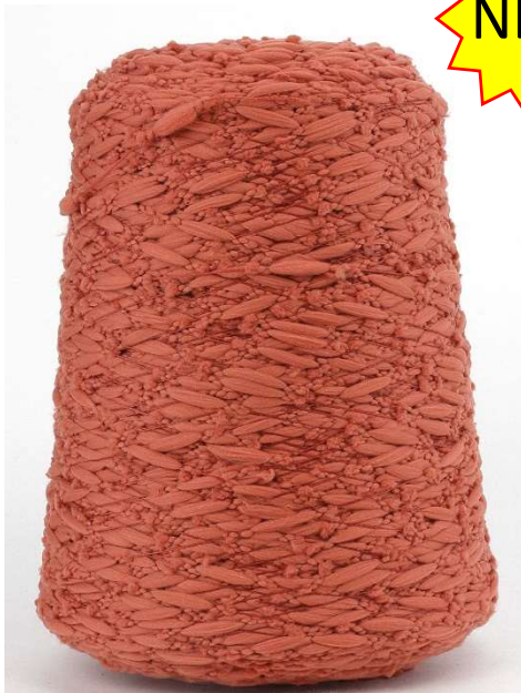
Farbe Terracotta Farbnummer. 20746