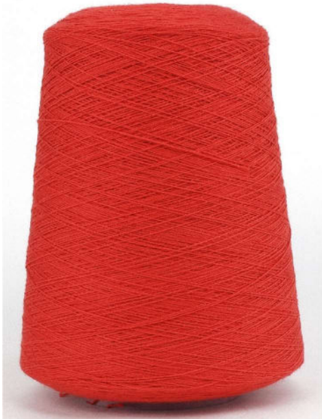
Farbe Paprika Farbnummer. HAA