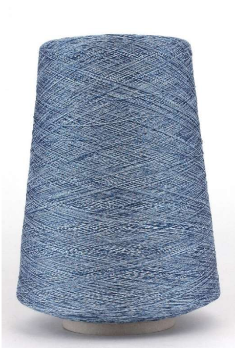
Farbe Tinto Farbnummer. 203