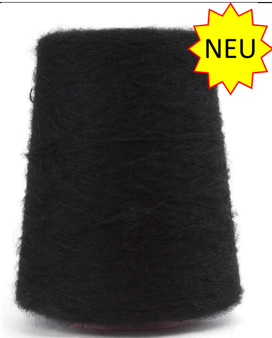
Farbe: Nero Farbnummer 099