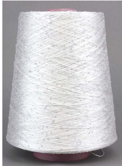
Farbe Bianco Farbnummer. EE001