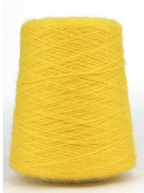
Farbe Yellow Farbnummer. H0X