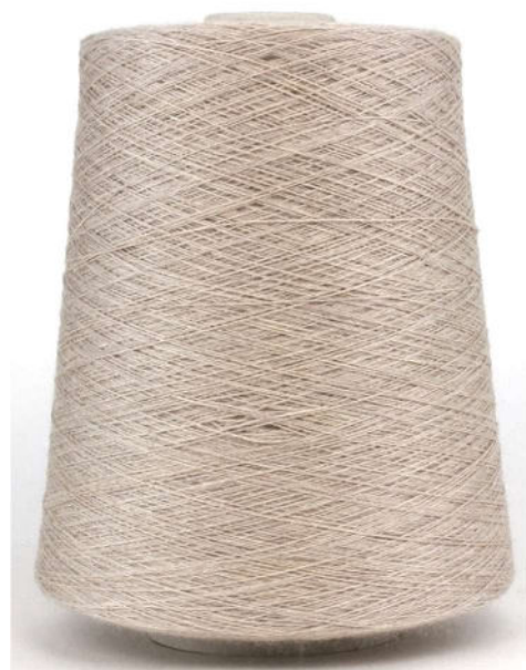
Farbe Milchkaffee Farbnummer. 421969