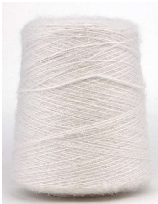
Farbe Mamo Farbnummer. NBC