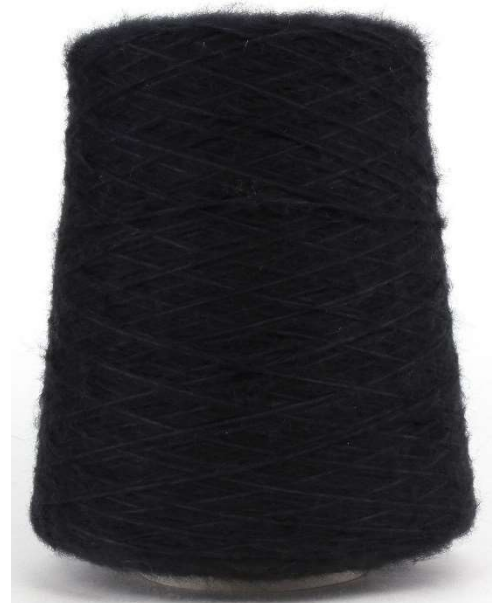
Farbe Nero Farbnummer. 099