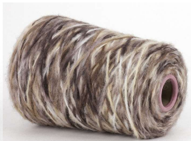
Farbe Cinghiale Farbnummer. 8BH