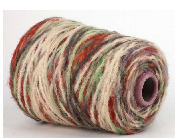
Farbe: Marrone Beige Multicolor Farbnummer. 8BD