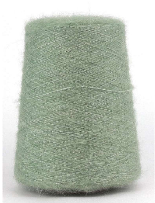
Farbe Salvia Farbnummer. 1364