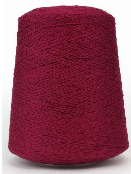
Farbe Vino Farbnummer. QHG