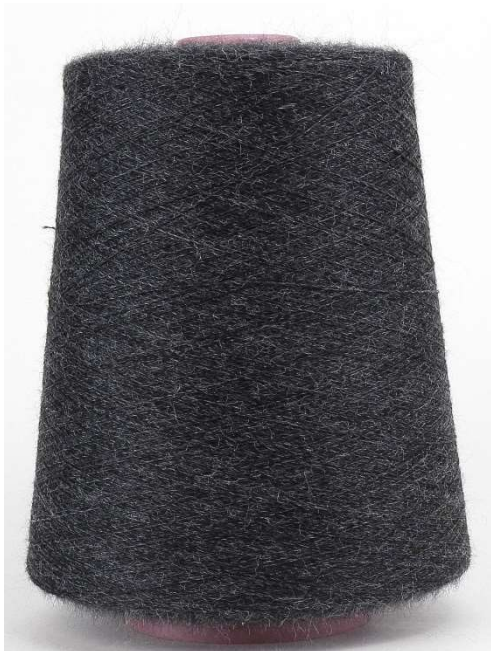
Farbe Anthrazit Farbnummer: 1145