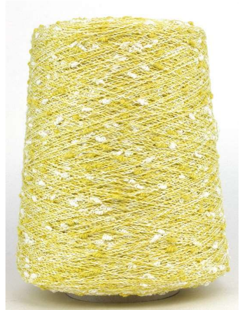
Farbe Cedro Farbnummer. VGL