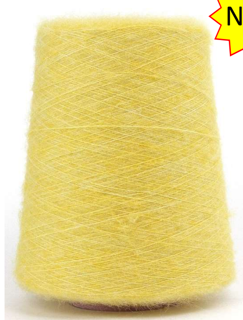
Farbe Yellow Farbnummer. 500858