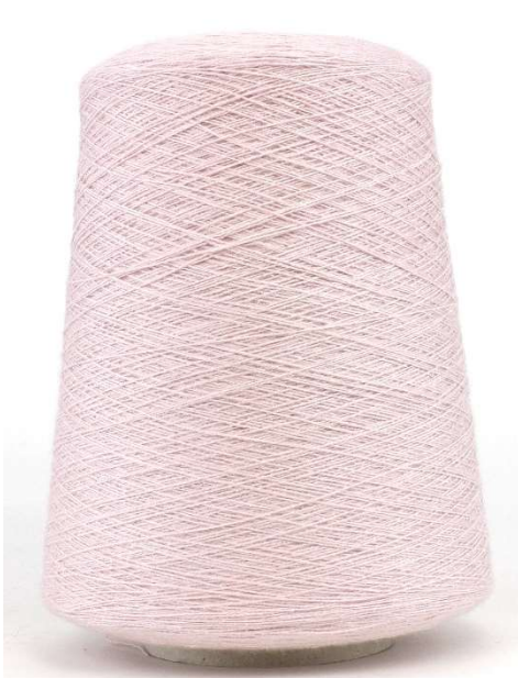
Farbe Orchid Farbnummer. HU7