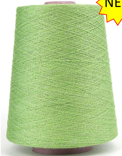
Farbe Prato Farbnummer. VHM