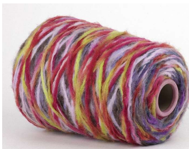
Farbe: Vina-Ottanio Multicolor Farbnummer. 8B9