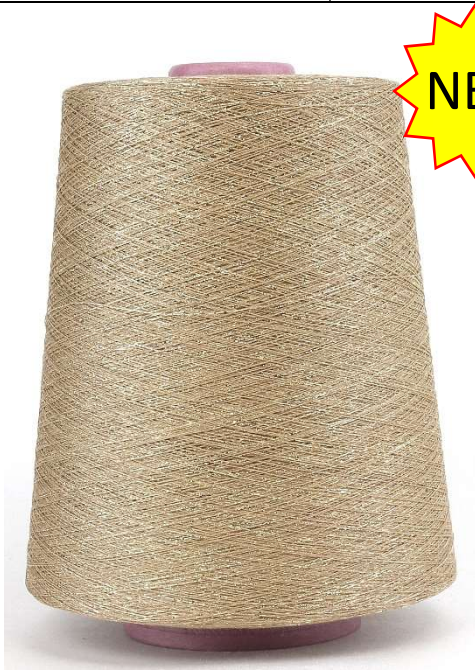
Farbe:Beige Gold Farbnummer: 1340