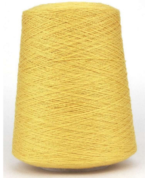
Farbe Honey Farbnummer. KAX