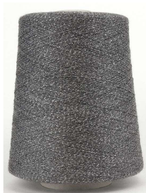
Farbe Platino (Silber Lurex) Farbnummer. YFK