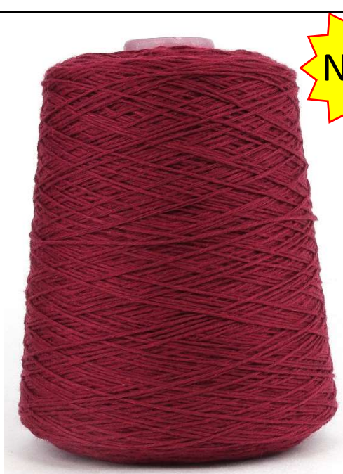
Farbe Cabernet Farbnummer: 928