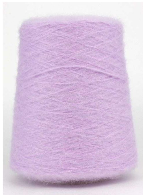
Farbe Viola Farbnummer. LQR