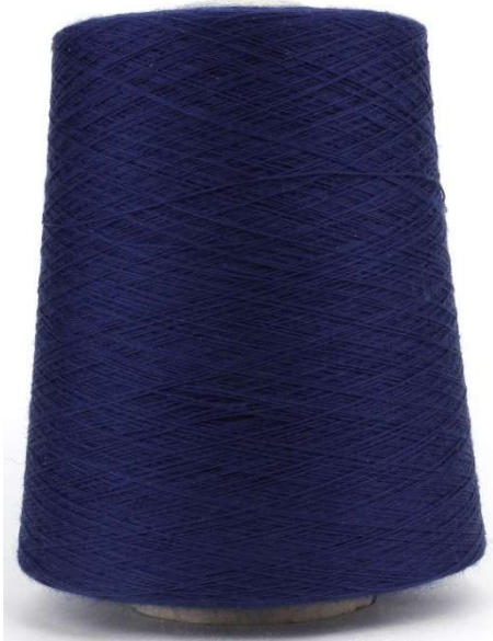
Farbe Ultramarin Farbnummer. 008804