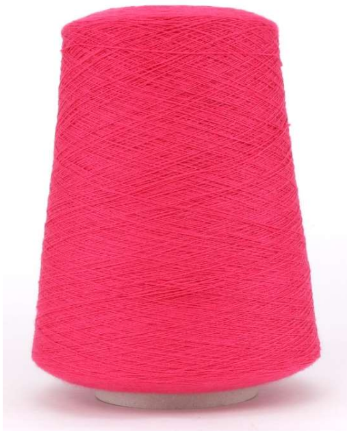
Farbe Ciclamino Farbnummer. G01