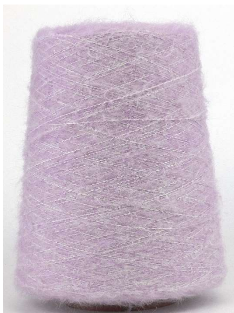
Farbe Orchidea Farbnummer. 90734