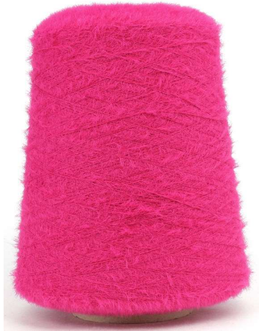
Farbe Pink Farbnummer. 807