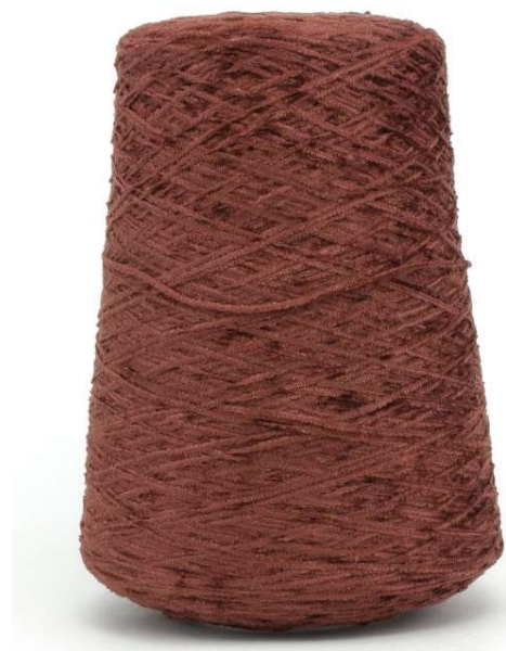
Farbe Castagna Farbnummer. P94