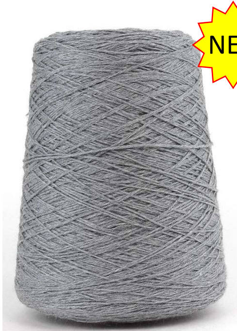
Farbe Heather Grey Farbnummer: WDG