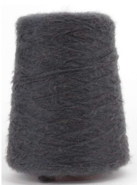
Farbe Asphalt Farbnummer. 6 VL